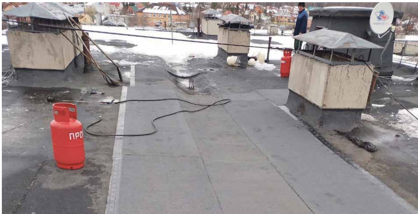
■ Кровлю на Белкинской, 17 придется снова ремонтировать управляющей компании