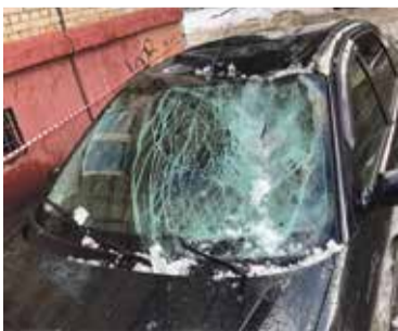
■ А так выглядела машина, на которую упала ледяная глыба на Жوليو-Кюри, 3 (Обнинск)

Но, как показывает практика, такая вот мелочь может нанести гораздо больше ущерба, чем все другие недоработки УК вместе взятые. Что может быть дороже жизни и здоровья? Да и ремонт автомобиля — дело сложное и дорогостоящее. Понятное дело, что хозяин поврежденной машины рано или поздно потребует возмещения материального ущерба через суд, но на это уйдет уйма времени, а автомобиль — целый и невредимый — нужен здесь и сейчас.