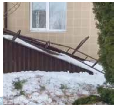
■ Белкинская, 46Б — прохожим повезло, что эта железзяка с крыши не упала им на голову (Обнинск)

Если имущественный вред не будет погашен в добровольном порядке, пострадавшей стороне необходимо обратиться в суд. Если ущерб составляет менее 100 тысяч рублей, то иск подаётся в мировой суд, а если он превышает данную сумму, то в городской или в районный суд. Главное — знать свои права и воспользоваться ими, когда возникает такая необходимость.