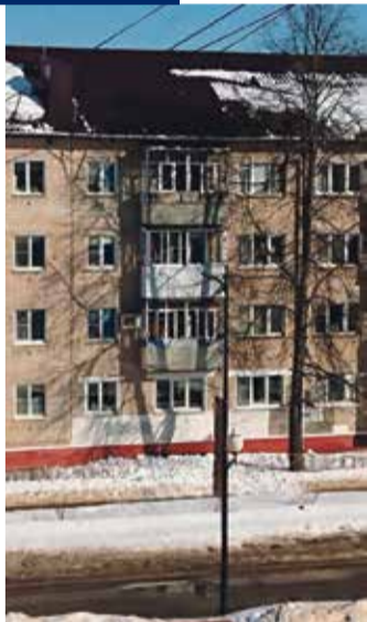
■ С крыши дома 3 по улице Жукова рухнула наледь-повреждено ограждение крыши (Обнинск)

Как рекомендуют юристы, в первую очередь необходимо незамедлительно, пока машина находится на месте, где получила повреждения, позвонить в ОМВД с целью приезда сотрудника, чтобы тот зафиксировал факт причинение имущественного вреда. Затем нужно связаться с управляющей компа-