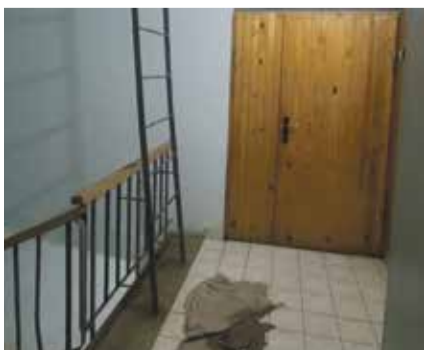
■ Пострадавший подъезд

Работа предстоит большая, но в АО «Быт-Сервис» к ней готовы. А жильцы данного дома сейчас размышляют над тем, как приблизить сроки капремонта своего дома.