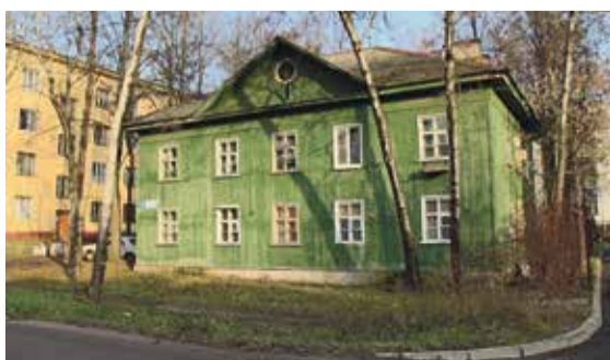
■ Это жилое строение на улице Парковой подлежит сносу

— Для того чтобы межведомственная комиссия признала дом аварийным, надо представить заключение специализированной организации, которая занимается экспериментальным обследованием многоквартирных домов. Это заключение дорогостоящее. И уже комиссия на основании выводов данной экспертной организации выносит Постановление о признании дома аварийным. Кто должен платить? Во всех случаях, когда в Обнинске дома признавались аварийными, жители не платили ни разу. Например, на Комсомольской сам застройщик этим занимался. В микрорайоне Мирный — управляющая компания.