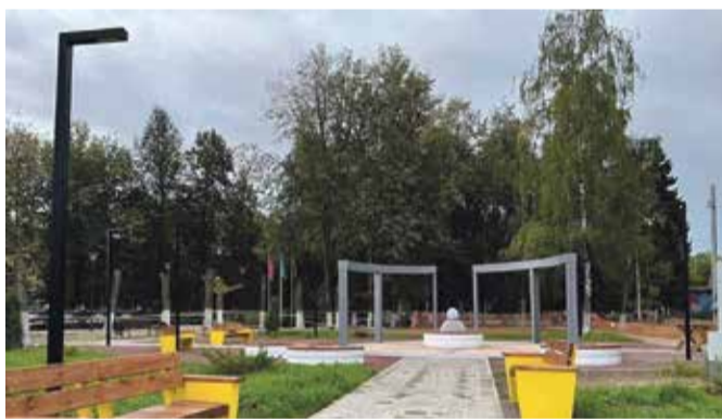
► Открытие фонтана стало последним крупным проектом в Ермолино

И вот, наконец, займутся оставшейся территорией, где располагается детская площадка. Работы будут проводить в рамках все той же «Комфортной среды», или, иначе говоря, с одобрения горожан, поддерживавших эту инициативу.