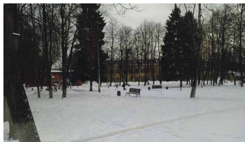
► Вот так выглядит участок, который обновят в 2024 году

Продолжат и обновление придомовых территорий, но уже силами мест-