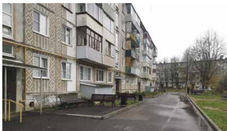
► Благоустройство дворов в городе идёт силами местного бюджета