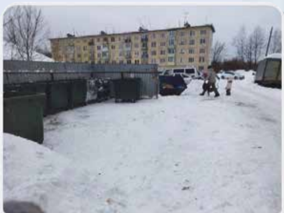
Здравствуйтесь. Площадку и подъезд к ней расчистили. Контейнеры установили внутри.

ни: площадку почистили, баки поставили куда надо!