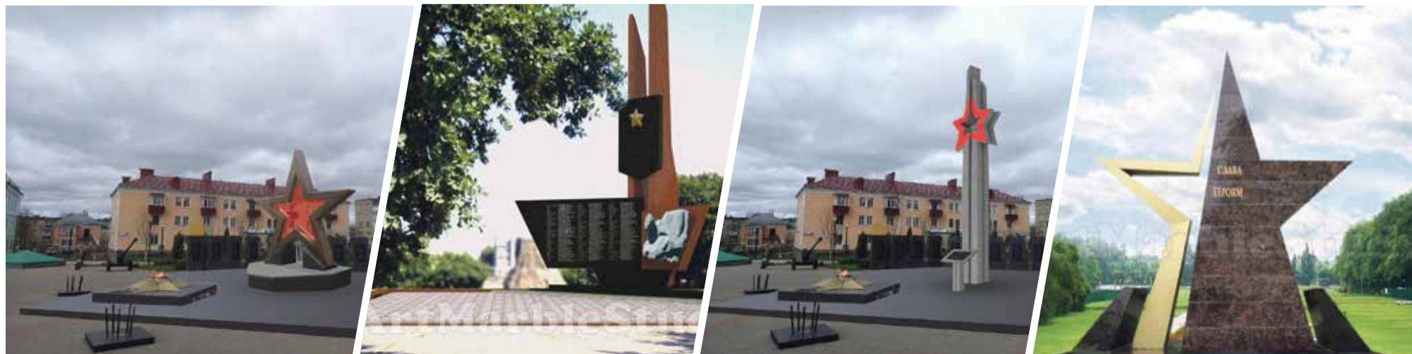
► Варианты эскизных проектов