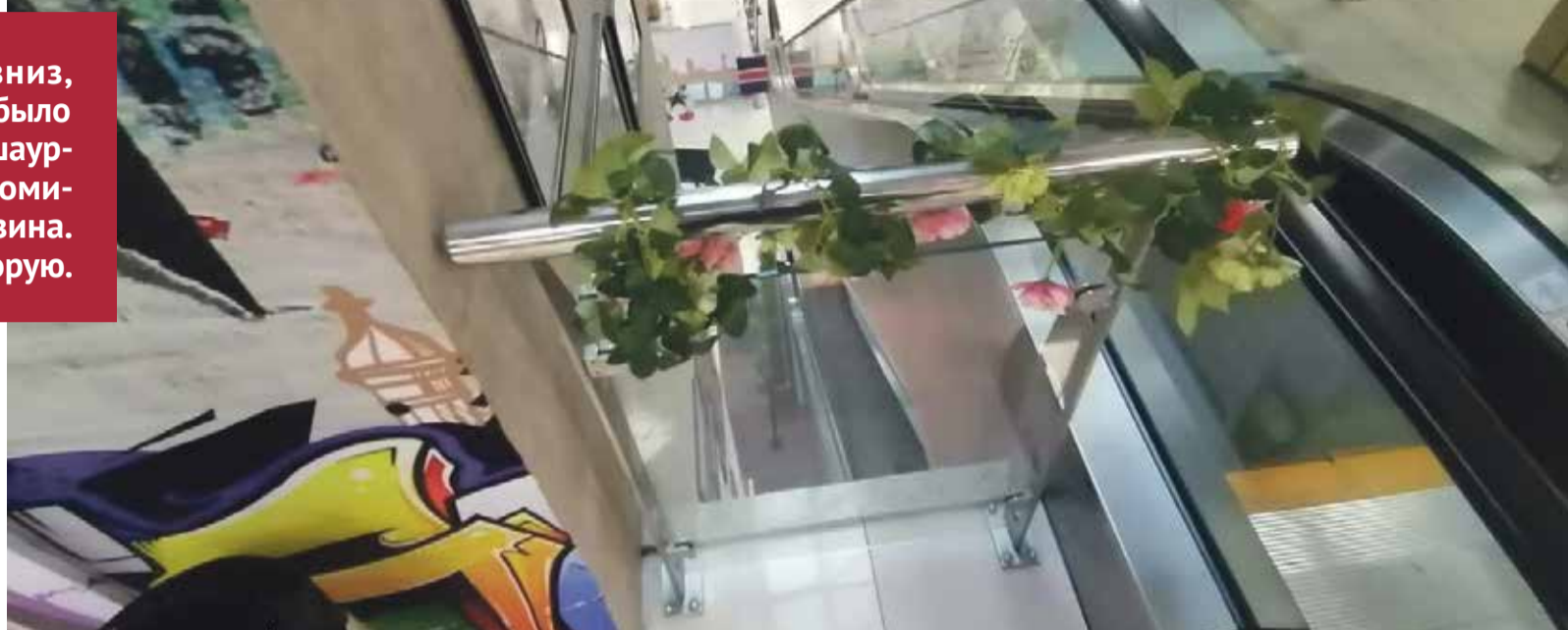
■ Оставшись один, ребёнок подошёл к эскалатору.

— По дороге мама ему купила шаурму, но в магазин одежды не разрешили зайти с едой. И мама брату сказала, чтобы он стоял около входа и доедал. Он съел шаурму, но не пошёл к маме, а отправился к эскалатору. У него зацепился рукав куртки, и он, к сожалению,