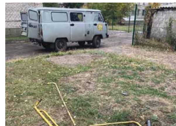
■ Обнинские коммунальщики уже на месте