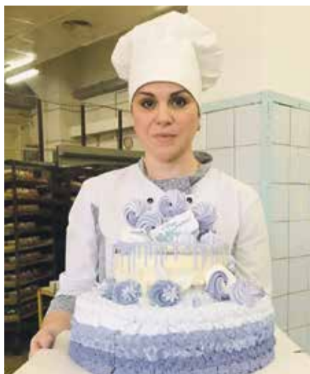
■ У кондитеров обнинского хлебокомбината золотые руки