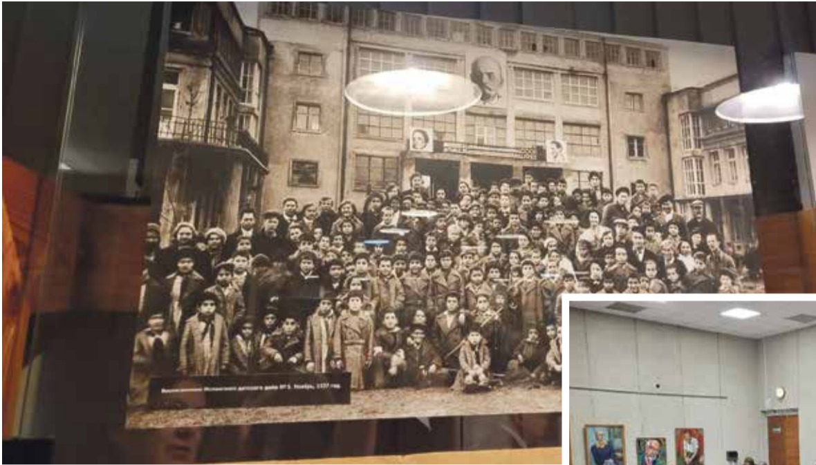
ВЫСТАВКА, ПОСВЯЩЕННАЯ СТАНИСЛАВУ ШАЦКОМУ

Участники конференции в Обнинске смогли познакомиться с выставкой, посвященной Станиславу Шацкому. 13 июня 2023 года исполнилось 145 лет со дня его рождения, и город подготовился к этой дате. Экспозиция Музея истории города Обнинска, посвященная педагогу и основанной им в 1911 году летней трудовой колонии «Бодрая жизнь», была дополнена экспонатами, хранящимися в фондах. В витринах представлены фотографии, отражающие жизнь колонии в 1911–1917 годах, прижизненные издания трудов С.Т.Шацкого.