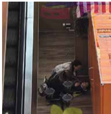
■ Сотрудница магазина на первом этаже вызвала скорую и поддерживала мальчика до приезда медиков.