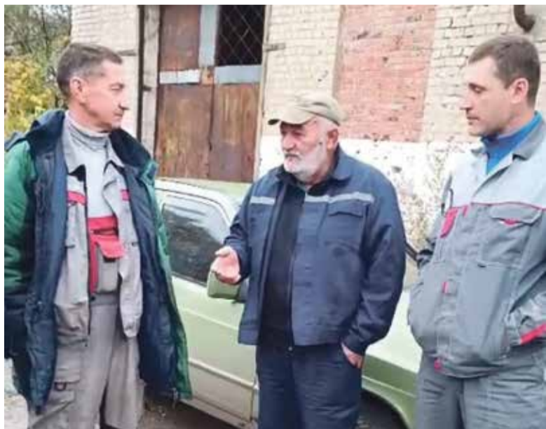
■ Работник ЖКХ поселка Горское благодарит коллег из Обнинска