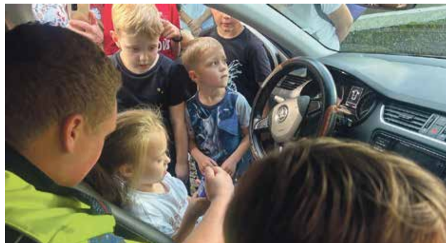
■ Обнинские инспекторы регулярно проводят занятия со школьниками и воспитанниками детских садов

— Нередко можно наблюдать, как родители переводят ребенка в неположенном месте или, не убедившись в безопасности, начинают переходить проезжую часть по пешеходному переходу, одновременно разговаривая по телефону. Родители должны помнить главное: ребенок может знать Правила дорожного движения, но поступать он будет так, как делают его мама и папа. Ведь ребенок во