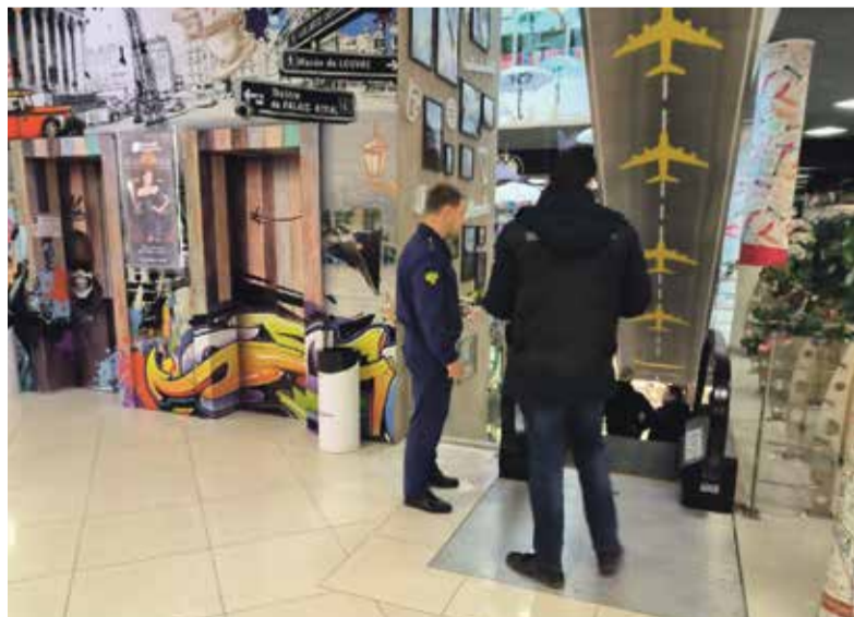
■ Возбуждено уголовное дело. Расследование находится на контроле прокуратуры.