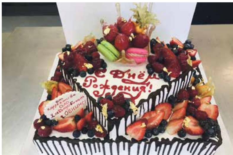
■ Один из тортов