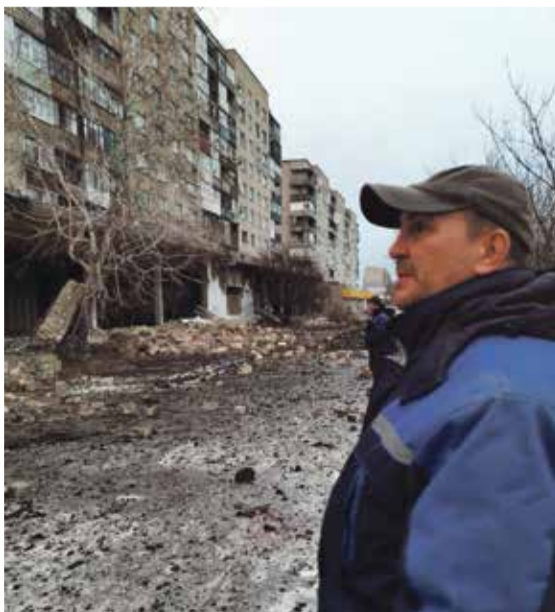
■ Грустная картина