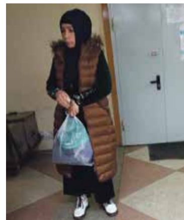
■ Женщина, с которой пришёл ребёнок в ТЦ, оказалась вовсе не мамой.

Полиции ещё предстоит дать оценку семейной неразберихе — почему мальчик кочует между родственниками. Но для всех сейчас, конечно, самое главное — состояние ребёнка.