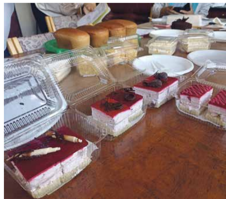
■ Пирожные с суфле