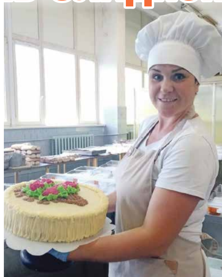
■ На обнинском хлебокомбинате выпекают такие шедевры