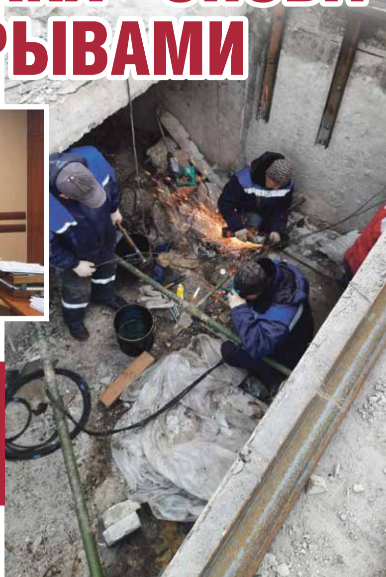
■ Бригада МП «УЖКХ» работает в Первомайске