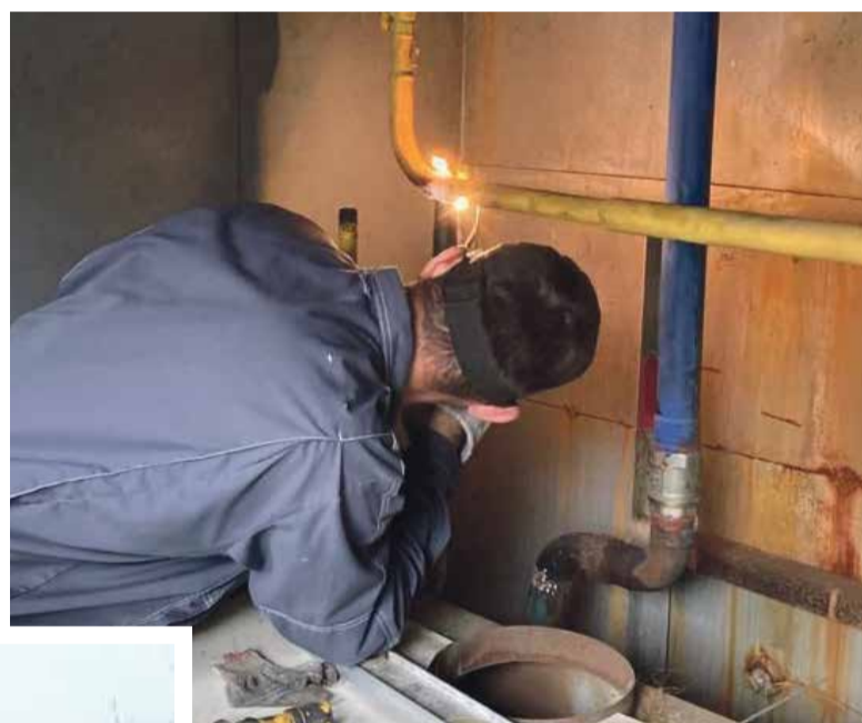
■ Аварийная бригада МП «УЖКХ» восстанавливает школьную котельную в ЛНР