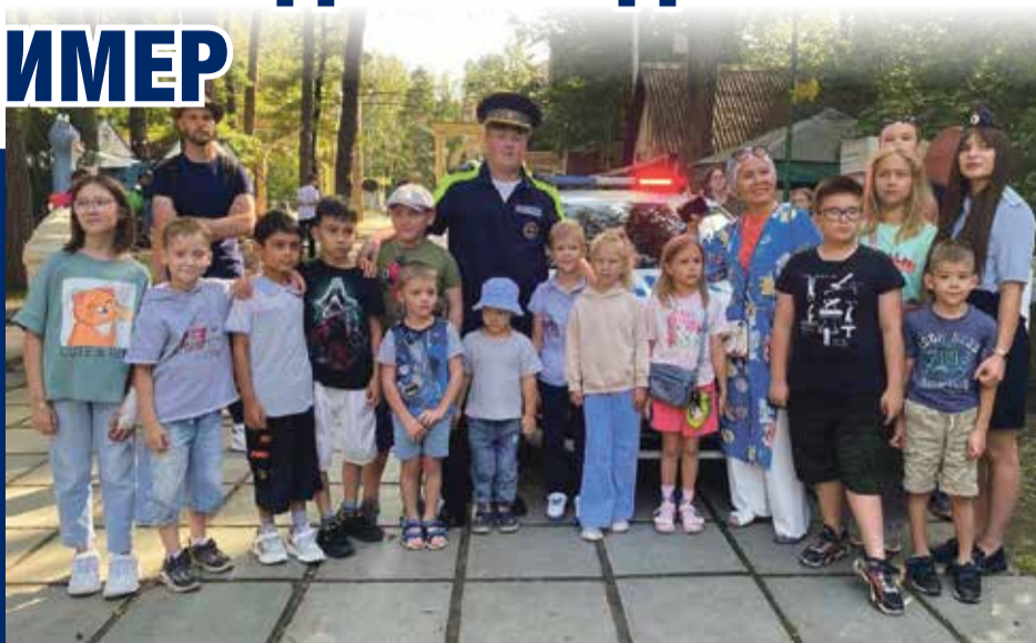
■ Мероприятие ГИБДД, организованное для детей в Городском парке