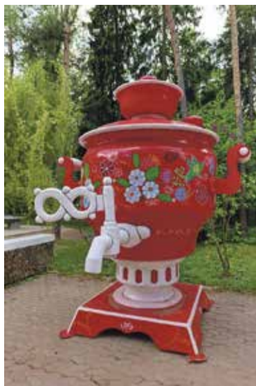
■ Возле этого самовара любят фотографироваться дети