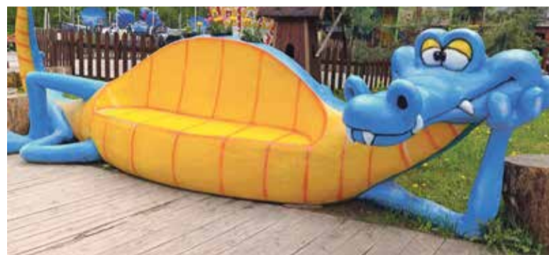
■ Ярко и оригинально

— Помимо выполнения текущих задач учреждение активно участвует в культурной, спортивной жизни города и профильных мероприятиях среди представителей парковой отрасли. Дважды МАУ «Городской парк» являлся номинантом Международного смотряконкурса «Хрустальное колесо» и оба раза становился победителем. Так, в 2017 году Городской парк был признан лучшим открытым парком развлечений с количеством посетителей до 100 тысяч человек в год. А в 2022 году победу парку принес проект «Лесная школа» в номинации «Оригинально-познавательный проект».