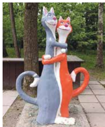
■ Такую милоту можно увидеть в Городском парке

— Да, всё остается в силе. А в этом году с 1 июня там будет открыто кафе и маленький магазинчик, уже установлен автономный мобильный общественный туалет — стоки из него не сливаются в реку, а откачиваются и вывозятся. Так что, Протва не загрязняется. Территорию пляжа сейчас регулярно убирает клининговая компания, в этом году там уже проводился покос травы, и туда завезен свежий песок. Потихоньку эта территория осваивается, и общая картина радует глаз.