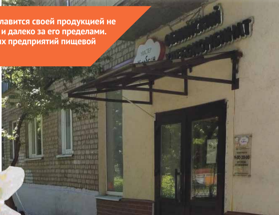
■ Магазин на улице Курчатова, 2