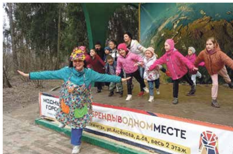
■ В Городском парке мероприятия проходят каждые выходные