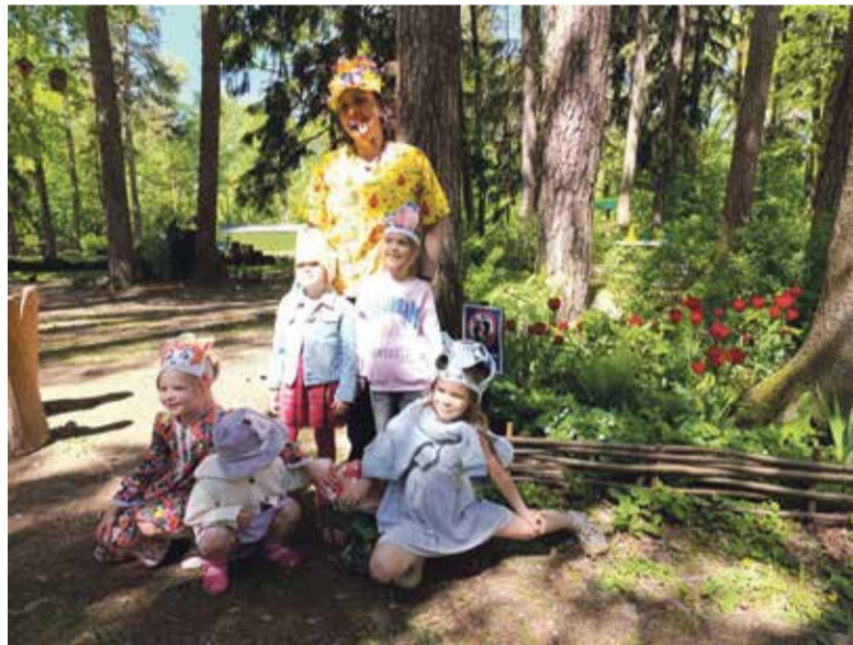
■ Детям очень нравится в Городском парке

Например, возле ТРК «Триумф Плаза» проходят все основные городские мероприятия, такие как новогодняя городская елка. Там же расположена главная детская площадка города, где всегда бывает много детей. Празднование Дня Победы всегда проходит с торже-