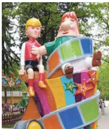
■ Обнинские малыши очень любят эту скульптуру в Городском парке

— В Городском парке концерты проводятся каждую субботу, а в Белкино — реже. Там устроить такое мероприятие с организационной точки зрения сложнее. Ведь