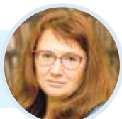
Автор: Рената БЕЛИЧ