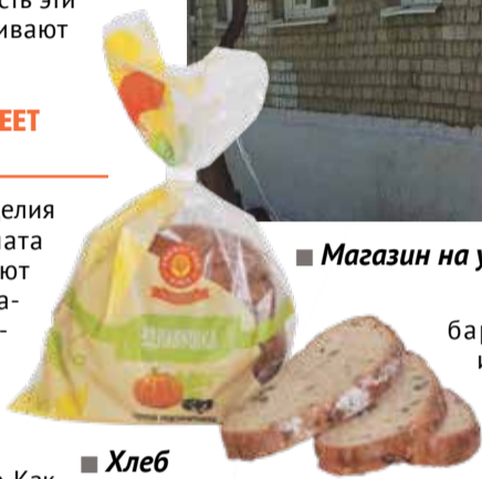
■ Хлеб «Здравушка»

баранки, кексы и так далее. Причём приобрести многие виды продукции можно в разной расфасовке. Идея упаковки хлеба и других изделий небольшими объемами оказалась удачной, ведь мелкую расфасовку охотнее приобретают «на пробу». Многим удобнее купить несколько видов продукции понемногу, чем покупать что-то одно. И Обнинский хлебокомбинат идёт людям навстречу, предоставляя им такую возможность.