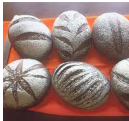
■ Обнинский хлеб изготавливают из качественных продуктов

Гурманы торговые точки нашего хлебокомбината любят посещать, ведь там можно выбрать не только многие виды хлеба, но и различные плюшки, слойки,