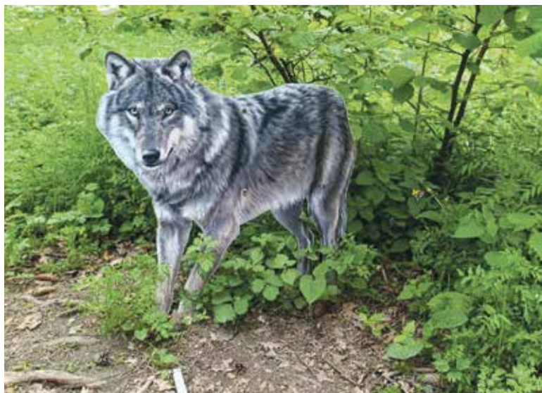
■ Еще один садово-парковый объект — одновременно страшно и красиво