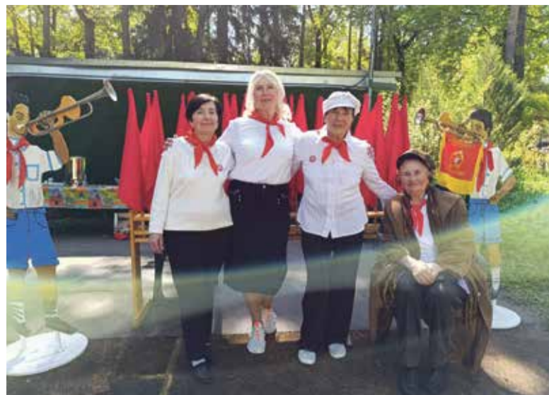
■ День Пионерии — это наша история