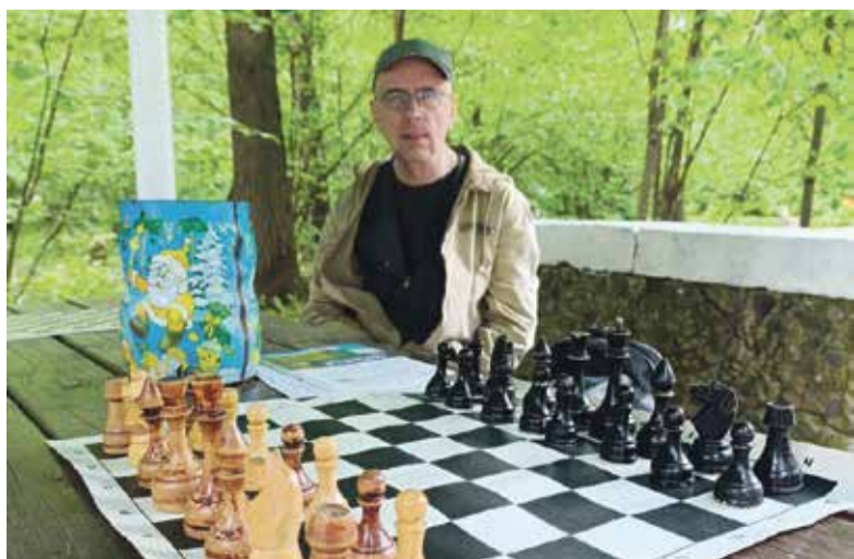
■ Кто-то любит танцы, а кто-то — шахматы

❓ — Какими достижениями Вашего учреждения можно гордиться?