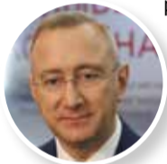
■ Владислав ШАПША

— От сегодняшнего (8 апреля) мероприятия мы ждем активизации торгово-экономических связей с зарубежными партнерами, выход на новые внешние рынки наших предприятий. И конечно, укрепления гуманитарных связей с дружественными странами.