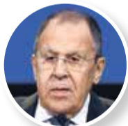
■ Сергей ЛАВРОВ

— Визитная карточка региона — его богатейшее научное наследие. Калужская область — колыбель мировой науки о космосе. В Калуге жил и работал великий русский ученый, отец современной космонавтики К. Э. Циолковский. Здесь трудились пионеры мирного освоения энергии атома. Под руководством академика И. В. Курчатова