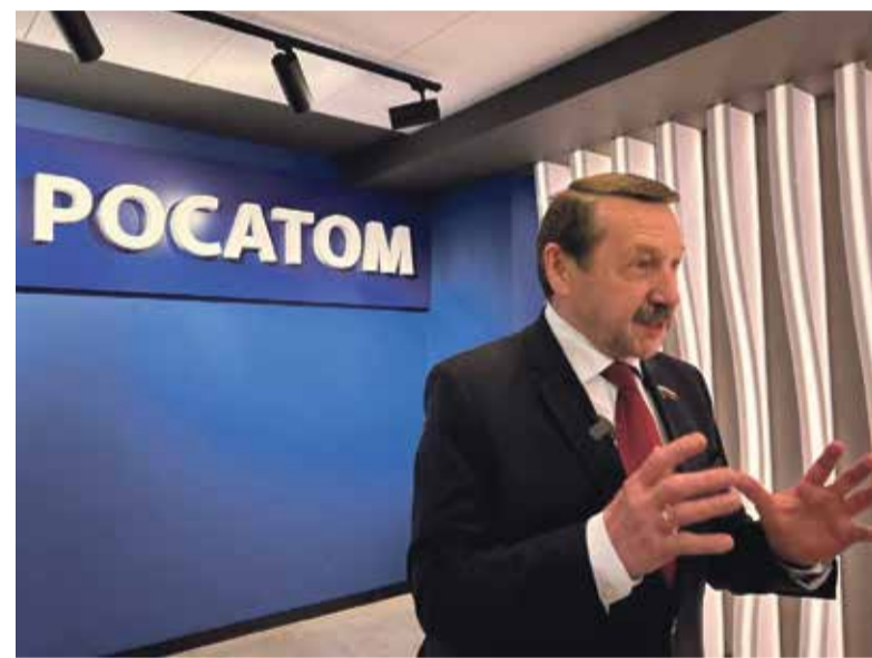
■ Депутат Государственной Думы РФ Геннадий СКЛЯР