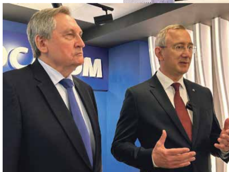
■ Депутат Госдумы Николай ШУЛЬГИНОВ и губернатор Калужской области Владислав ШАПША

– Это уникальный проект. Причем уникальный не только для России, но и для мира, потому что он будет обеспечивать кадрами все ядерные объекты Росатома в десятках стран. Мы растим национальную элиту в тех странах, где строим атомные станции. Кроме нас сегодня это никто не делает. Наш проект должен работать и для России. И уникальность проекта не только в том, что он международный, а в том, что здесь, в Обнинске, мы объединяем ресурсы. Это не просто кампус, это семейство