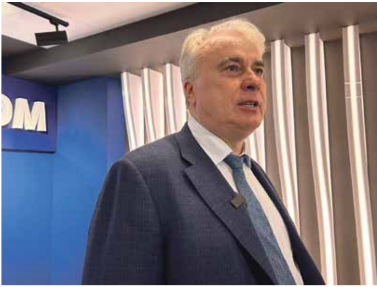
■ Депутат Государственной Думы Павел ЗАВАЛЬНЫЙ