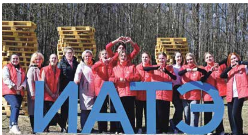
■ Жизнь студентов ИАТЭ насыщенная, яркая и интересная