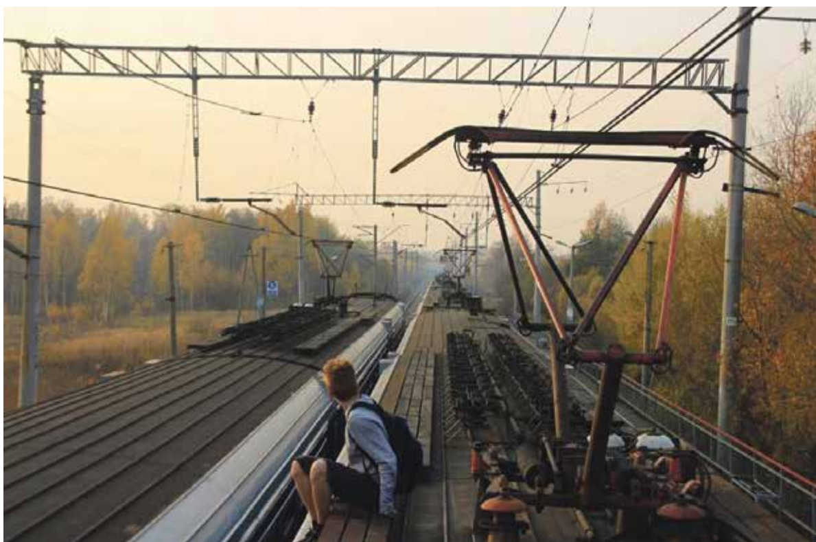
■ Многим подросткам не хватает адреналина