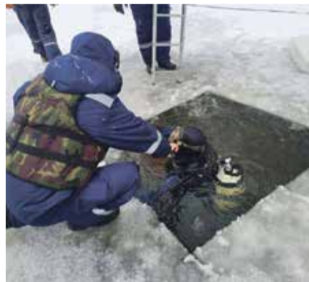
■ Утонувших в Брянске детей всё еще ищут

По информации спасателей, они обследовали 30 500 квадратных метров акватории водоема, пробурили 50 майн и 3050 лунок. Им помогают добровольцы отряда «ЛизаАлерт», на месте также работают следователи-криминалисты регионального следственного управления СК России. Трагедия всколыхнула и жителей Обнинска: они забеспокоились по поводу безопасности детей, которые