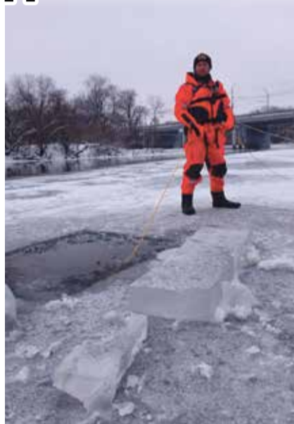
■ Катание на тюбинге закончилось трагедией

Он проделал половину пути и провалился в полынью. Выбрался из воды с помощью того самого матраса. Но это, подчеркиваем, спортсмен, за плечами которого годы ежедневных тренировок. Понятное дело, что на его месте обычный неподготовленный человек без по-