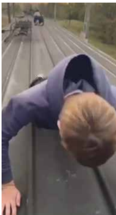
■ Такую бы энергию да в полезное русло