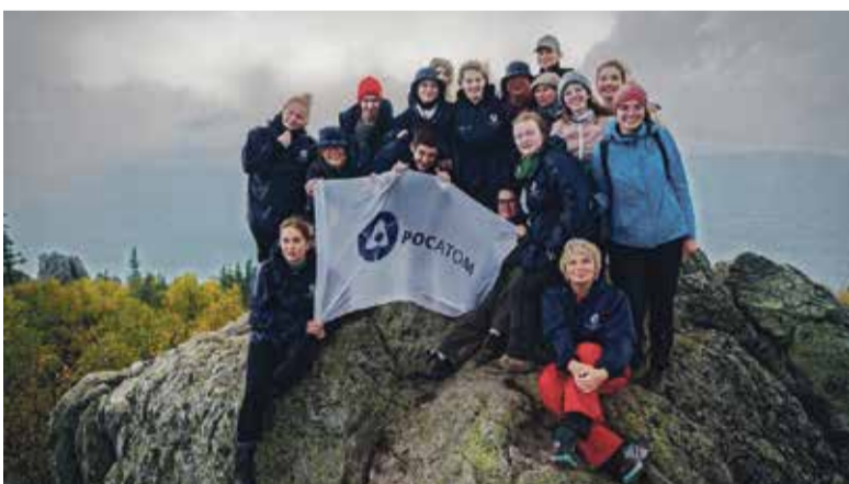
■ Команда единомышленников ИАТЭ НИЯУ МИФИ во время экспедиции

По результатам экспедиции собрана коллекция минералов с описанием их свойств, связанных со структурой атомов.