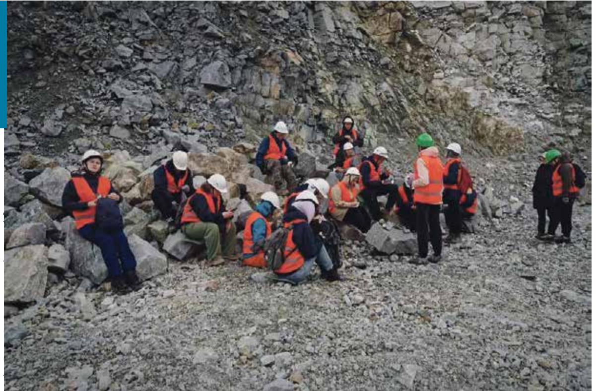
■ Участники экспедиции передали школьникам 35 образцов минералов