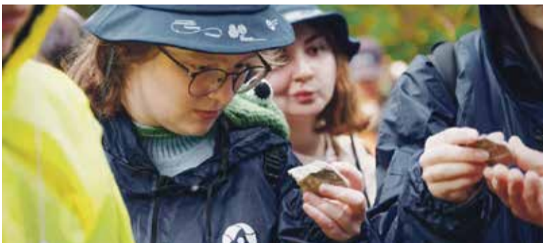
■ По результатам экспедиции собрана коллекция минералов с описанием их свойств

профессиональное образование, но и обучающийся по программам ВО и СПО.