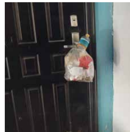
■ Мусор висит на двери хозяина, но запах ощущают и соседи