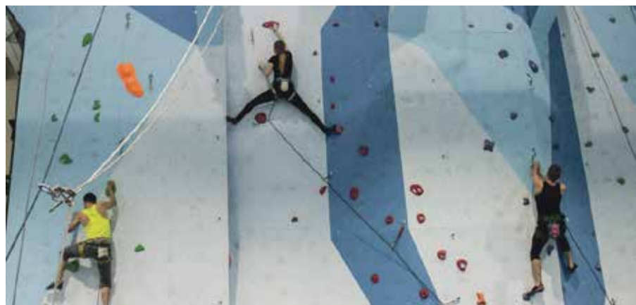
■ Такой скалодром мог бы понравиться зацеперам