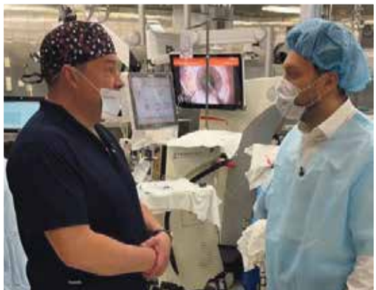
■ Самое сердце МНТК — операционная