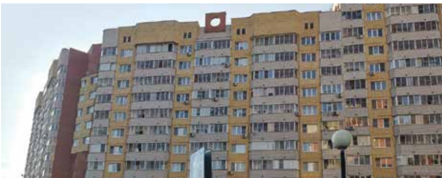
■ Обнинский МКД на проспекте Маркса

Конечно, дело не в количестве, а в качестве, но всё-таки и число имеет значение. Например, на балансе муниципальной «управляшки» МАУ «Коммунальное управление» в настоящее время находится 81 дом, а жалоб на работу этого предприятия относительно немного.