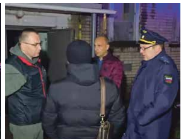
■ На место пожара прибыли руководители силовых структур и экстренных служб города