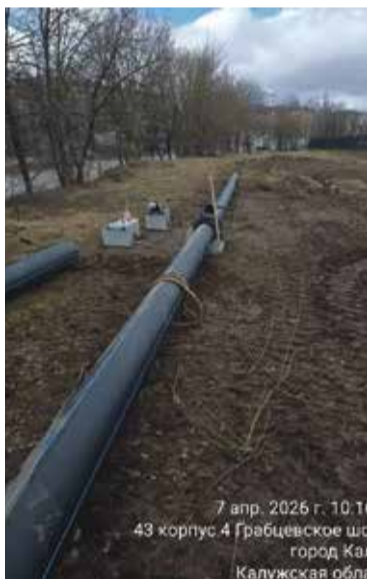
7 апр. 2026 г. 10:11 43 корпус 4 Грабцевское шоссе город Калужская обл.

Основная цель программы – повышение эксплуатационной надежности инженерных сетей, снижение уровня износа коммуникаций и обеспечение бесперебойного предоставления качественных коммунальных услуг населению и хозяйствующим субъектам региона.