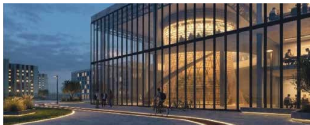
■ Красиво, удобно и комфортно