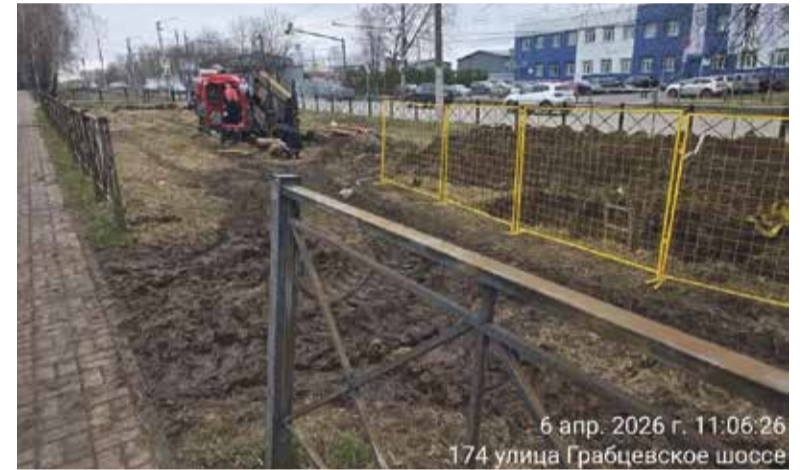
6 апр. 2026 г. 11:06:26 174 улица Грабцевское шоссе

По текущим данным, техническая готовность объекта составляет 36%. Завершение полного комплекса работ запланировано на лето 2026 года.