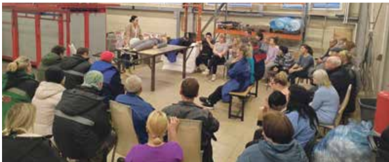
■ Выездное обучение

гистрируется в Реестре Минтруда, и оформить протокол задним числом уже не получится. Результаты спецоценки условий труда так же регистрируются во ФГИС СОУТ.