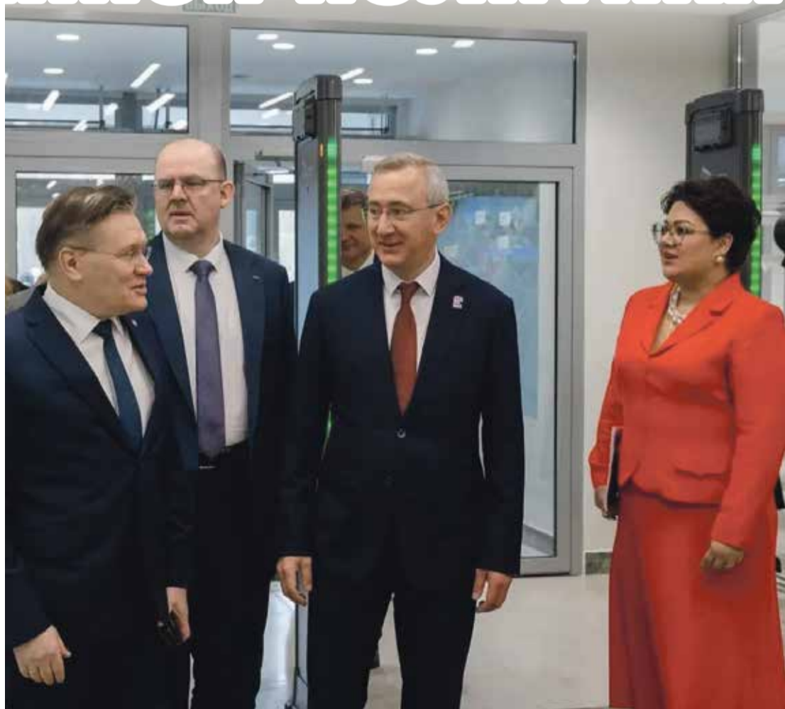
■ Во время торжественного открытия входной группы кампуса «Обнинск Тех»

Глава «Росатома» подчеркнул, что руководство страны заинтересовано проектом и необходимо оправдать это доверие. Важно, что «Обнинск Тех» — не для галочки, а важная часть государственной политики.