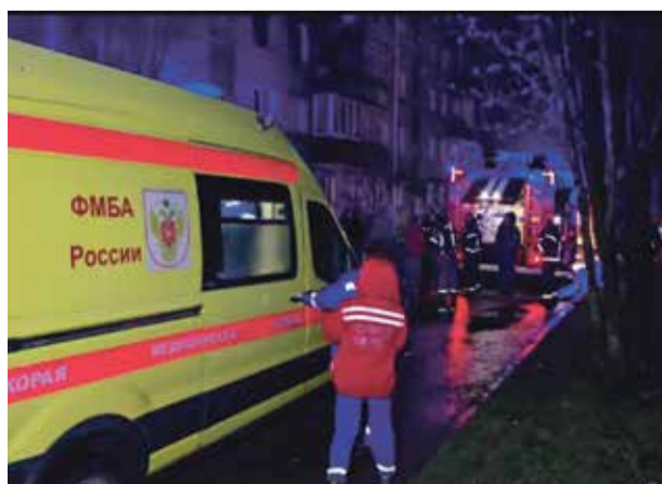
■ Медики скорой забрали в больницу пятерых, но выжили только двое