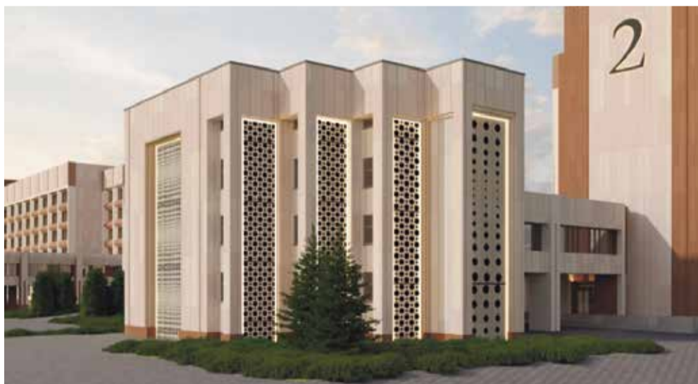
■ Всё необходимое для учёбы и жизни должно находиться в шаговой доступности