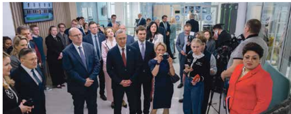
■ Высокие гости рассказывали о достижениях ИАТЭ НИЯУ МИФИ