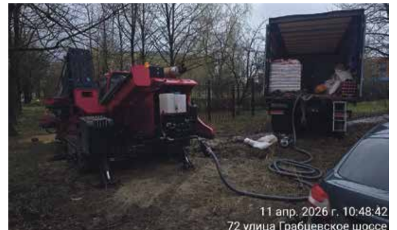
11 апр. 2026 г. 10:48:42 72 улица Грабцевское шоссе