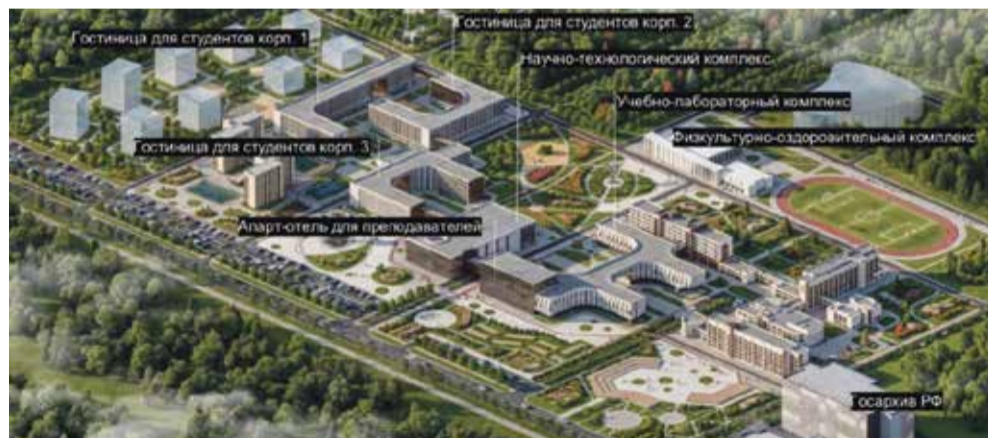
■ Проект кампуса ИАТЭ