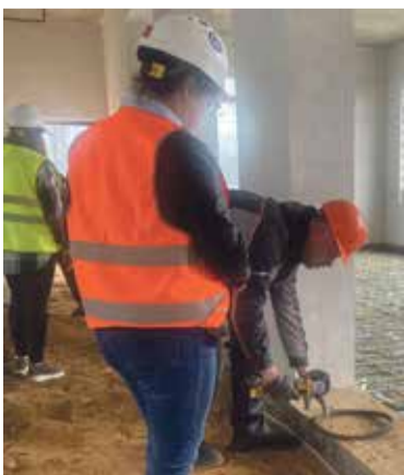
■ Почему с болгаркой и без очков!

– Работодатели несколько расслабились из-за отсутствия плановых проверок от Инспекции труда и от других проверяющих органов. Однако постепенно контроль возвращается в более жесткой форме. Например, обучение персонала ре-