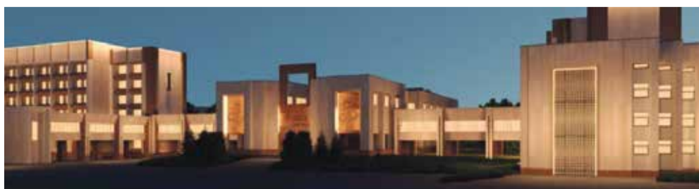
■ Сегодня вузам мало иметь высокий кадровый и научный потенциал, им необходимо еще и современное пространство