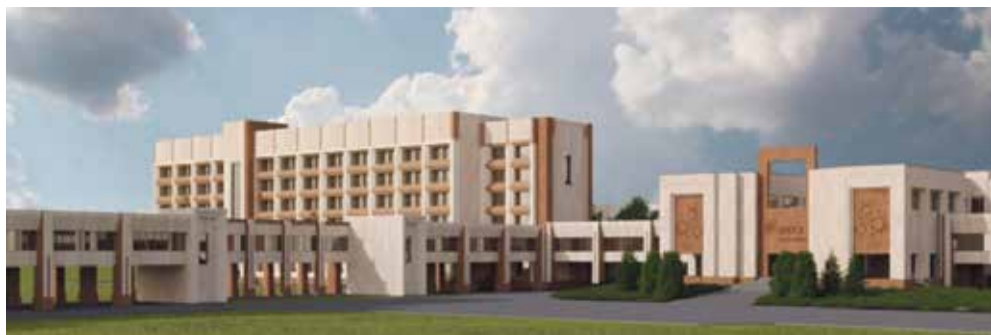
■ Удобный и современный кампус - это залог успешного развития вуза