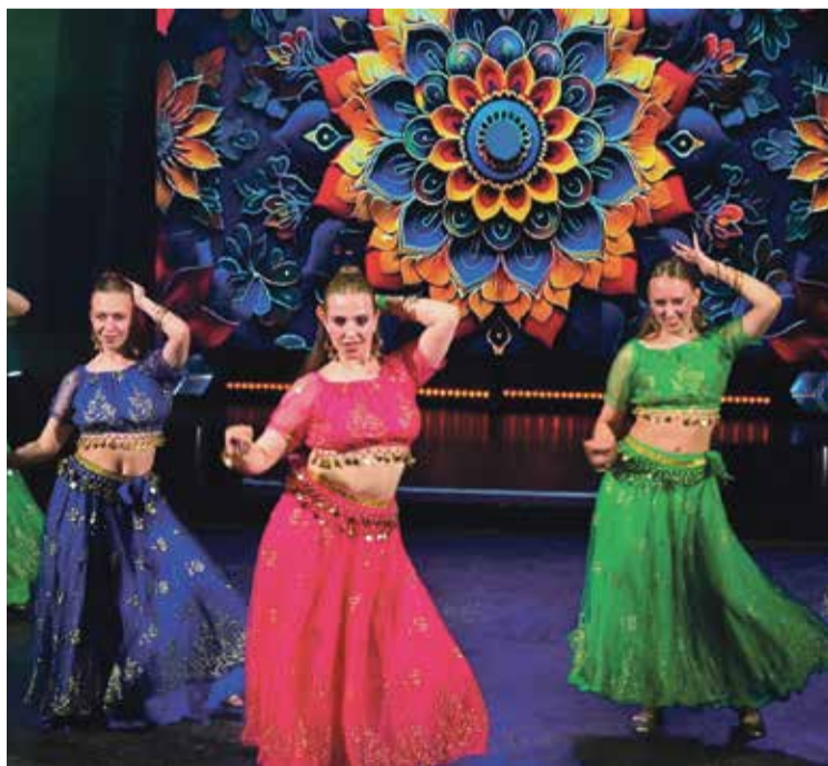
■ Яркие краски Студенческого фестиваля «СТУДФЕСТ-2026»