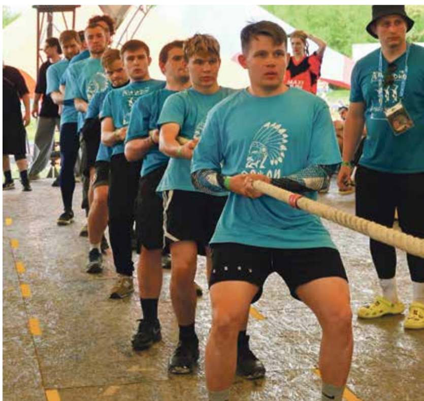
■ Команда ИАТЭ «Вожди Краснокожих»