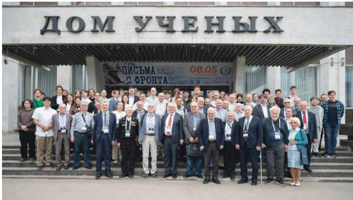
■ Участники конференции