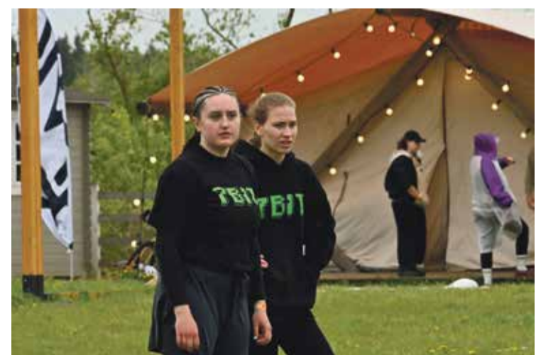
■ Во время фестиваля «СТУДФЕСТ-2026»