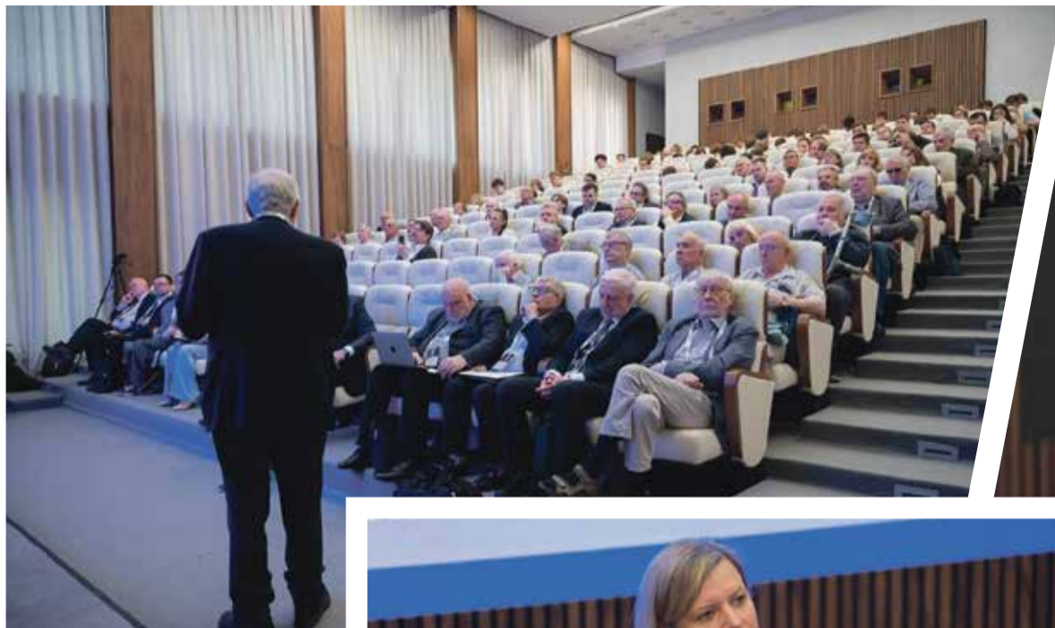
■ Участие в конференции приняли 150 учёных

В частности, учёные из Франции, участники из Замбии, Уганды, Таджикистана и других стран, что подчеркнуло международный статус и востребованность тематики конференции.