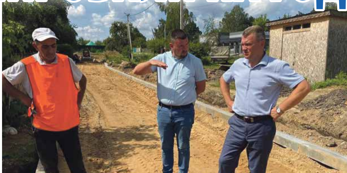
— Всё, что было запланировано, сделали, и год заканчиваем без долгов и финансовых просадок. Все социальные обязательства выполнены, точно.

— Важность строительства дороги через Вашутино наиболее остро ощущается на фоне грядущего расширения трассы М-3, что неминуемо увеличит трафик через Балабаново, и невозможности увеличить полноту на кабицынской дороге, которая уже собирает «пробки». Может ли новая дорога появиться раньше, чем до нас доберётся реконструкция «Киевки»?