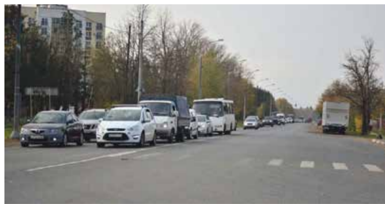
— Решение о начале в 2024 году реконструкции трассы М-3 в границах Боровского района уже принято на уровне правительства РФ, в 2026-м она должна завершиться. Поэтому у нас впереди два очень тяжелых года в плане транспортных проблем в Балабаново и на прилегающих подъездных путях.