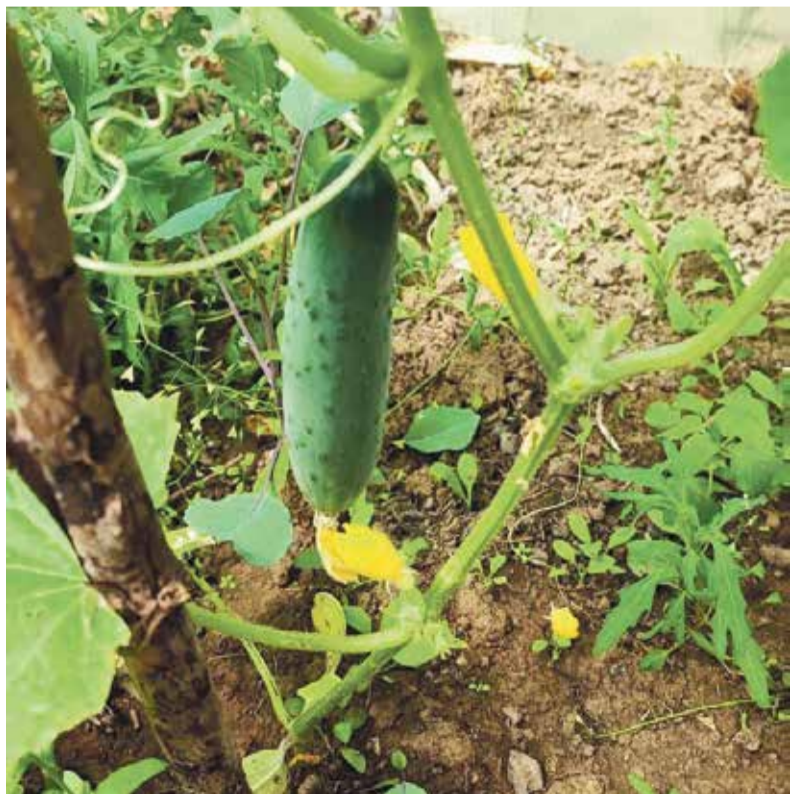
► — В детстве мы с отцом каждый выходной ездили в деревню, а там грядки, полив и прочие дела по хозяйству. Сейчас, конечно, времени на это остается мало. Но когда выйдешь летом в свой город, сорвешь с грядки лучок, укропчик или огурчик — удовольствие!