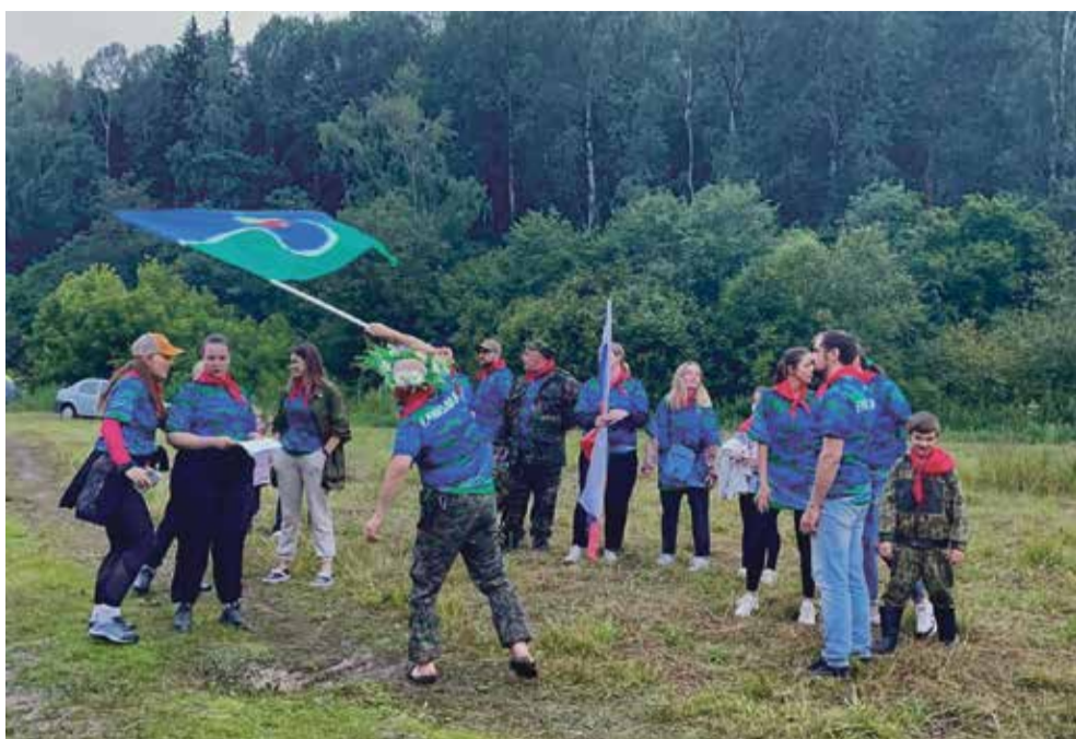
► — У нас есть намерение, в первую очередь в городах, создать центры для общения молодых людей, по принципу обнинского ОМЦ. Сейчас работаем над концепцией и готовы поддерживать любую инициативу.