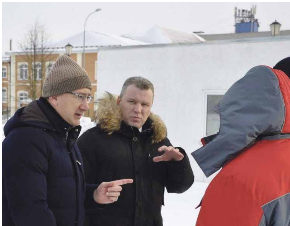
► — Мы долго мечтали о бассейне в Балабаново, благодаря решениям губернатора сейчас он построен и теперь им могут пользоваться все жители района.