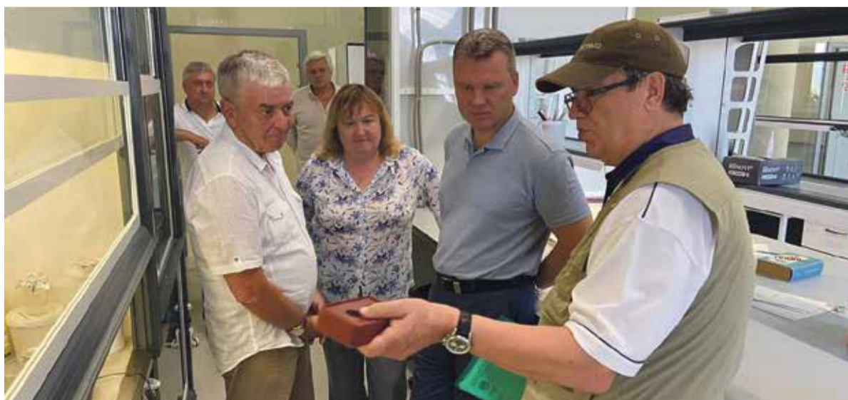
► — В Боровском районе не закрылось ни одно предприятие.

Если говорить про индивидуальных предпринимателей, то для них есть федеральная программа по поддержке самозанятых, по которой также можно получить от государства субсидию на оборудование и прочие расходы, предусмотренные условиями программы.