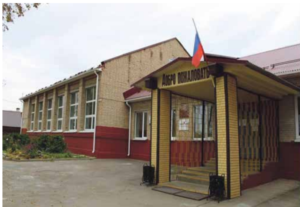
► — Задачи, которые мы ставим для себя по строительству школ — это Боровск, пристройка или отдельный корпус для балабановской «первой», кривской и ермолинской.

ную нагрузку не потянет. В подобной ситуации находимся не только мы, на сегодняшний день ни один муниципалитет не может позволить себе комплексный подход для обеспечения земельных участков многодетных водод.