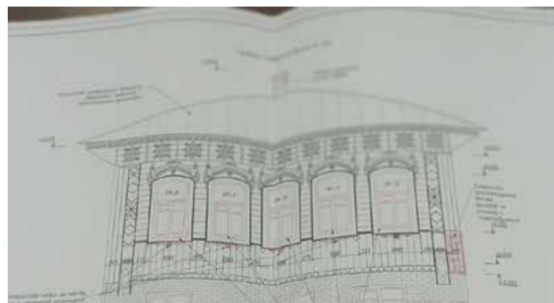
► — На мой взгляд, закон, охраняющий объекты культурного наследия, больше запретительный и где-то он требует упрощения и более лояльных подходов, чтобы инвесторам было привлекательно браться за такие проекты. Но в нынешних условиях других вариантов нет. Тем не менее, и на моем примере видно, что все вопросы решаемы.

— Нравится! Возможно потому, что в детстве мы с отцом каж-