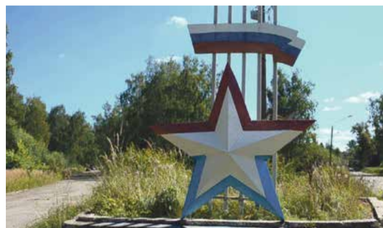
► — Один из участков, включенных в региональную программу на 2024 год, — дорога от А-108 до военного городка Митяево, ее капитально отремонтировали 23 года назад, с тех пор только ямочный ремонт был.