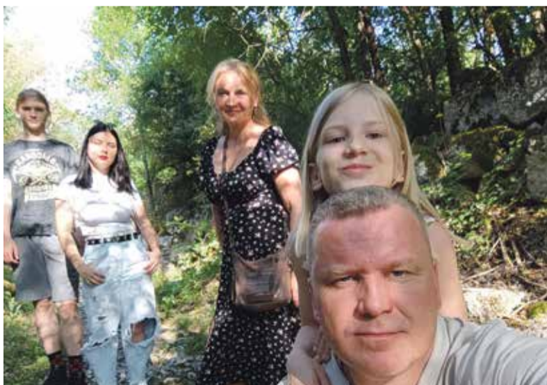
► — Счастье в разном: родители живы и здоровы — счастье, близкие здоровы и рядом — счастье, проект успешно реализовали вместе с коллегами — тоже счастье. Это какое-то сиюминутное ощущение, так что оно может быть в любом моменте.

? — Ваш опыт показывает, что с момента покупки ОКН до того времени, когда можно будет приводить его в порядок, проходит больше года. Думаете, это вдохновит потенциальных покупателей загораться идеей восстановления старых домов в Боровске?