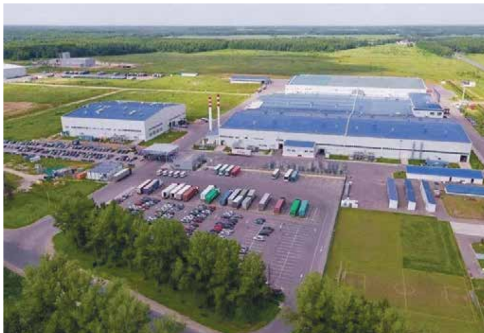
► — В индустриальном парке «Ворсино» территория занята на 90%, а в особой экономической зоне «Калуга» резерва нет — на каждый её участок на территории Боровского района заключено соглашение с будущими инвесторами. Они в разной степени проектирования и готовности выхода на этап строительства. В ближайшие годы вся территория будет застроена, а предприятия запущены.

— Думаю, да. Люди, которые приобретают объекты культурного наследия, делают это не для того, чтобы получить моментальный эффект или прибыль. Они понимают, что их ждет большая, тяжелая работа, но, если решаются на такой шаг, значит, морально готовы пройти непростой путь. На мой взгляд, закон, охраняющий ОКН, больше защищает и где-то он требует упрощения и более лояльных подходов, чтобы инвесторам было привлекательно браться за такие проекты. Но в нынешних условиях других вариантов нет. Тем не менее, и на моем примере видно, что все вопросы решаемы. У нас таких примеров много: здание Дома детского творчества, Дом Наполеона, Музейно-выставочный центр — всё реально сделать.