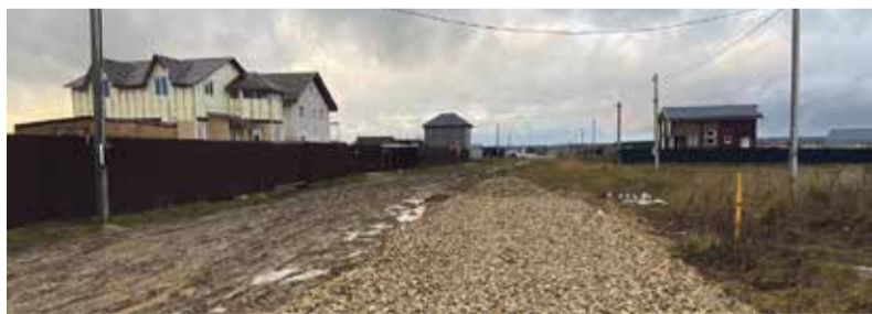
— В 2025-м по программе Газпрома должна быть реконструирована ГРС «Боровск», что практически в два раза позволит увеличить лимит по подаче ресурса. И тогда появится возможность, в том числе, и к участкам многодетных семей подвести газ.

— Про воду говорим, но пока, к сожалению, нет ни одной федеральной или областной программы, по которой можно было бы профинансировать такие работы. Если раскладывать стоимость водоснабжения и водоотведения, то на каждый участок потребуется порядка миллиона рублей. Есть у нас 300 участков — 300 миллионов нам надо найти, чтобы построить сети, станцию водоочистки, очистные сооружения и новую скважину, поскольку действующая сейчас такую дополнитель-