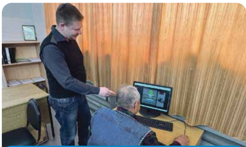
Вот так водители транспортного предприятия проходят экзамен на знание ПДД