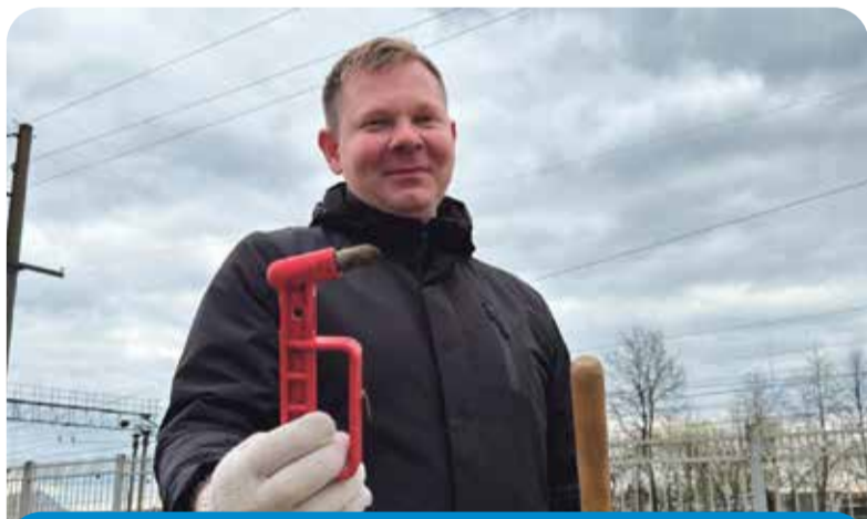
Молоток, украденный из какого-то автобуса, и позже выброшенный на Привокзальной площади