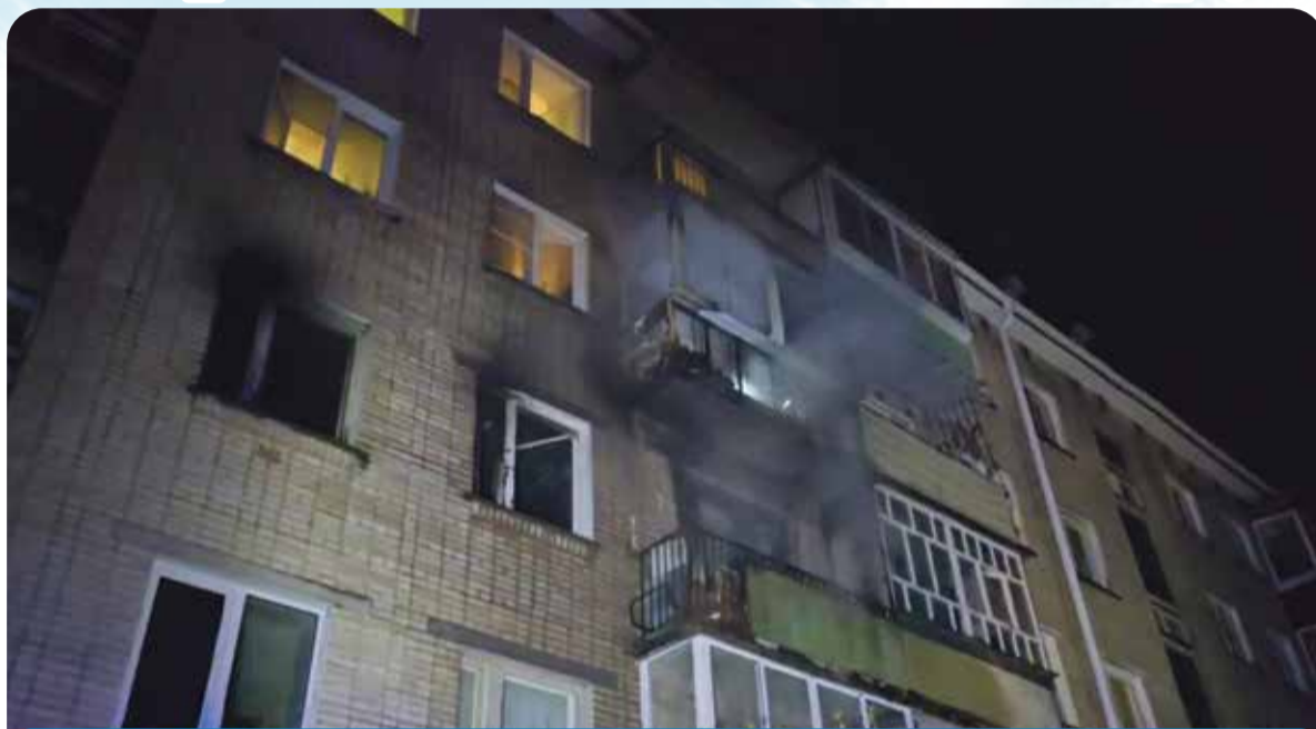
За этой дымовой завесой остались жизни трех людей. И одна сломанная судьба

Слишком быстро, чтобы жившая этажом выше семья успела осознать происходящее и спастись. Несколько минут хватило, чтобы три человека, еще вчера строившие планы на майские праздники, больше никогда не проснулись. Буквально одно мгновение и вот...ребенок остается без матери, отца и старшей сестры.