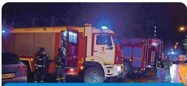
С пожаром огнеборцы справились оперативно. Хорошо, что не было больше жертв. Плохо, что жертвы вообще — были