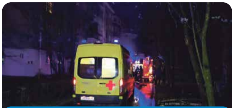
Медики приехали быстро. Они делали все возможное. Две жизни спасены. Три — потеряны