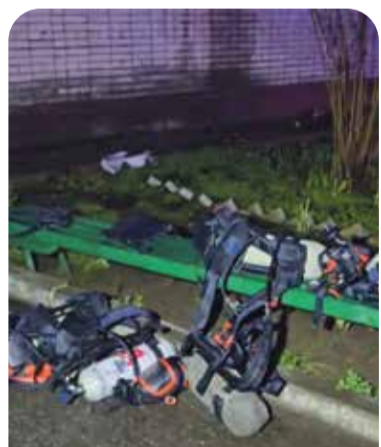
Одиннадцать человек, из которых двое — дети, эвакуировали в специальных масках

Женщина из квартиры, где начался пожар, тоже в больнице. Ожоги, отравление дымом. Соседи говорят: