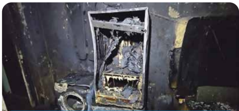
В квартире выгорело буквально все. То, что раньше было мебелью и бытовой техникой, превратилось в пепел