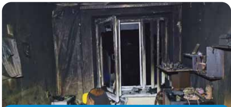
А вот так выглядит квартира на третьем этаже, где начался пожар

Жуткая трагедия потрясла город в начале этой недели. В ночь с понедельника на вторник в одной из квартир на улице Королева начался пожар. Глубокая ночь. Все люди спят. И тут дым начинает подниматься из квартиры третьего этажа наверх.