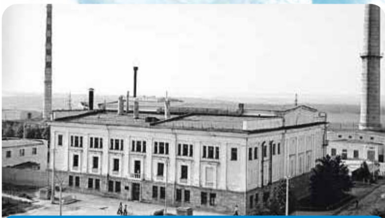
Архивное фото здания Первой в мире АЭС

Города обычно появляются на карте как населенные пункты. Обнинск появился как идея. В апреле 1946 года начала работать «Лаборатория В» — засекреченный объект, которому предстояло изменить ход мировой истории. В 1954 году Игорь Курчатов скажет «С легким паром!» при запуске первого в мире атомного реактора.