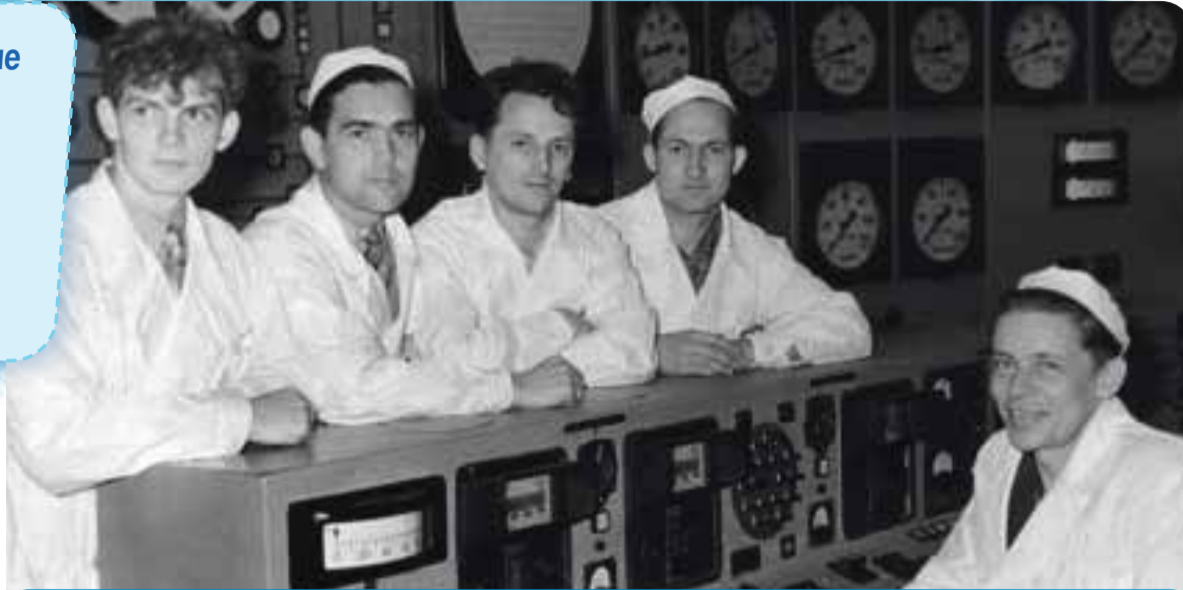
Те самые люди, кто запустил первый в мире реактор

Параллельно вокруг лабораторных корпусов рос целый город. «Лаборатория В» стала Физико-энергетическим институтом имени А. И. Лейпунского. И в этом году градообразующему предприятию 80 лет. Это не просто юбилей предприятия. Это день рождения самого наукограда, его интеллектуального двигателя и исторической памяти.