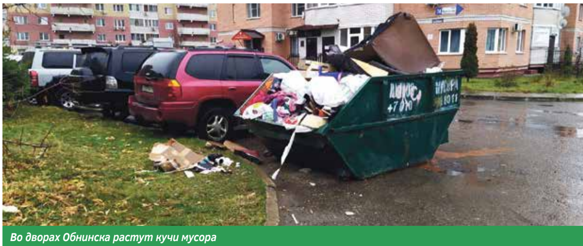
Во дворах Обнинска растут кучи мусора

Вот скажите, куда вы выносите старую мебель? Правильно, к подъезду! А все потому, что специальных контейнерных площадок, равно как и контейнеров для сбора крупногабаритного мусора в Обнинске отродясь не видели.