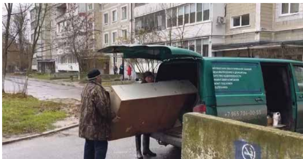
Управляющие компании, чтобы не получить штраф в 200 тысяч рублей, вынуждены сами вывозить крупногабаритный мусор. Хотя и не имеют права.

При этом перевозчик неоднократно заявлял, что крупногабарита становится все больше, а заложенная в тарифе оплата за его вывоз, составляет всего 10% от общей суммы. Короче говоря, «Экоют», по их уверениям, работал в минус — приходилось нанимать штат грузчиков, задействовать больше техники. Летом этого года перевозчик решил, что хватит это терпеть, и заявил администрации Обнинска о необходимости организовать специальные контейнерные площадки и эти самые контейнеры для вывоза КГМ. И попросил все организовать до конца октября.