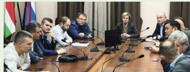
Власти в очередной раз встретились с УК. На этот раз в присутствии прокурора