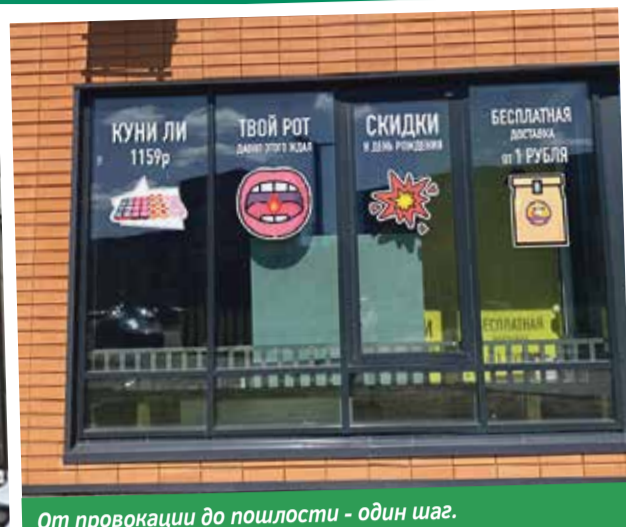
От провокации до пошлости - один шаг.