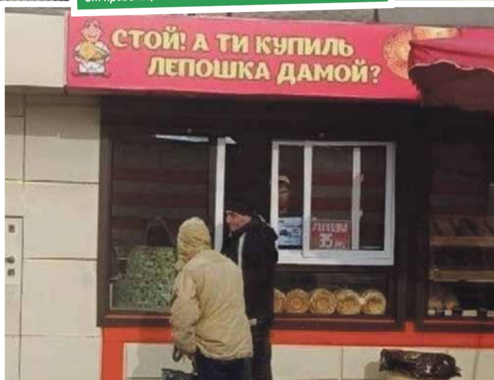
Та самая лепОшка раздора

Забавно? Да. Иронично? Вполне. Креативно? Весьма. Оскорбляет? Нет! Может, все-таки, разруха в головах? И уровень общего негатива и злости настолько высок, что нужен просто повод выплеснуть всю накопившуюся желчь? В любом случае хочется надеяться, что после жалоб, оскорблений и давления все эти люди стали хоть чуточку счастливее.