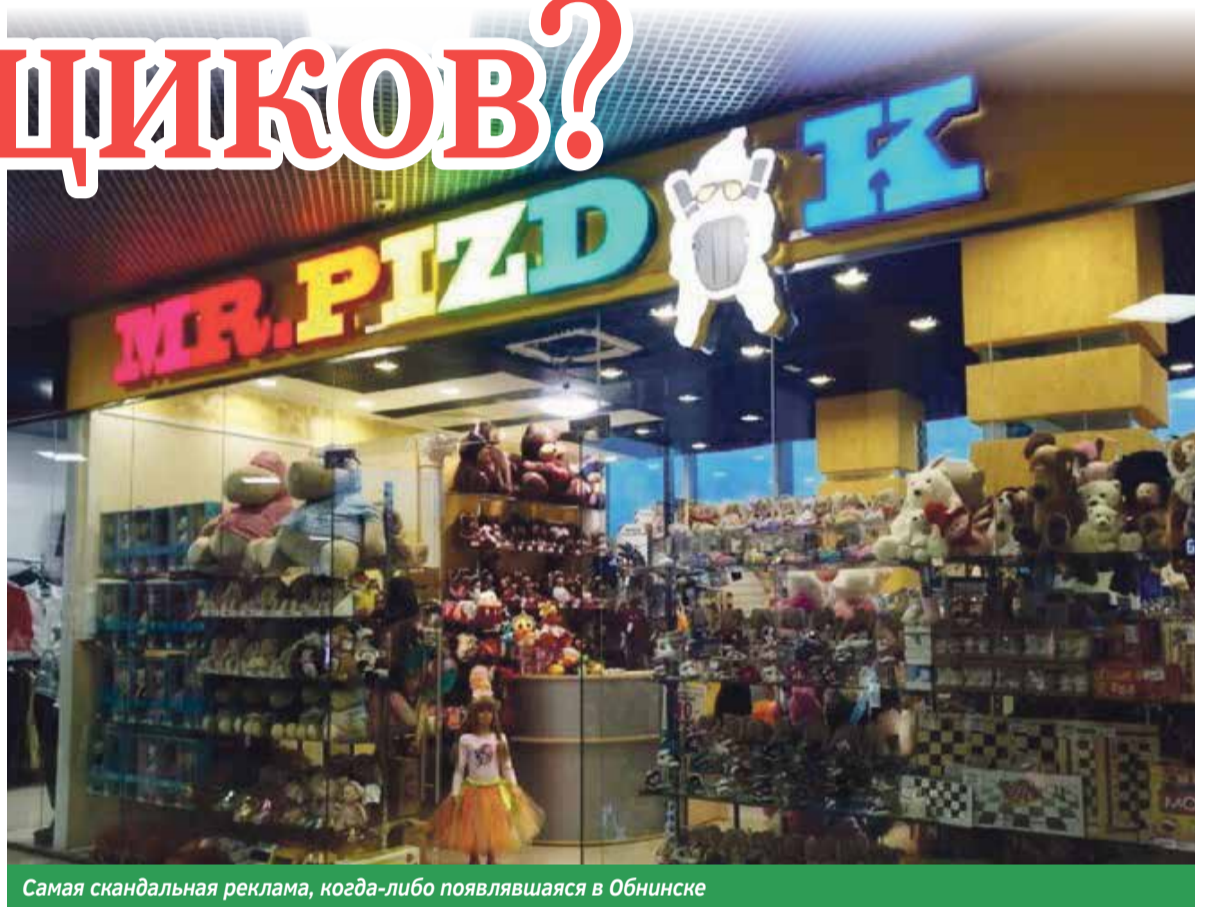
Самая скандальная реклама, когда-либо появлявшаяся в Обнинске

Сразу же нашлись согласные, которые стали обвинять владельца торговой точки чуть ли не во всех смертных грехах. Складывалось ощущение, что людям просто нужно на чем-то или на