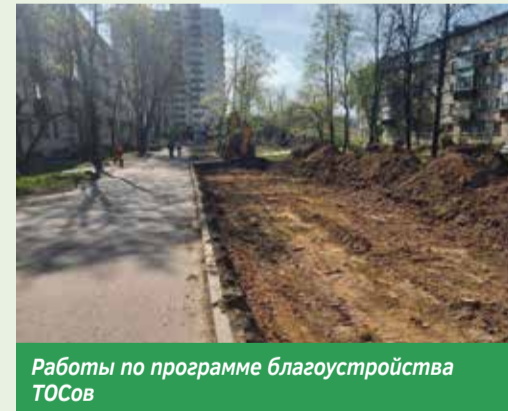
Работы по программе благоустройства ТОСов