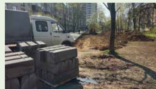
В Обнинске ежегодно благоустраиваются дворы по программе ТОС