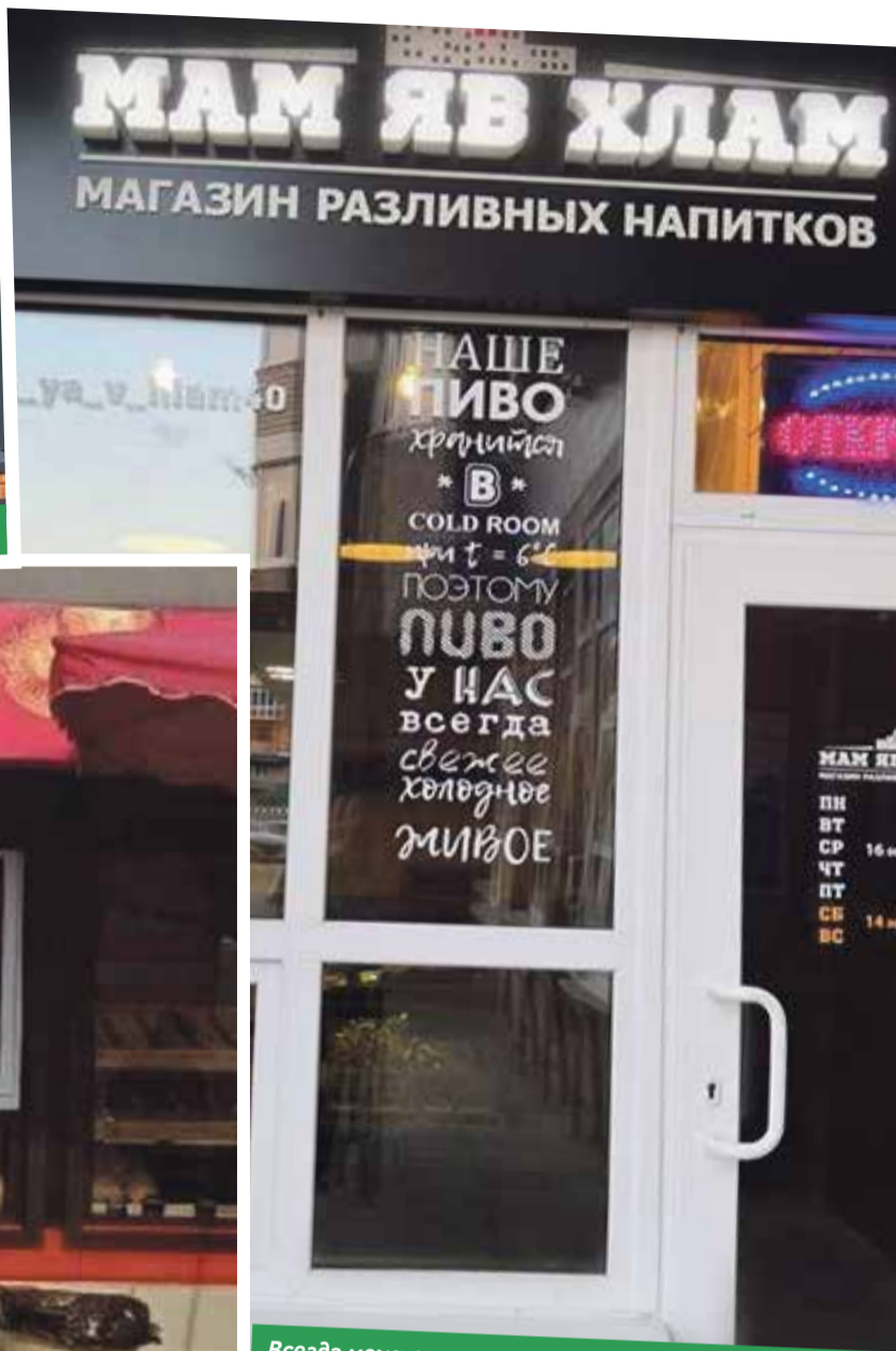
Всегда можно позвонить маме и рассказать не только, где ты, но еще и в каком состоянии.