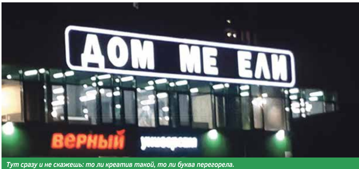
Тут сразу и не скажешь: то ли креатив такой, то ли буква перегорела.

Двойное ощущение возникает. Понятно, что все на свете — вопрос личного восприятия и отношения, но, например, ни я, ни мои коллеги, ни еще сотни людей не увидели в этих вывесках ничего предосудительного.