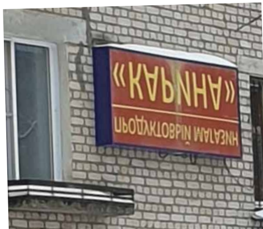
Что хотел сказать автор? Это ошибка или новое искусство рекламной вывески «вверх ногами»?