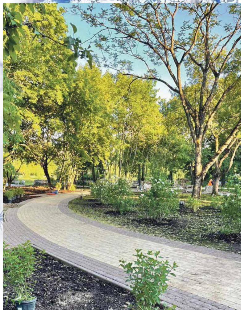
Благоустройство сквера возле кинотеатра «Мир».

➔ В Обнинске прошел первый городской выпускной. 43 выпускника награждены золотой медалью за особые успехи в учебе. 9 выпускников набрали максимальные 100 баллов при сдаче Единого Государственного экзамена.