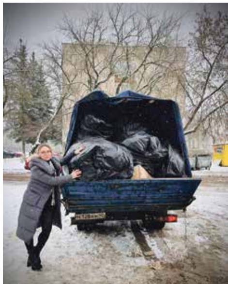
Экоцентр в Обнинске с первых дней работы стал невероятно востребованным.

➔ Безусловно, модернизация общественного транспорта — одно из главных и самых обсуждаемых событий 2022-го