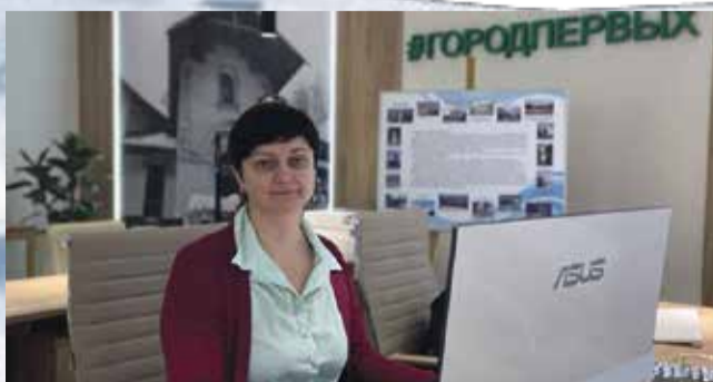
В Обнинске планируют развивать туризм. В марте открылся филиал ТИЦ «Калужский край».