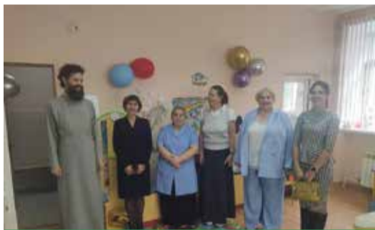
В детском саду открыли первую православную группу.

➔ Наконец-то в Обнинске открылся Экоцентр. Он пока первый и единственный, который существует в регионе на базе муниципалитета. Экоцентр