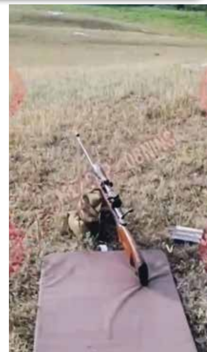
Вышел на охоту?