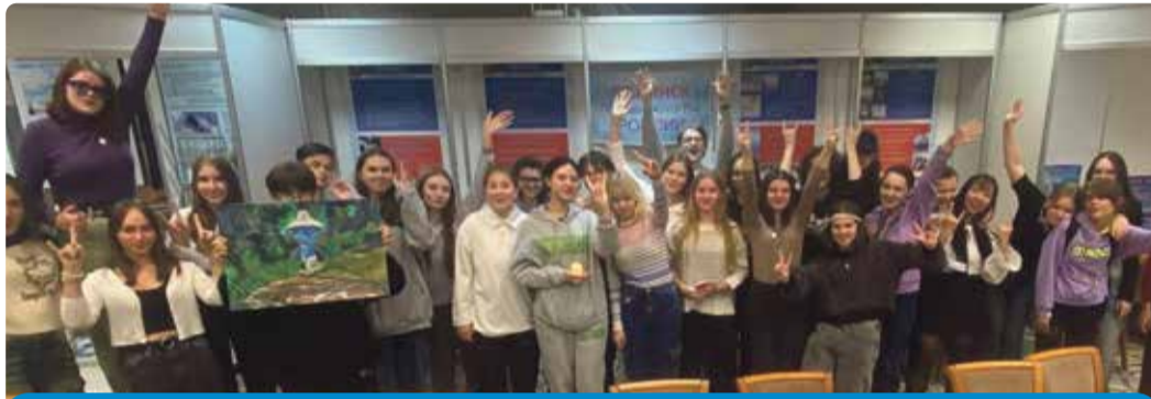
Студенты колледжа - как одна большая дружная семья

Свою активную вовлеченность в творческий процесс продемонстрировали студенты второго курса, представив проект «Боровск: резное кружево домов. Перезагрузка», суть которого — украсить жилые дома резными наличниками, отражающими исторический дух древнего города. Всего в проекте участвуют десять образцов. В жизнь уже воплотили первые наличники под авторством студентов колледжа. Все участники были награждены ценными подарками.