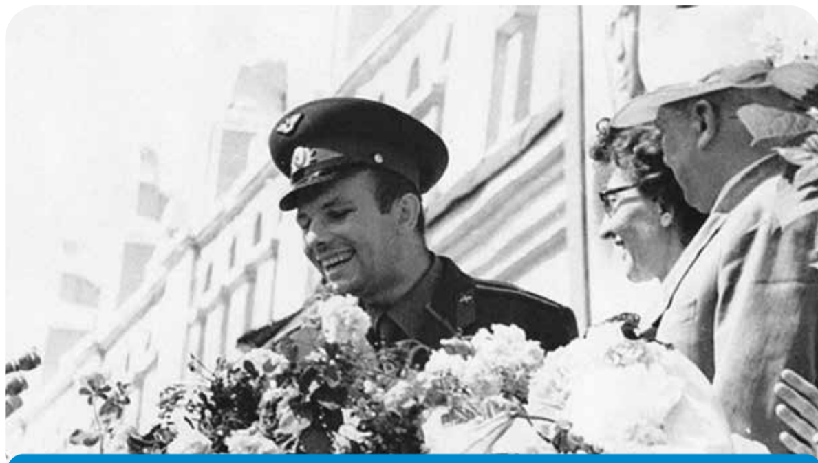
В Обнинске Юрия Гагарина просто завалили цветами

Но даже если и так, это совершенно не повод забывать свое прошлое. Стирать из памяти человека, который первым покорил космос. Который хотел быть первым и стал им. Человека, для которого мечта стала