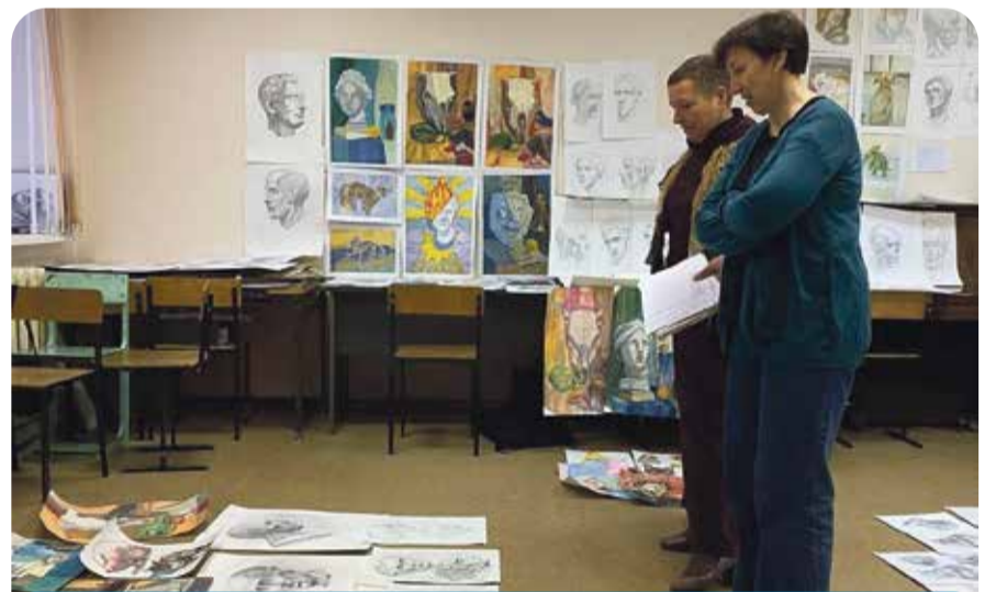
Преподаватели зорко следят за прогрессом и успехами своих студентов