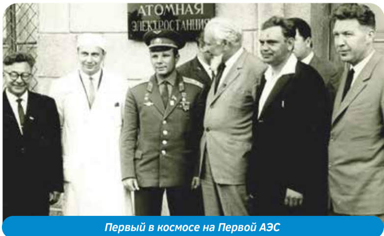
Первый в космосе на Первой АЭС