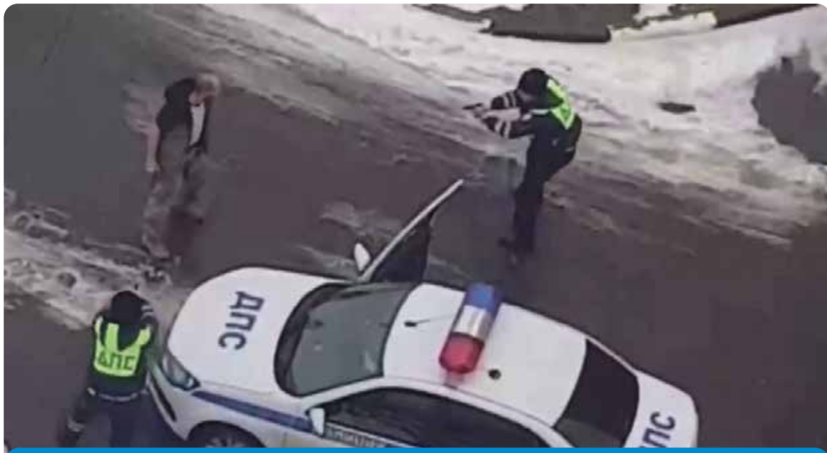
Два сотрудника ДПС целились в мужчину, стреляли в воздух, но его было не остановить!