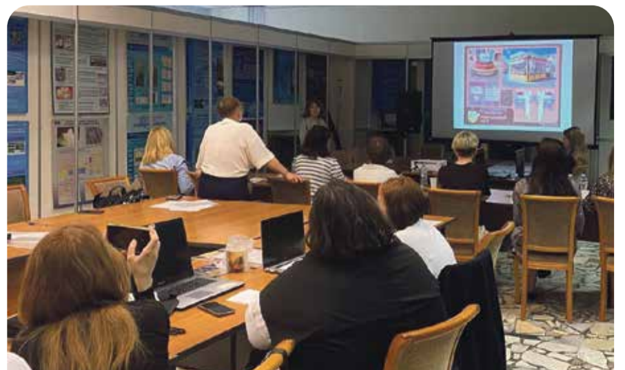
Будущие дизайнеры знакомятся с различными интересными концептами