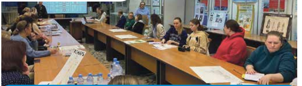
В процессе обучения ребята не только учатся новому, но и активно обсуждают работы друг друга, подмечают тонкости, учатся коммуницировать и конструктивно критиковать

Стоит отметить, что все педагоги являются действующими деятелями культуры: руководители, участники хоров, исполнители, дирижеры, члены творческих союзов, практикующие дизайнеры, художники. Большинство из них имеют первую и высшую категорию.