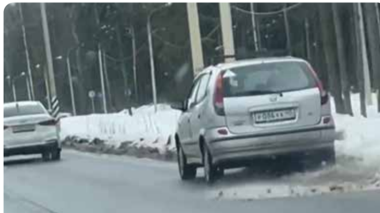
Вот он, показывает мастерство зигзагообразного вождения

Что это было и что случилось с человеком, предстоит разобраться следствию.