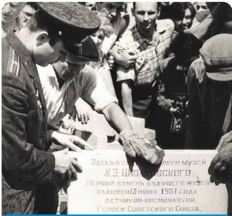
В Калуге на закладке камня будущего Музея космонавтики

Этому уроку Юрий Гагарин может научить каждого.