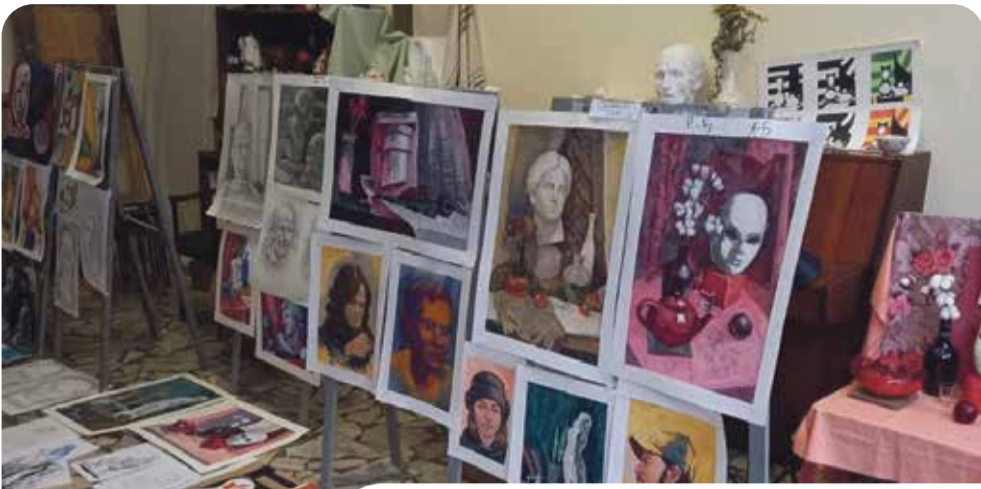
Художники ежедневно оттачивают свое мастерство под руководством опытных педагогов