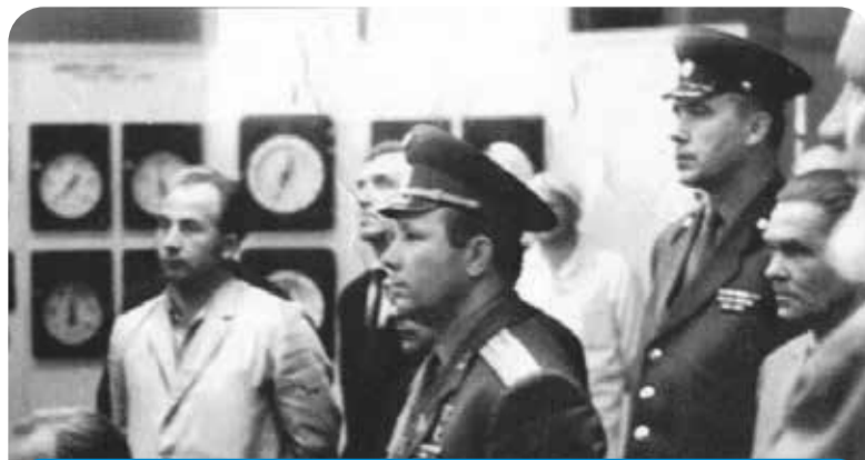
Экскурсия на АЭС Гагарина поразила. Он восхищался умами наших ученых!