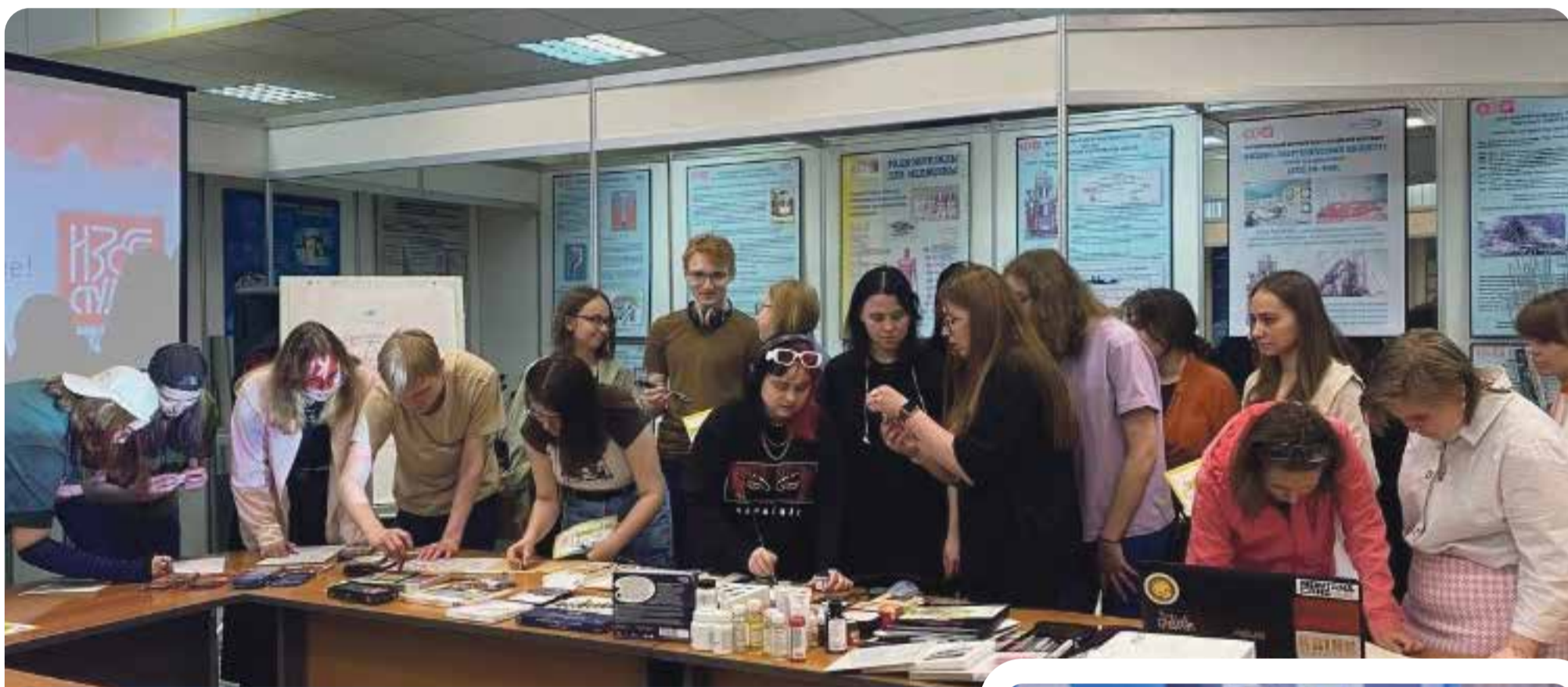
В «Обнинском колледже искусств» всегда кипит жизнь

С 1995 года в городе Первых, в одном из самых красивых уголков по Горького, 4 работает «Обнинский колледж искусств», который обучает студентов по двум направлениям: «Музыка» и «Дизайн». Большую поддержку ему оказывает автономная некоммерческая организация «Агентство городского развития — Обнинский бизнес инкубатор» (АНО «АГРО»). Подробнее — в нашем материале.