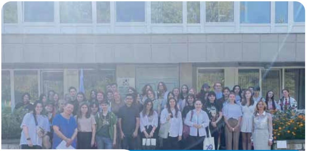
Студенты «Обнинского колледжа искусств» - постоянные участники различных культурных мероприятий. Их жизнь полна не только интересной теорией, но и богата практикой!

Недавних выходных состоялось очередное такое мероприятие. На встрече обсудили особенности обучения в колледже, учебное расписание, прохождение практик. Внимание уделено и подготовительным курсам, которые помогут подготовиться абитуриентам к успешной сдаче вступительных испытаний.