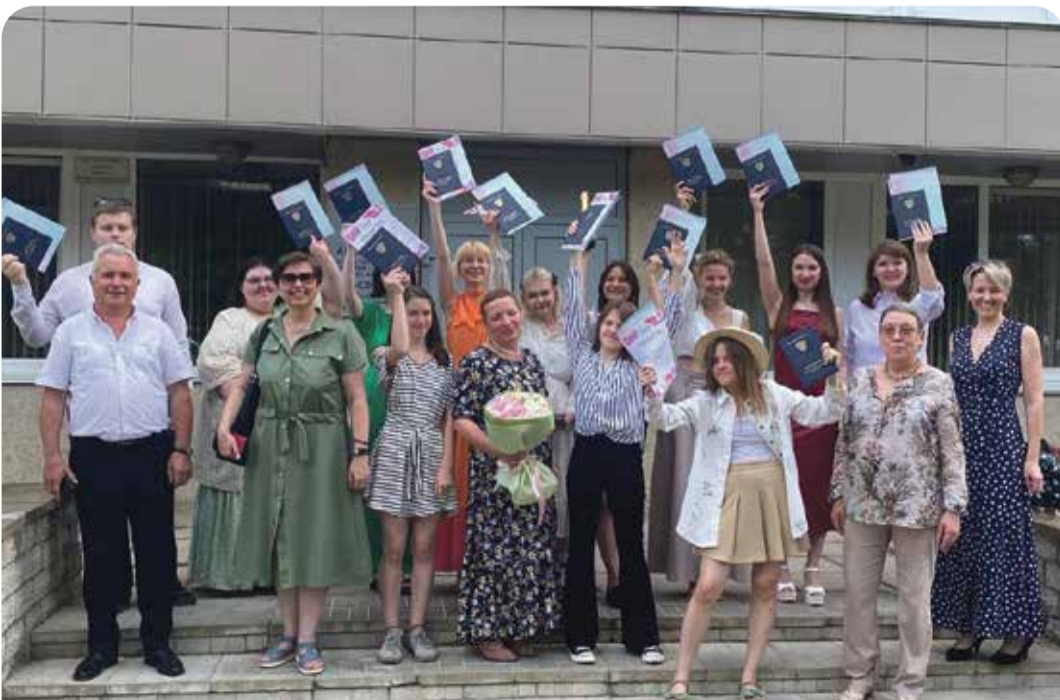
У выпускников колледжа впереди большое и интересное будущее