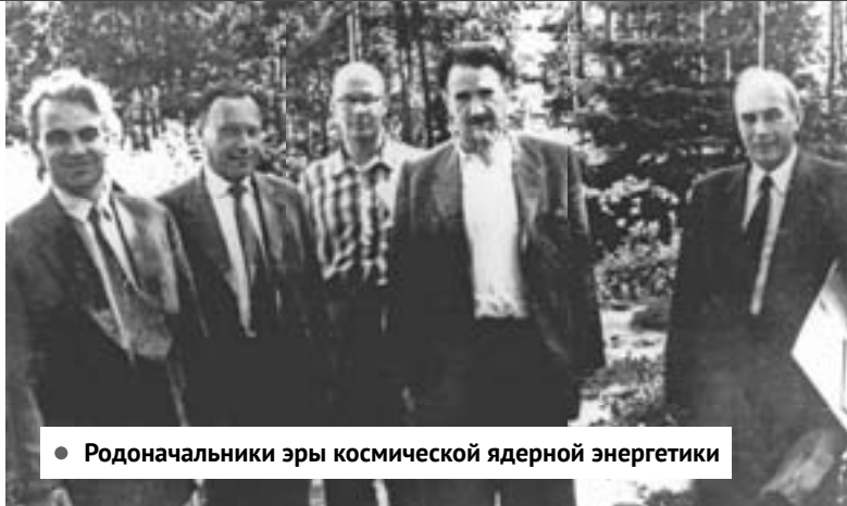
• Родоначальники эры космической ядерной энергетики

Студенты о Лейпунском читали лишь в научных книжках, где говорилось, что это известный физик-ядерщик, которого хорошо знали даже за рубежом, работавший над определением массы нейтрино.