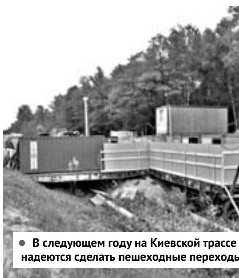
● В следующем году на Киевской трассе надеются сделать пешеходные переходы

– Действительно, состоялся конкурс, выигравшая фирма была уверена в своих силах. Но не смогла согласовать документацию с РЖД, как следствие, заказчик не оплачивает работу. Сейчас расторгается контракт, и будет объявлен новый конкурс.