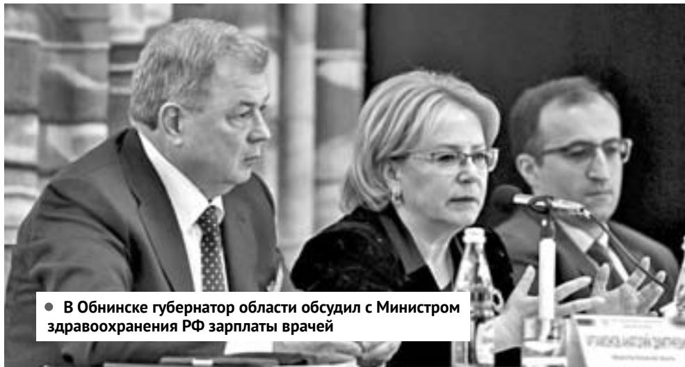
● В Обнинске губернатор области обсудил с Министром здравоохранения РФ зарплаты врачей

Конечно, жители привыкли лучи ярости и гнева слать в адрес Клинической больницы, но хочу отметить – коечный фонд заполнен. Люди находятся там, лечатся. Очень важно, чтобы Федеральное медико-биологическое агентство выполняло свои обязательства. Из бюджета ФМБА выделены деньги на приобретение оборудования. По имеющейся у меня информации, в следующем году планируется еще один транш – порядка ста миллионов рублей. Эти средства пойдут на детское здравоохранение в Обнинске.