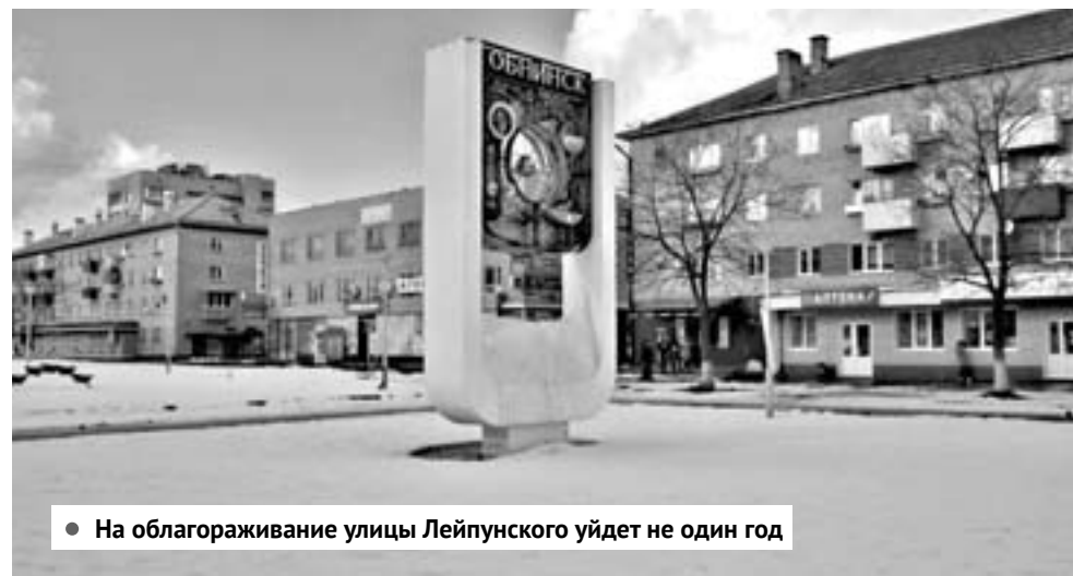
● На благоустройство улицы Лейпунского уйдет не один год

– Их много, я не могу выделить что-то одно, куда ни посмотри – все главное, мелочей вообще в жизни человека, как и в жизни города, – нет. Взять, например, новую схему движения транспорта, мы ее представляли на суд жителей, люди высказали критические замечания. На мой взгляд, отказываться от многолетнего опыта и привычек обнинцев и с головой бросаться в первое попавшееся предложенное решение тоже нельзя. Например, тот же малый круг – Ленина-Маркса-Энгельса-Курчатова, который всегда был в городе, разработчики его исключили, а мне кажется было бы логично его восстановить.