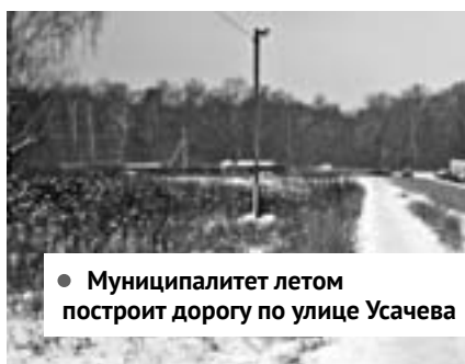
Муниципалитет летом построит дорогу по улице Усачева