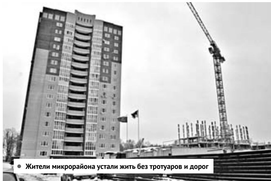
Жители микрорайона устали жить без тротуаров и дорог

– До нового года там хоть строители копошились, теперь и их нет, – рассказывают уставшие жить рядом с пустырем жители Усачева, 17.