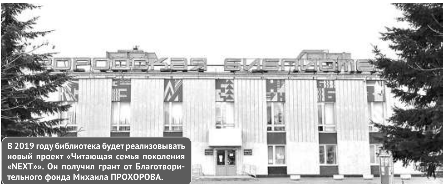
В 2019 году библиотека будет реализовывать новый проект «Читающая семья поколения «NEXT»». Он получил грант от Благотворительного фонда Михаила ПРОХОРОВА.