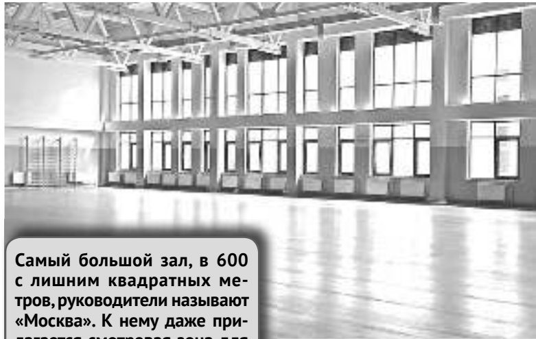
Самый большой зал, в 600 с лишним квадратных метров, руководители называют «Москва». К нему даже прилагается смотровая зона для болельщиков. Малый, светлый и уютный, прозвали «Сочи». Для гимнастического зала уже заказали тренажеры. Сегодня его именуют «Обнинск».