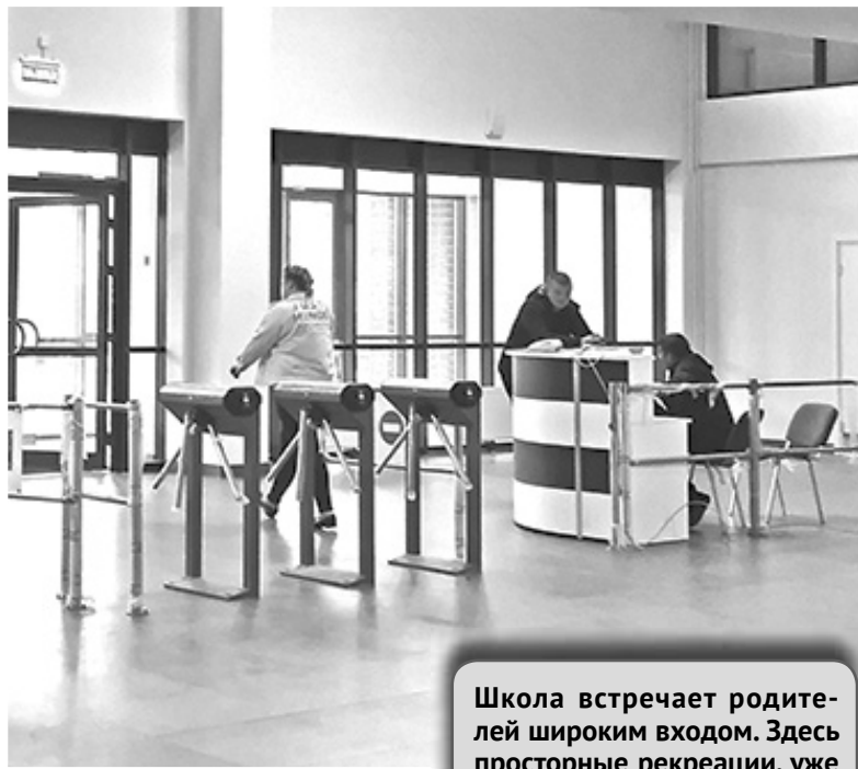
Школа встречает родителей широким входом. Здесь просторные рекреации, уже смонтирована система обеспечения безопасности.

– 15 августа в этом учебном заведении уже собирался будущий педагогический коллектив, – отмечает начальник управления общего образования Татьяна ВОЛНИСТОВА. – Мы с коллегами обсудили все проблемы – от устройства на работу до образовательной программы, которую они будут реализовывать.