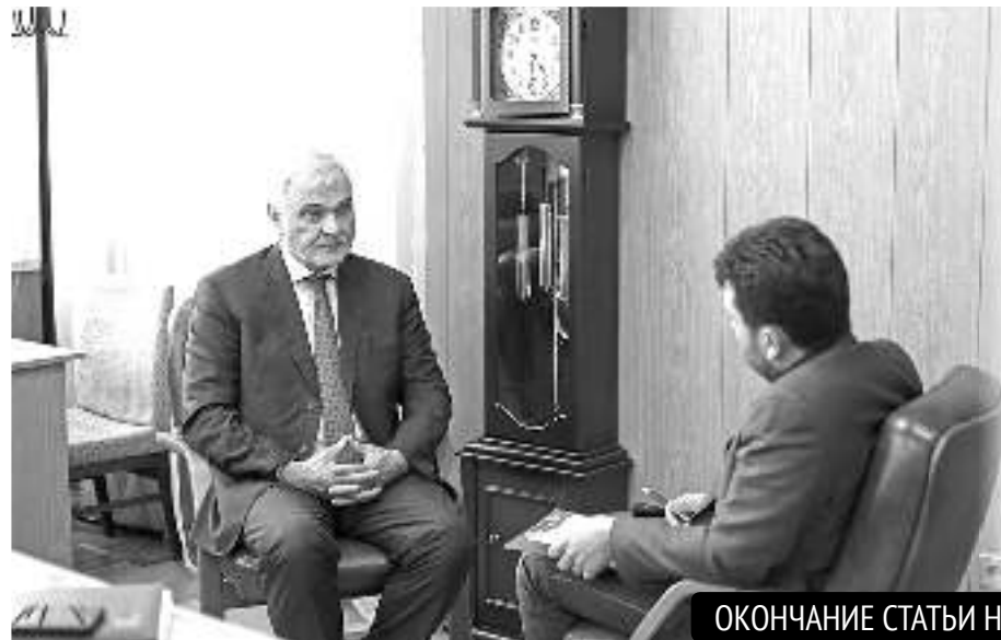
ОКОНЧАНИЕ СТАТЬИ НА РАЗВОРОТЕ ▶