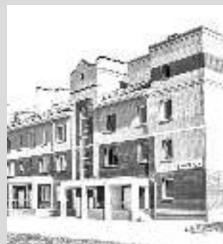
Областная инфекционная больница