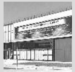
Инновационный культурный центр в городе Калуге