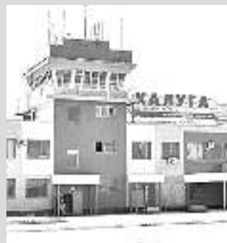
Международный аэропорт «Калуга»

На протяжении последних десяти лет Калужская область входит в первую пятерку регионов Центрального федерального округа по объему строительных работ на душу населения. С 2015 года построены: