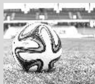
2 футбольные тренировочные площадки к Чемпионату мира по футболу

И множество других объектов капитального строительства. Сегодня на одного жителя региона приходится 30 квадратных метров жилой площади, и эксперты отмечают, что на рынке нет такого спроса, чтобы строить жилье в прежних объемах.