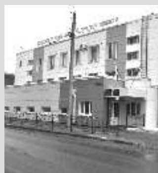
Государственный областной архив