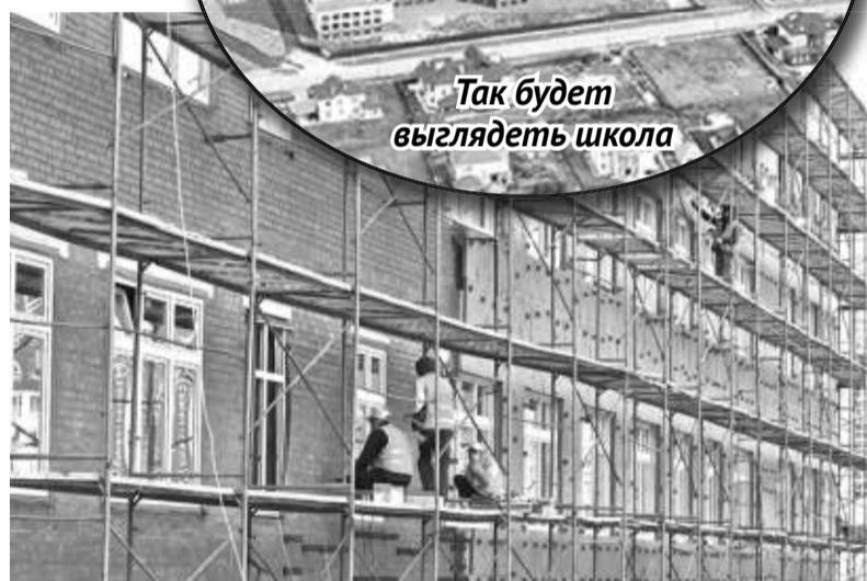
Так будет выглядеть школа

Здание новой школы трехэтажное. В нем разместятся учебные классы, лаборантские, комнаты отдыха начальной школы, помещения для труда и макетирования, библиотека, актовый зал с помещениями, три спортивных зала, столовая. В спортивной зоне на территории школы размещены поле для мини-футбола с защитной зоной, площадки для волейбола, баскетбола и гимнастики.