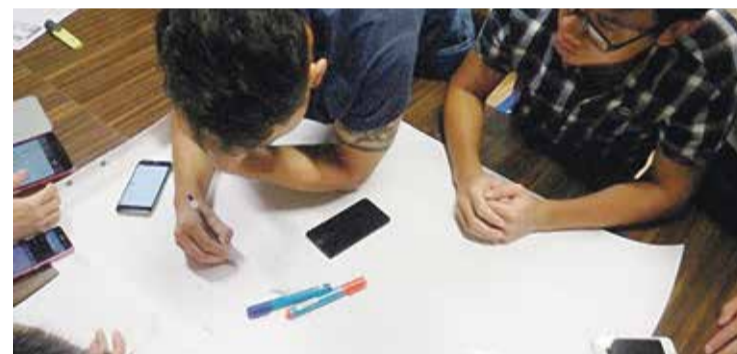
■ Первые научные труды