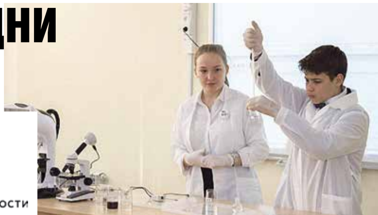
■ Успешные эксперименты студентов-атомщиков