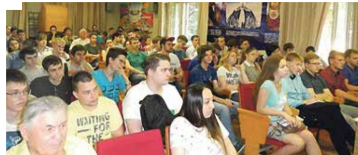
■ Лекция-введение в атомную отрасль