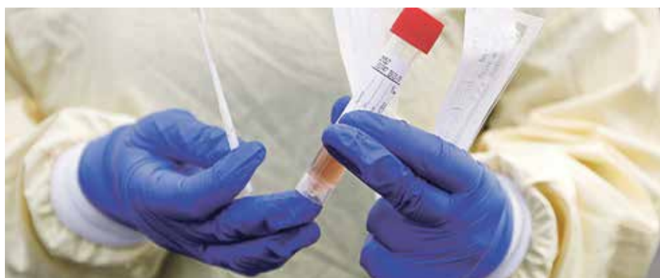
■ В Обнинске за неделю удается протестировать от 300 до 345 пациентов