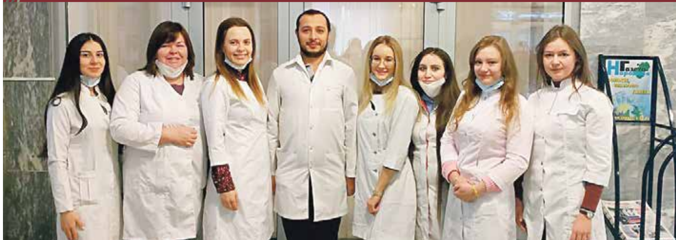
■ Группа студентов-волонтеров