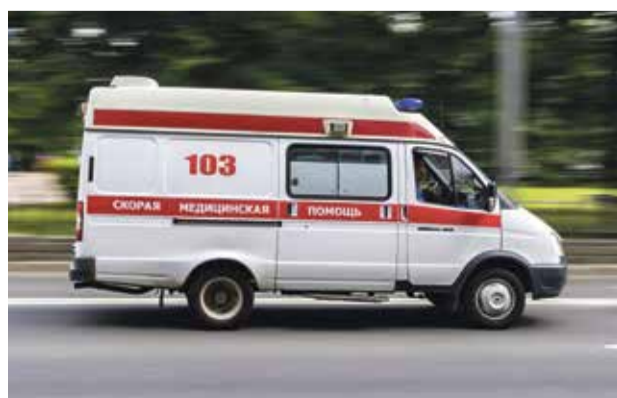
■ Бригады скорых едва справляются с нагрузкой