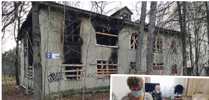
■ Тот самый дом на Парковой, 7

То есть, как она пояснила, этот вопрос не в компетенции Фонда, а в ведении