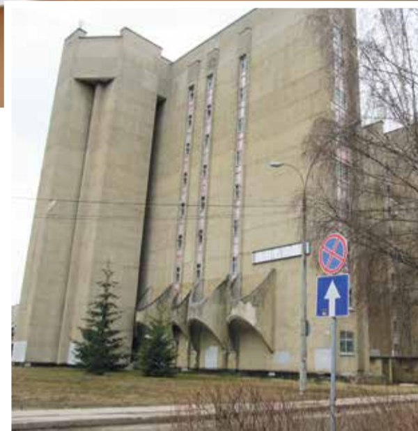
■ В КБ № 8 к ковиду готовы

С итуация с коронавирусом в наукограде остается напряженной. Но медики и представители городской администрации делают все возможное, чтобы ее выправить.