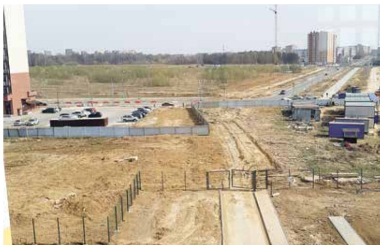
■ Возможен ли вход в школу через строящийся детсад?

— Я что не могу пригласить друзей и поиграть в футбол? — удивляется подросток.