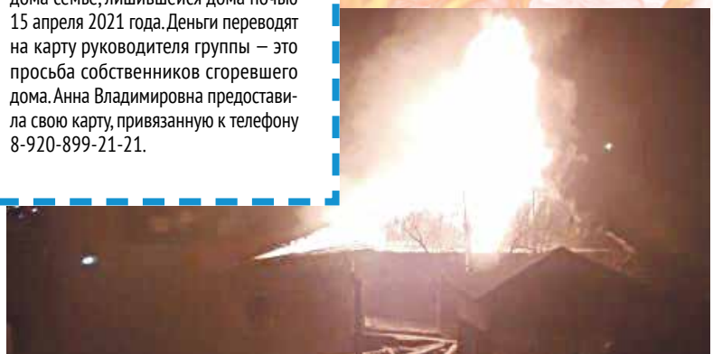
Пожар тушили тремя машинами