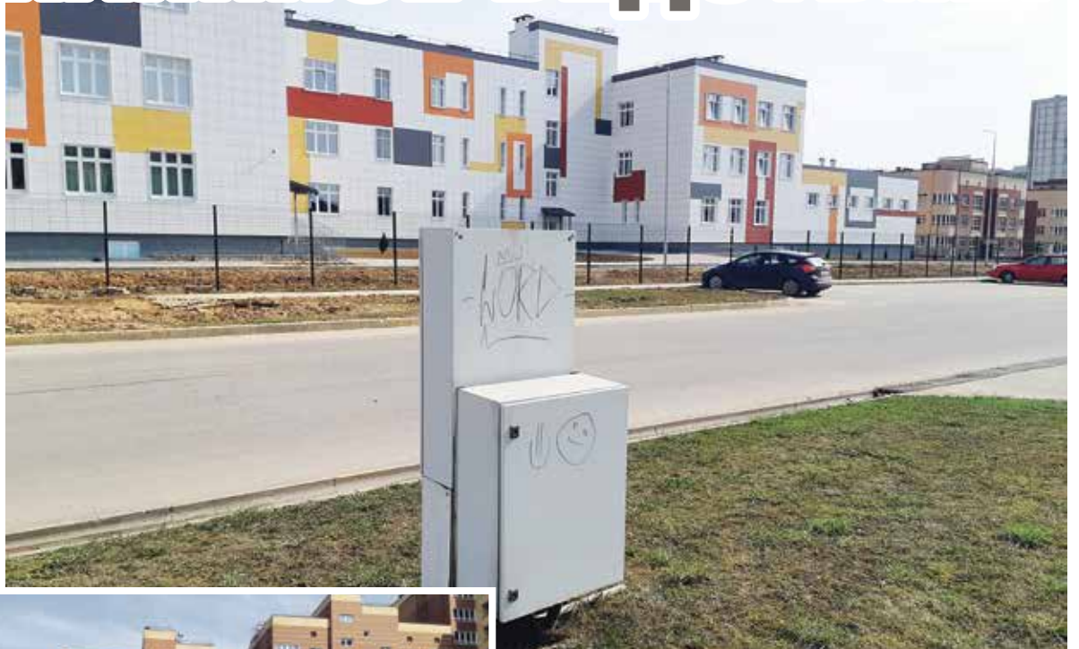
■ Загадочные белые ящики

«Поступают жалобы от жителей, которые оплачивают обслуживание детских площадок», — написано в послании, подписанном И.И. ИВЛИЕВЫМ, директором ООО «ИНФРАСТРУКТУРА». Слава Богу, хоть на бабушку местные жители не жалуются.