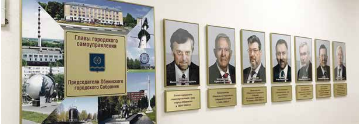
■ 2 апреля при входе в конференц-зал Обнинского городского Собрания вывесили портреты всех глав городского самоуправления и председателей Горсобрания.