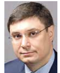
Александр АВДЕЕВ, депутат Госдумы РФ:

Немного подробнее о том, куда можно направить калужский кусок «пирога» от обещанных 500 млрд. рублей в виде инфраструктурных кредитов, нам рассказал депутат Госдумы от Калужской области Александр Авдеев.