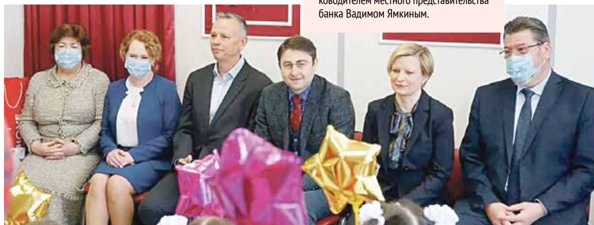
■ В Home Credit Bank отметили день рождения детского сада