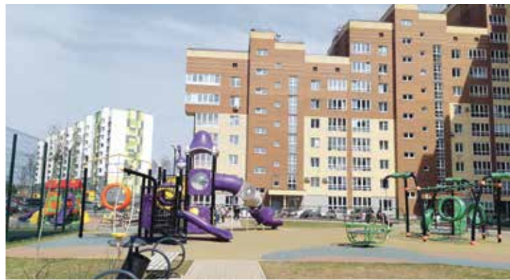
■ Территория раздора

Проектная наполняемость школы — тысяча учеников, но все идет к тому, что их будет гораздо больше. И это будут, в основном, дети из района «Нового города». Спрашивается, каким образом ретивые тетушки собираются отделять «своих» детей от «чужих»? Тем более, что там будут уже и дети до 12 лет, а значит, требовать, чтобы семилетняя малышка с мамой ушли с детской площадки будет уже совсем не так логично. Или местным мешают исключительно интеллектуальные воспитанники ФТШ? Тогда это уже патология какая-то.