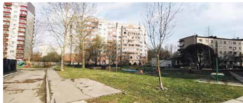
■ Двор рядом с ЖК «Репинка» нуждается в благоустройстве