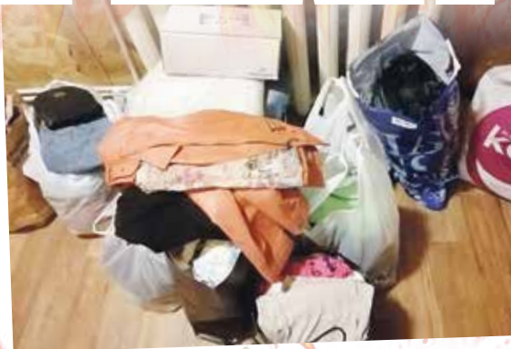
Жители Обнинска помогают погорельцам

Второе заявление — о предоставлении жилья пострадавшей семье, в кото-