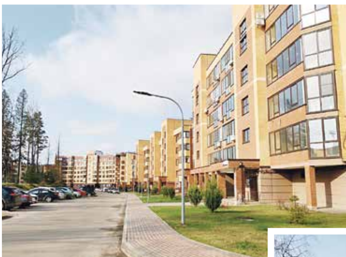
■ ЖК «Репинка» — лучший микрорайон области