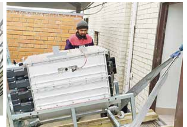
■ Рабочим пришлось потрудиться, чтобы поднять котел на 17 этаж

при монтаже котлов, поэтому те так скоро стали выходить из строя.