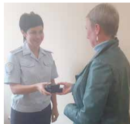
■ Возвращение украденных украшений владельцу

Полиция предупреждает! В целях профилактики совершения квартирных краж, если вы проживаете на первом этаже, не оставляйте открытыми окна. Будьте бдительны. Впрочем, желающего оказаться за решеткой ничего не остановит.