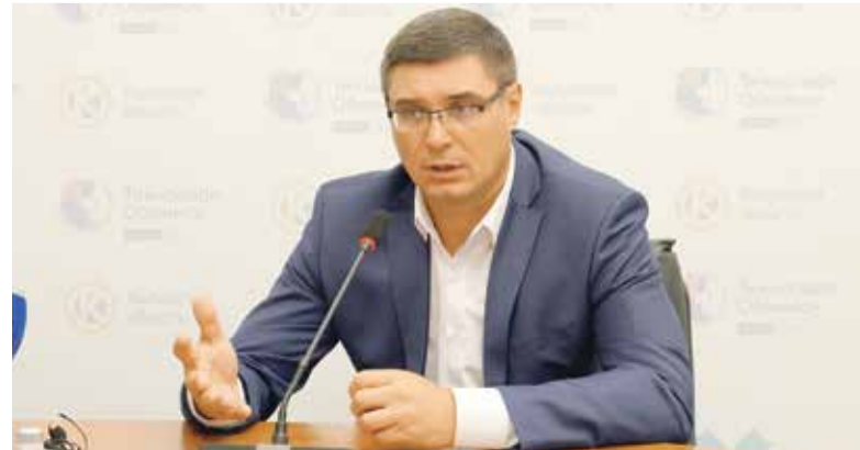
■ Депутат Госдумы Александр Авдеев