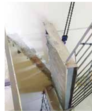
■ Подъем котла в обнинском доме по Усачева, 17