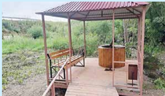
■ Благоустройство родника в д Речицы