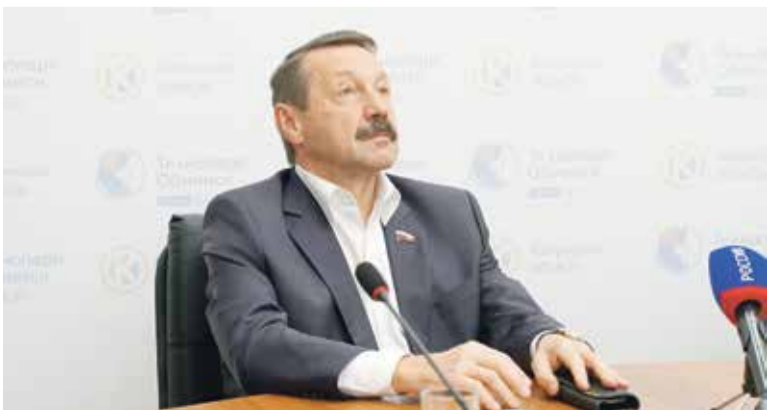
■ Депутат Госдумы Геннадий Скляр