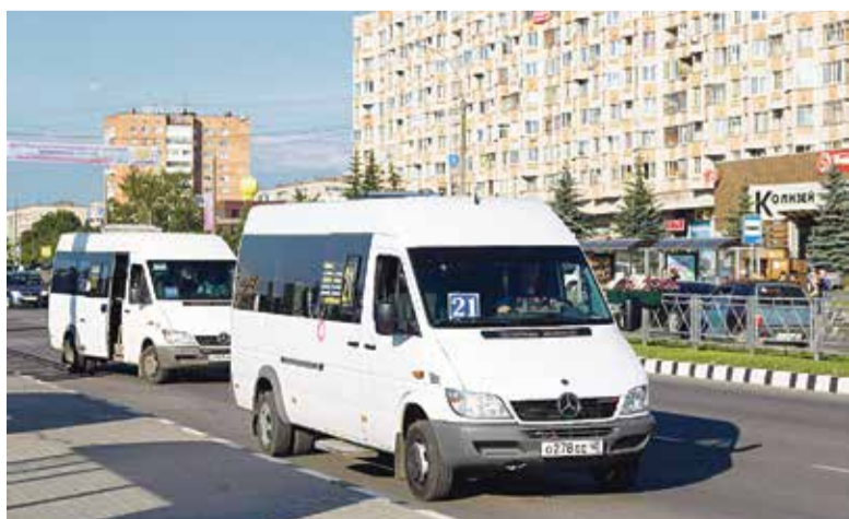
■ Маршрутное такси № 21 пассажиры ждали не менее получаса

И он не единственный, кто об этом сообщает. К большому сожалению.