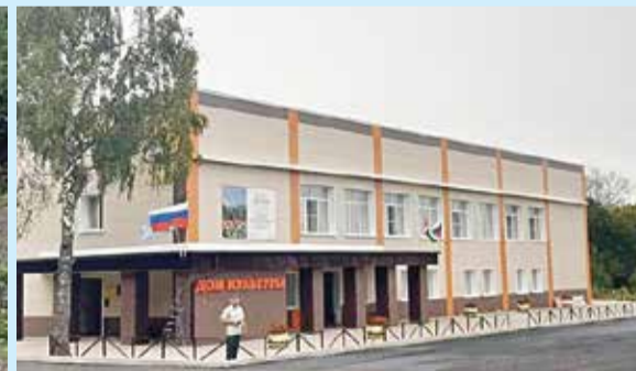
■ Благоустройство территорий в МО СП Деревня Людково

— Жителям приятно видеть плоды своего труда. Например, в Мосальске после проведения