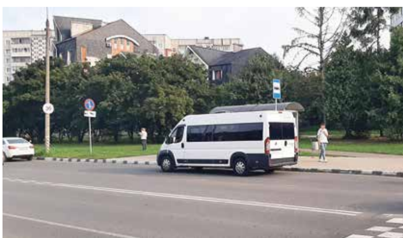
■ Водителям не нравится, что пассажиры стали пользоваться транспортными картами