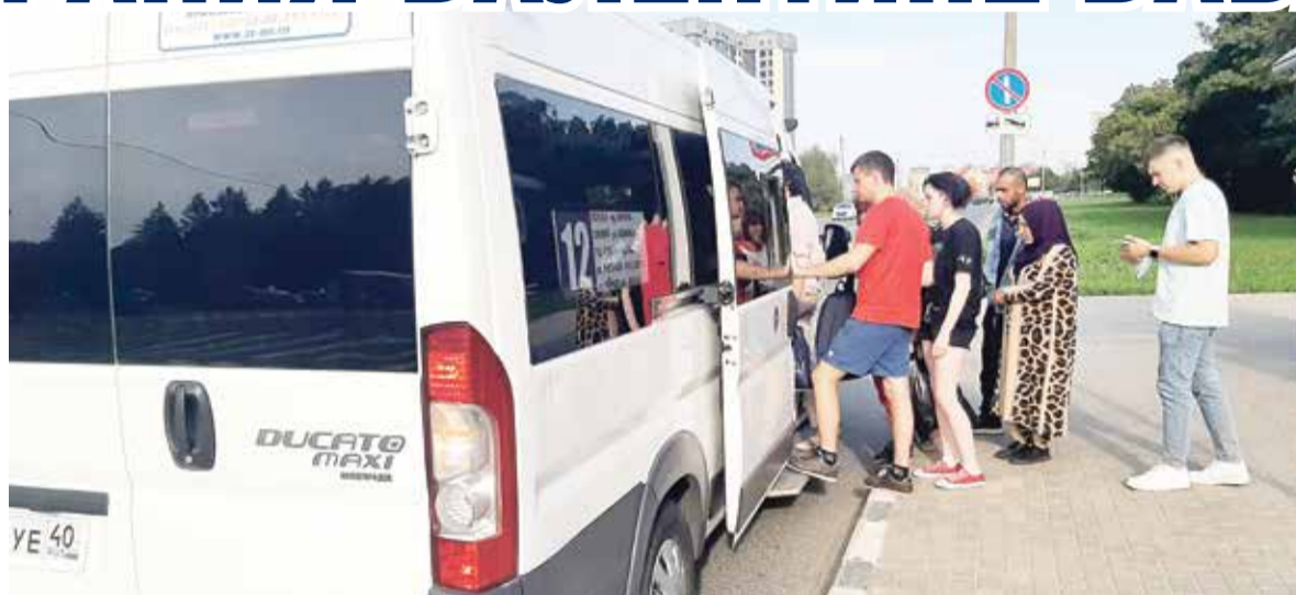
■ Водителя-грубияна отстранили от работы на два дня

– И вот это мы наблюдаем в первом наукограде! – отметила третья пассажирка.