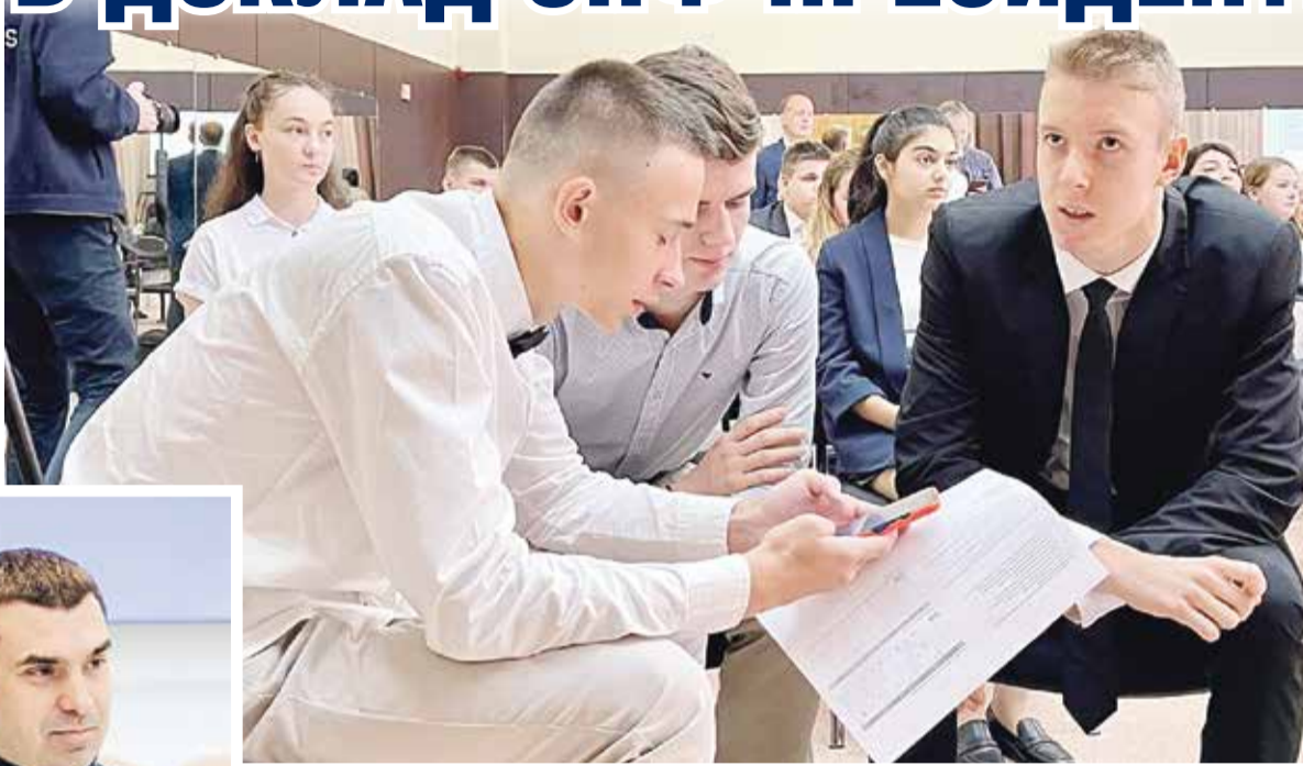
Урок общества «Знание»

Учителя страны, участвующие в этом проекте, бесплатно помогают ребятам из детдомов подготовиться к экзаменам для поступления в вузы и техникумы.