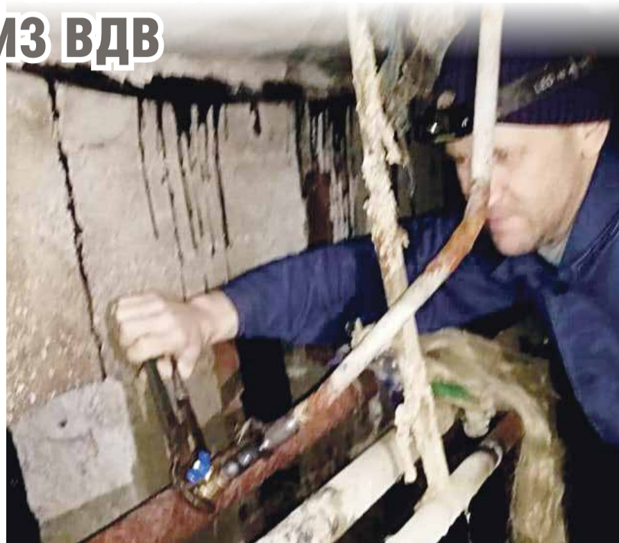
■ Устранение аварии на Любого, 6

А в самой аварийно-диспетчерской службе города рассказывают, что в последнее время их специалистов все чаще вызывают жильцы, которых обслуживает управляющая компания «Суворовец».