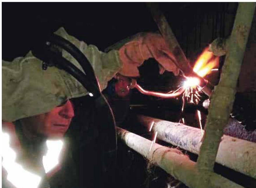
■ Работникам АДС приходится трудиться за управляющие компании

– Следует отметить, что данный инцидент случился вечером. И, как правило, такие заявки в это время уже передавать некому – в управляющих организациях работают до 17:00. Обученного персонала у ООО «Суворовец» также пока нет. Поэтому получилось почти как в девизе у ВДВ – кто, если не мы? – сказал руководитель МП «УЖКХ».