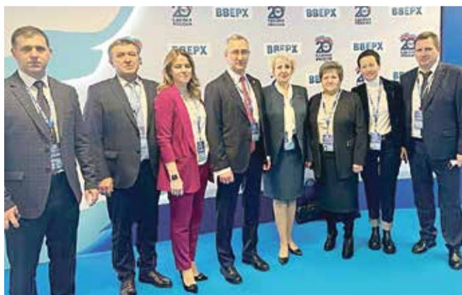
■ Представителям Калужской области было о чем рассказать на 20 съезде партии