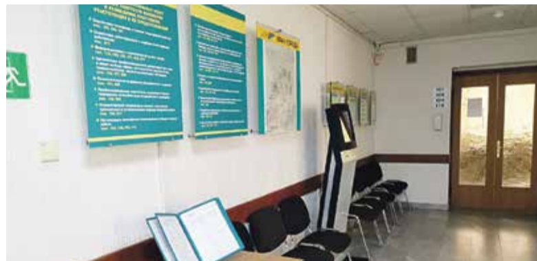
■ Достаточно походить по коридорам службы занятости и почитать объявления, чтобы найти нужную работу

Однако чаще всего по специальности такие граждане трудиться не в состоянии. Даже те, кто имеет высшее образование, в силу сложности заболевания вынуждены идти в дворники или в сторожа. Кто-то соглашается, кто-то нет. Часто и сами работодатели не горят желанием брать к себе инвалидов. Такие требования выдвигают, что соответствовать им могут даже далеко не все здоровые люди. Но с 2013 года уже они