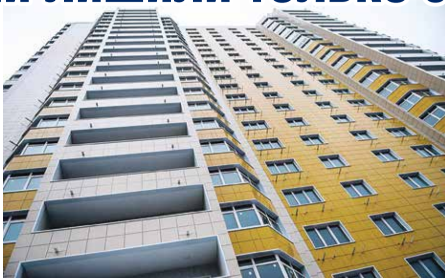
■ Жалобы жителей в ГЖИ не прекращаются круглый год.