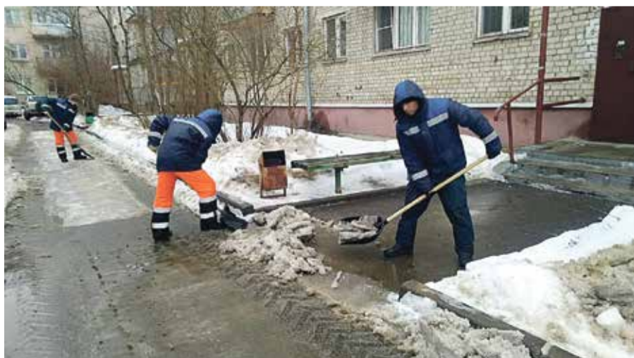
■ Подход к подъезду должен быть безопасным.