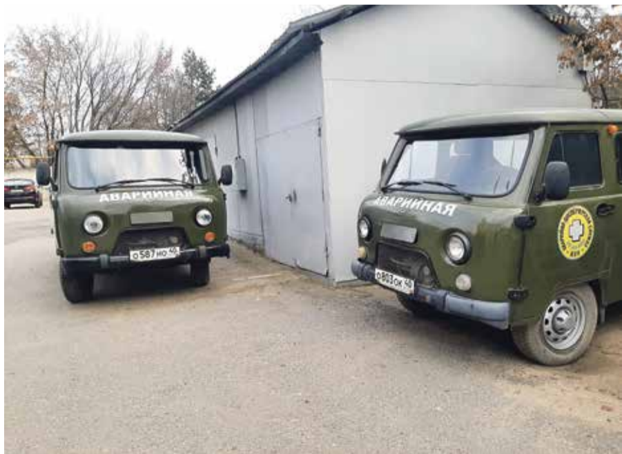
■ Спецтехника аварийной службы

Женщина два месяца провела в коме. Сейчас она уже дома — с дочерью и мужем.