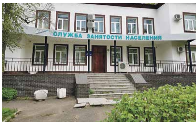
■ Здание обнинского Центра занятости.

ся проблем, рекомендаций врачей и ограничений. И специалисты ЦЗН, ориентируясь на конкретную программу, подыскивают подходящую вакансию.