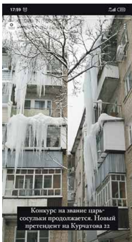
Конкурс на звание царь-сосульки продолжается. Новый претендент на Курчатова 22

В зависимости от погоды и осадков ратрак вновь появится в Обнинске в ночь либо на пятницу, либо на субботу и подготовит отличную трассу для горожан. В феврале, перед традиционными гонками, ее разровняют еще раз.