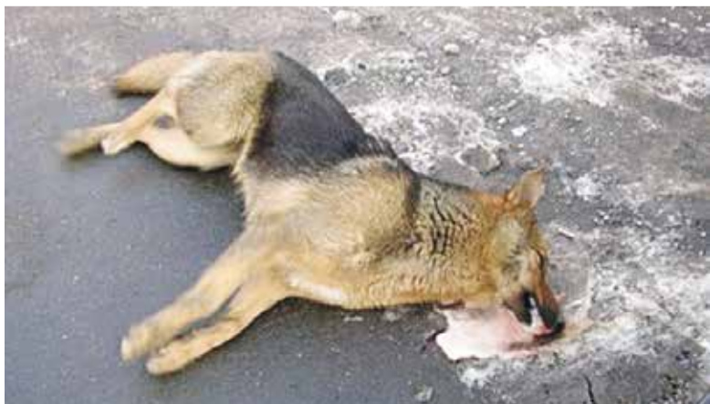
■ Зимой бродячим животным особенно тяжело выживать