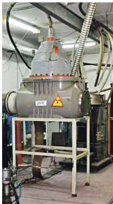
■ Электронный ускоритель «Дуэт» (ИСЭ СО РАН, Томск)

— Сегодня вопросы качества и безопасности агропромышленной и пищевой продукции являются