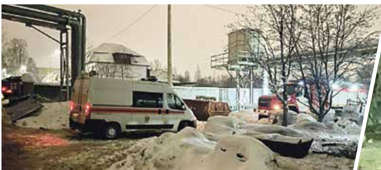
■ На место взрыва прибыли скорая и спасатели МЧС.