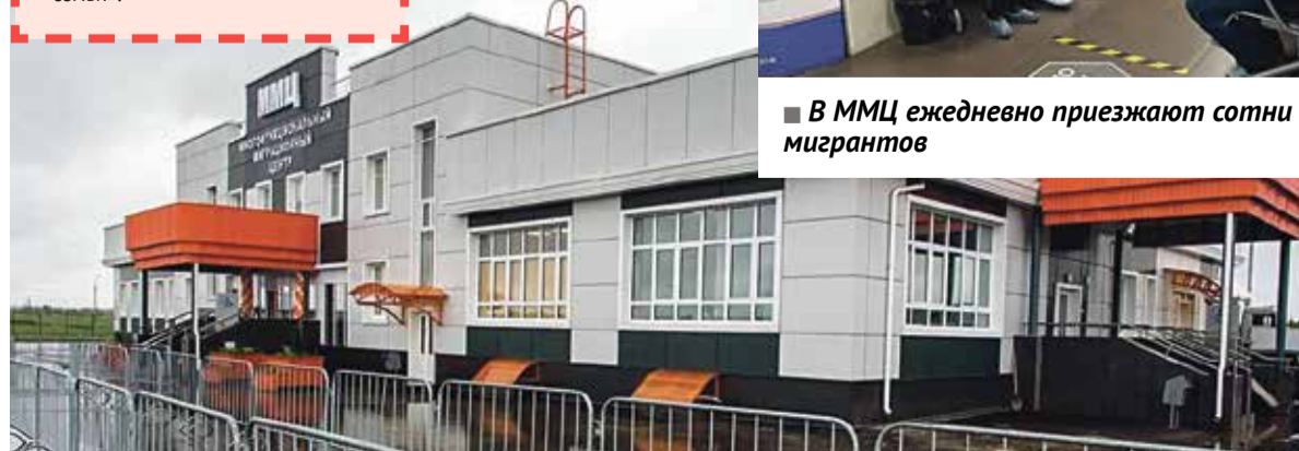
■ Миграционный центр