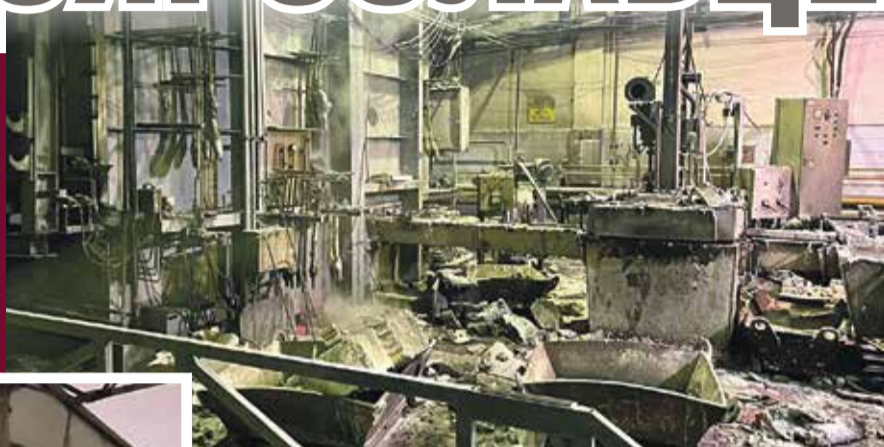
■ На восстановление цеха понадобится 30 миллионов рублей.

Ж уткое ЧП случилось в ночь 1 февраля в Малоярославце. На предприятии ООО «Агрисовгаз», которое занимается изготовлением металлоконструкций, произошел взрыв. Пострадали рабочие.