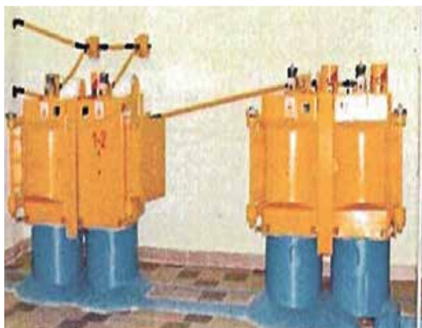
■ Гамма-установка ГУР-120 (ВНИИРАЭ), Обнинск

— Конечно, такая оценка нашего труда очень приятна. Важно, что тематика, которой мы занимаемся, оказалась интересна для многих. И для Калужской области в том числе. Это перспективная технология, и сейчас у нас в институте это направление широко развивается. Мы активно развиваем как научные исследования, так и практическое применение технологий. Сотрудниками нашего института в последние годы была написана монография по радиационным технологиям, опубликованы статьи в ведущих журналах, организована серия конференций. Институт является членом международной ассоциации по облучению. Само направление развивалось еще в прошлом веке, но в перестройку работы были остановлены. Многие установки в стране вообще не сохранились. А у нас благодаря дальновидности руководства осталась установка ГУР-120 для облучения