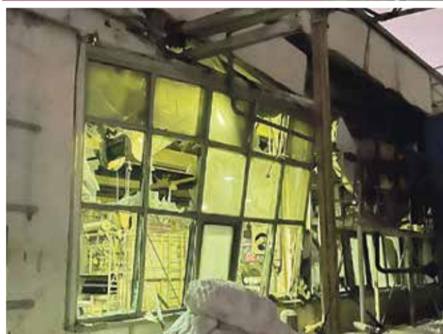
■ Стекла повывлетали, стены разрушились.