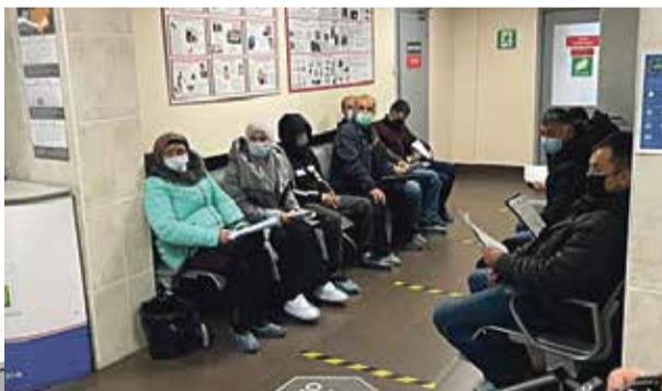
■ В ММЦ ежедневно приезжают сотни мигрантов

Тем временем владельцы предприятия сетуют, что людей не хватает. Специалисты предпочитают уезжать в Москву, там заработок выше, даже сварщика на хорошую ставку в сто тысяч рублей найти не удалось.