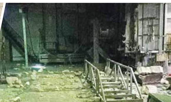
■ Так выглядел литейный цех № 1.