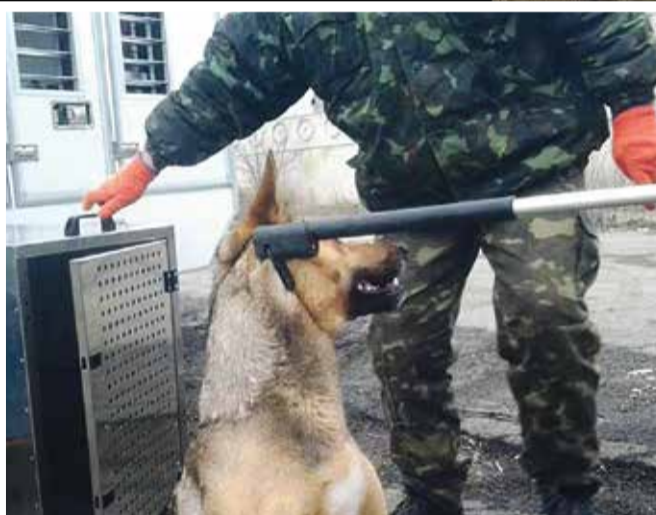
■ В Обнинске отлавливают всех собак, на которых жалуются жители