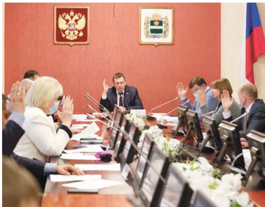
■ Заседание депутатов Заксобрании Калужской области