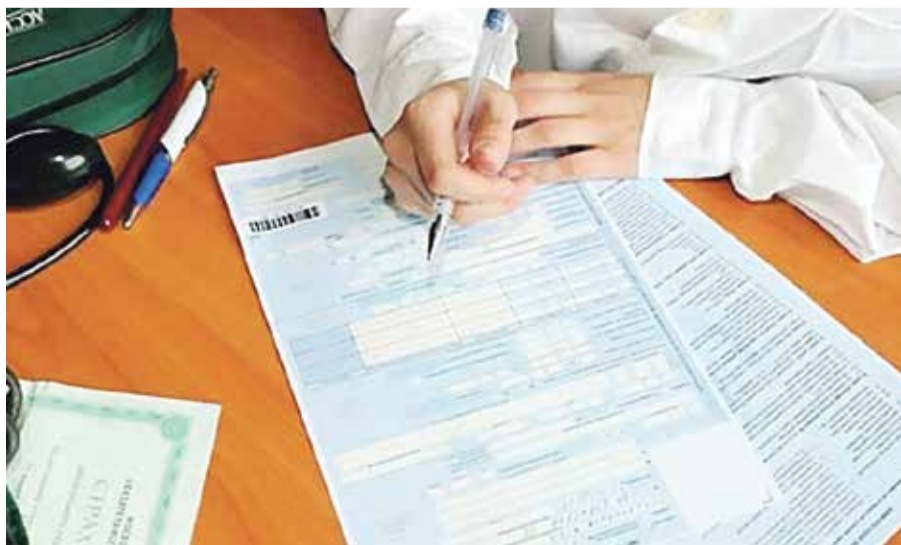
■ Больничный получить оказалось делом непростым

В моем состоянии сидеть в очереди даже не порядочно по отношению к другим людям. Я ведь не знаю, что у меня — ОРВИ или ковид. А рядом сидящих людей могу заразить