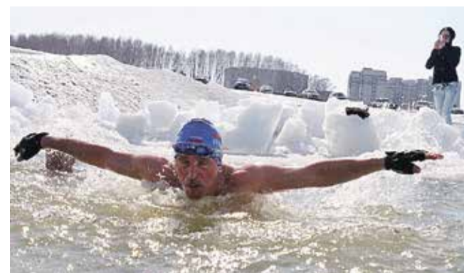
■ В Обнинске будут развивать зимнее плавание

Уборка снега в Обнинске – актуальная проблема. В данном случае – приведение в порядок парковок у торговых объектов. Практически все парковки были построены при условии, что бизнес будет их очищать от снега. Напоминаю руководителям магазинов, ресторанов и аптек об этом обязательстве. Город должен быть активнее в наведении порядка.