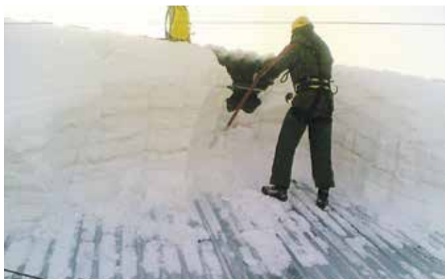
■ 90% из протекающих кровель пока капитально не ремонтировались

Тем не менее, граждане продолжают обращаться