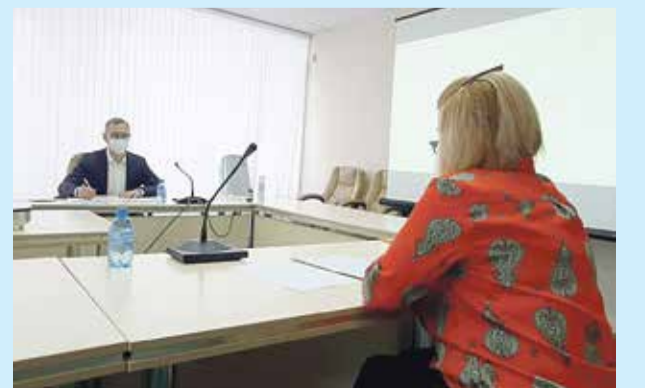
■ Вопрос мигрантов — на карандаше