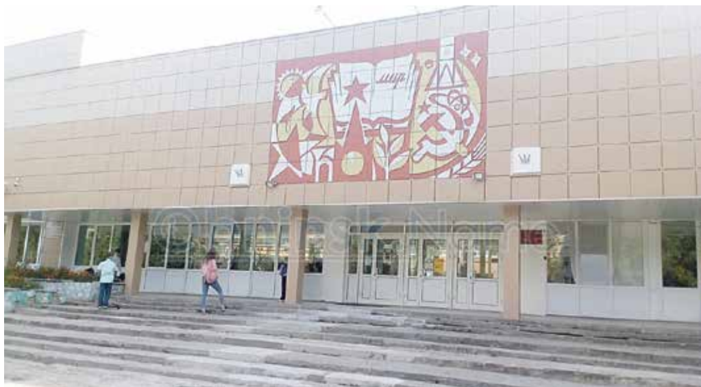
■ Та самая школа № 10, где вахтер ударил женщину

Кстати, на охрану школ Обнинска в 2021 году было выделено порядка 17 миллионов рублей, а на охрану детских садов — порядка 18 миллионов. И за такие деньги родители и педагоги хотели бы получать качественные услуги.