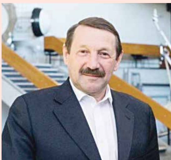
■ Владислав Шапша 8,5 часов работы non-stop спустя

два очень важных качества губернатора: его готовность к открытому обсуждению всех острых проблем, которые он видит и дает свою оценку и второе качество – это способность к решительным действиям. То, что вчера было озвучено решение губернатора о наведении порядка в миграционной сфере – это не только отражает правильную и быструю реакцию на накопившуюся проблему, но и показывает, что губернатор умеет быстро находить и принимать решения. Это, безусловно, заслуживает поддержки. Мы должны поддержать нашего губернатора и в открытом диалоге, и в тех решениях, которые он принимает».