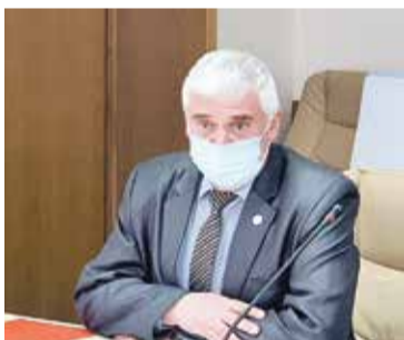
■ ДОСААФ выделяют автобус для обучения водителей

Город договорился с ДОСААФ о подготовке водителей для муниципального пассажирского автотранспортного предприятия. ДОСААФу нужен автобус для обучения. Поможем решить этот вопрос.