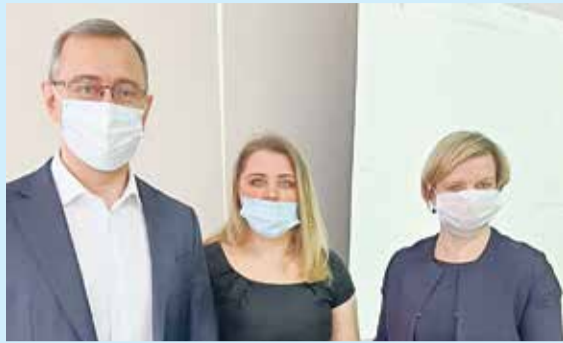
■ С многодетными семьями Обнинска будет проведена дополнительная работа