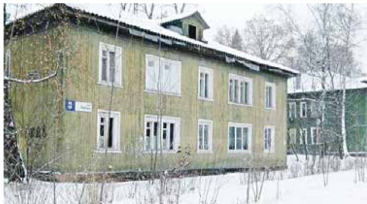
■ Вопрос с переселением из ветхого жилья в поселке Мирный должен решиться в этом году