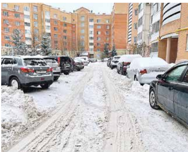
■ Большое количество жалоб поступило на уборку придомовых территорий

Жители микрорайона «Поселок Обнинское» давно обращаются с вопросом о возможности строительства канализации. Задача сложная. Очень важно предварительно обсудить вопрос со всеми жителями поселка. Строительство подобного масштаба неизбежно приведет к длительным неудобствам и в некоторых местах даже к изменению границ личных домовладений. Администрация Обнинска до конца года проведет необходимую предварительную работу и вынесет результаты на обсуждение.