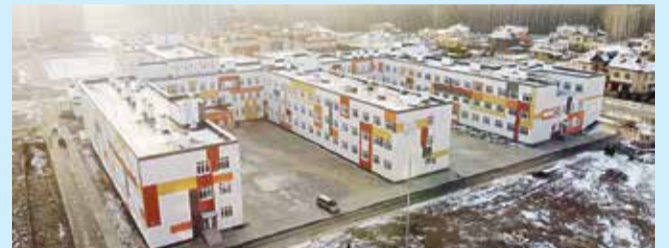
■ Основной вход в 18 школу будет перемещен