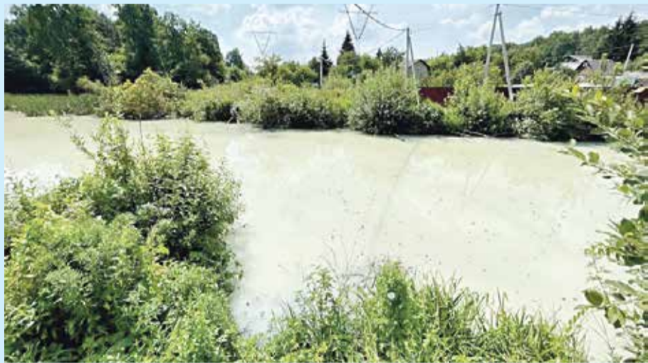
■ Вот так чаще всего выглядит Безымянный ручей