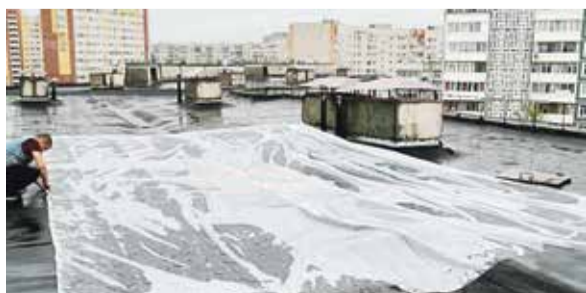
■ В прошлом году подрядчики допускали меньше недоработок в ходе ремонта крыш

— Так что основные способы устранения подобных проблем — это своевременная очистка снега с крыш в домах с организованным водоотводом и методическое сбивание сосулек в тех домах с ролонными кровлями (без организованного водоотвода), где чистить кровлю