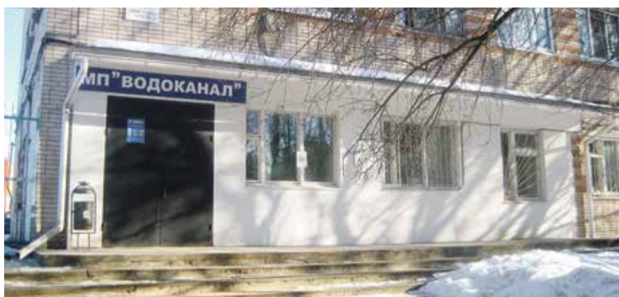
■ В МП «Водоканал» сейчас не взыскивают пени с должников

Он отметил, что педагогическое образование вошло в тройку самых востребованных направлений подготовки среди абитуриентов. Впервые в России сложилась ситуация, когда количество потенциальных учителей оказалось выше числа поступающих на юристов. За последние 2 года прием по направлению «Образование и педагогические науки» увеличился почти на 10 тысяч человек.