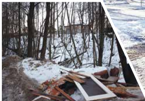
■ Работа еще предстоит большая