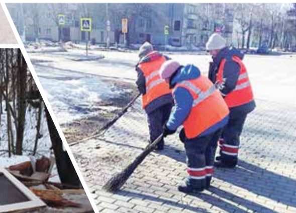
■ Уборка - дело первостепенное

красили памятник первопроходцам атомного флота и памятника Леониду Осипенко. А в настоящее время сотрудники службы благоустройства приступили к уборке смета с городских улиц.