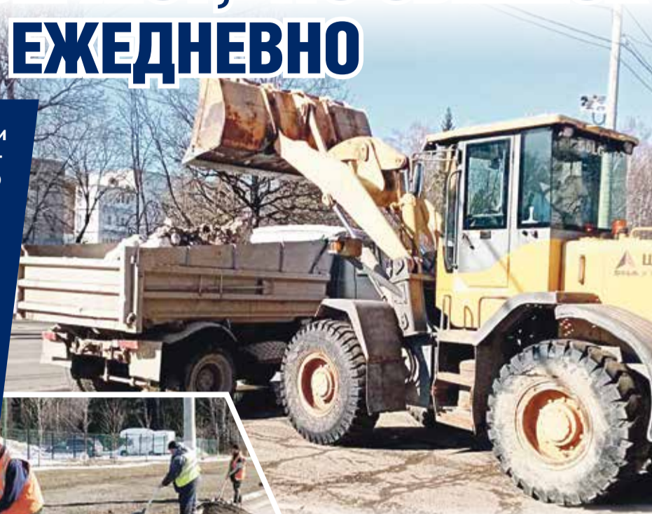
■ Собираются остатки снега

С их слов, от мусора в городе было очищено 1267 урн, установленных в скверах, на остановках и вдоль тротуаров. Так, в сквере на улице Лейпунского освобождены от мусора 58 урн, очищены от снега тротуары, территории у скамеек, вывезен 1 кубический метр мусора. Ежедневно всю прошлую неделю проводилась уборка железнодорожного подземного пешеходного перехода. Его стены отмывали от граффити. Такую же работу проводили и в других местах, где свой след оставили юные обнинские «художники». Остановочные павильоны и заборы у нас также любят разукрашивать. Кроме того, рабочие МПКХ помыли и по-