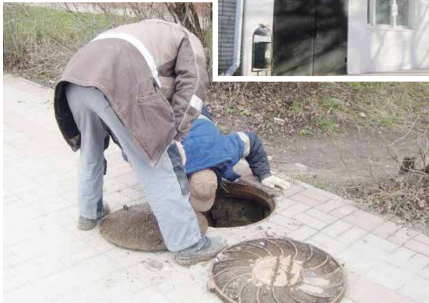
■ Канализационные колодцы должны быть всегда закрыты