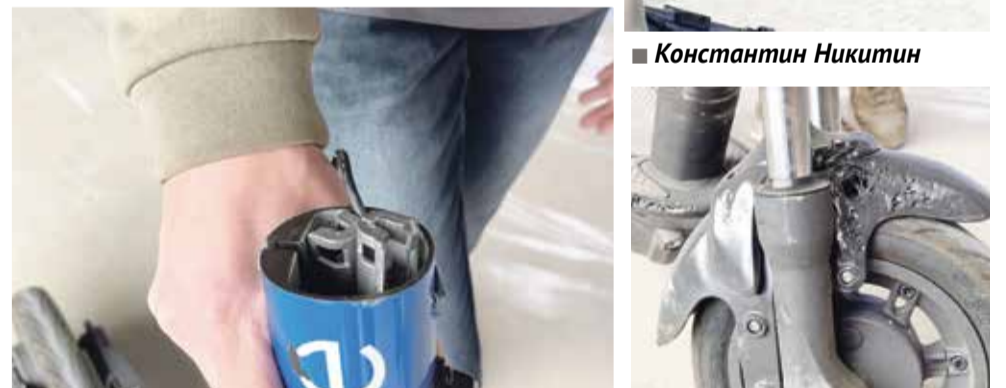
■ Новый самокат сломали буквально сразу

Кстати, всех, кто думает, что угнать самокат просто — спешим разочаровать. В него встроена система безопасности, которая полностью блокирует транспортное средство. То есть самокат по факту становится полностью бесполезным — колеса не едут. И, видимо, раздосадованные этим фактом воришки и выбрасывали «железные коней» где попало.