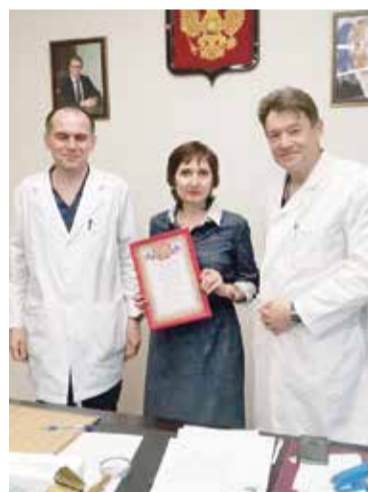
■ С руководством МРНЦ Обнинска

– В настоящее время мы уже начали формировать Совет родителей. Пока общаемся с председателями родительских комитетов школ и садиков. Это самые активные люди, и они всегда в курсе всех проблем. До конца мая составим список членов Совета, а в июне соберем, подведем итоги года и спланируем работу на следующий год.