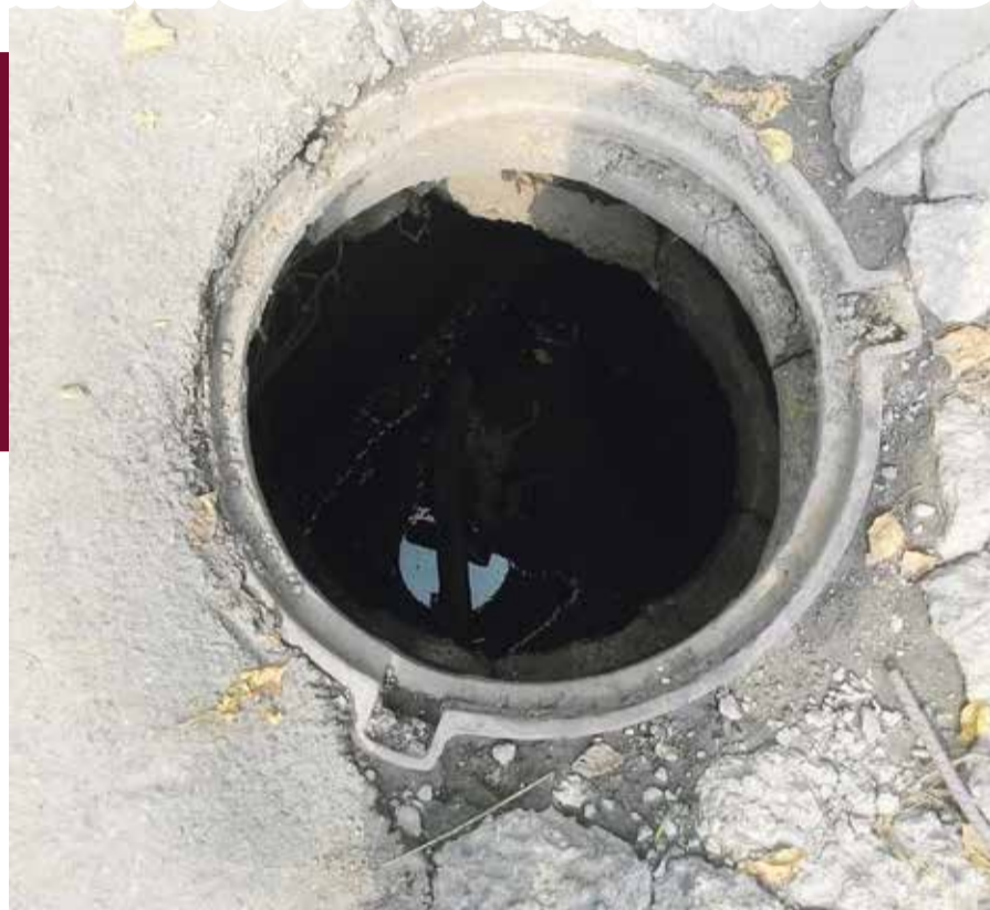
■ Таким люк быть не должен

Обходчики МП «Водоканал» ежедневно проверяют наличие крышек люков. При этом надо понимать, что