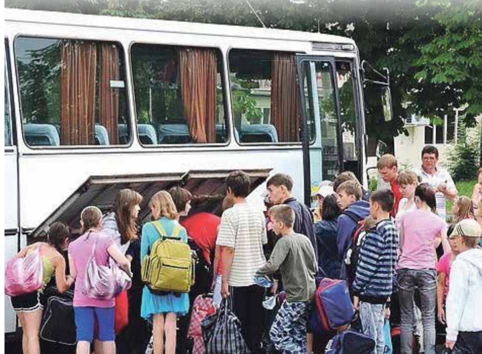
■ Российские школьники поедут на бесплатные экскурсии