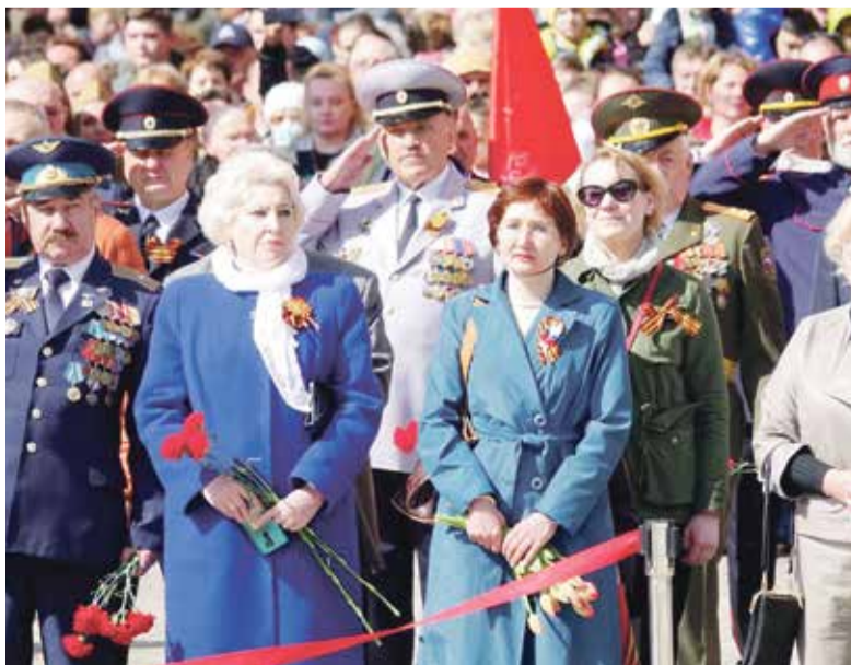
■ Во время празднования Дня Победы

— С дипломом победителя или призера в олимпиаде абитуриенты претендуют на определенные привилегии при зачислении в вузы на бюджетные места. А вот тот факт, что мы в этом учебном году запустили новую 18-ю школу, стало одновременно и достижением, и проблемой. Школа работает успешно и отзывы о ней от родителей, от детей хорошие. Там достаточно активно проводятся воспитательные мероприятия, организован широкий спектр занятий дополнительного образования, коллектив сложился сильный. Хотя на определенном этапе была нехватка учителей. И в то же время 18-я школа стала точкой напряжения в той части микрорайона, где она построена. Дело в том, что микрорайон этот развивается очень быстро, вводятся в эксплуатацию новые дома, а учебное заведение там одно единственное. И нам поступило уже порядка 200 заявлений по поводу зачисления детей в первые классы. Мест на всех не хватает, поэтому планируем открыть там дополнительные классы, чтобы принять всех ребят, которые проживают в домах, территориально относящихся к этому учебному заведению.