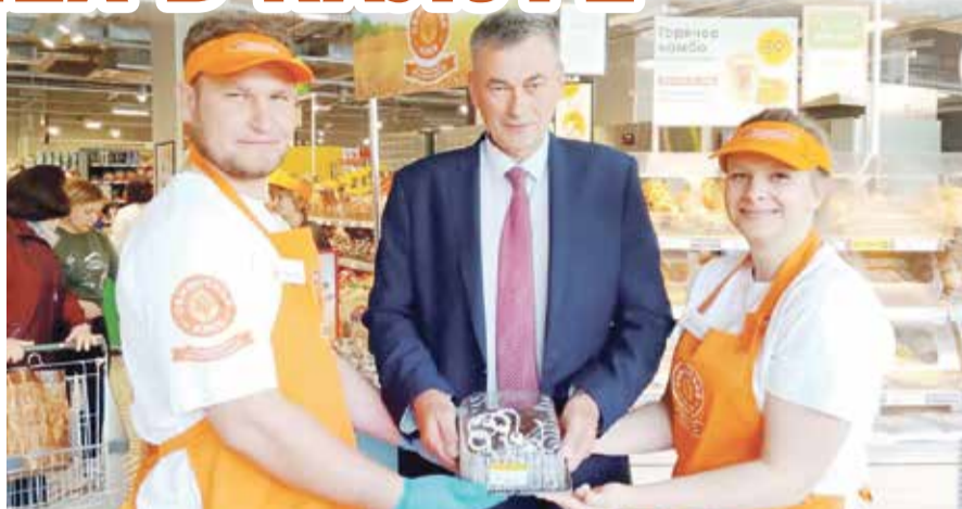
■ Продукция обнинского хлебокомбината на выставке в Калуге

и других микроорганизмов, обитающих в кишечнике. О пользе моркови тоже известно.