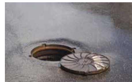
■ Металлические крышки колодцев стоят около 10 тысяч рублей