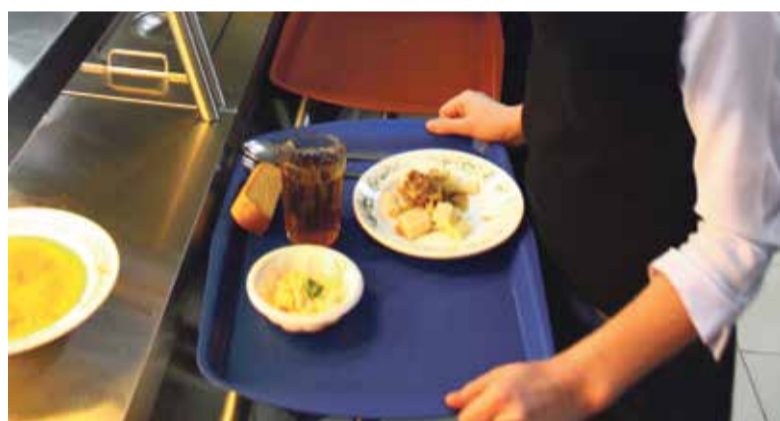
Горячие завтраки получают только учащиеся начальной школы и дети льготных категорий

Сухие пайки во всех муниципалитетах также выдаются детям, находящимся на домашнем обучении. И суммы их не сильно разнятся. Так, в Малоярославецком районе один паек стоит 136 рублей. Он дороже обнинского всего на 4 рубля. Разница не столь принципиальная, главное, чтобы эта программа продолжала работать.