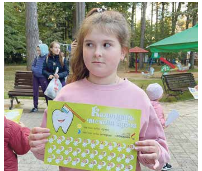
■ Стоматологическую грамотность нужно прививать с детства