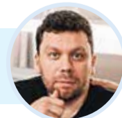
Автор: Евгений СЕРКИН