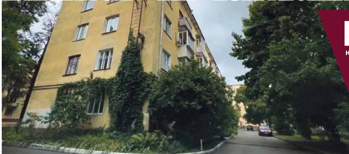
■ Дом 44 по проспекту Ленина