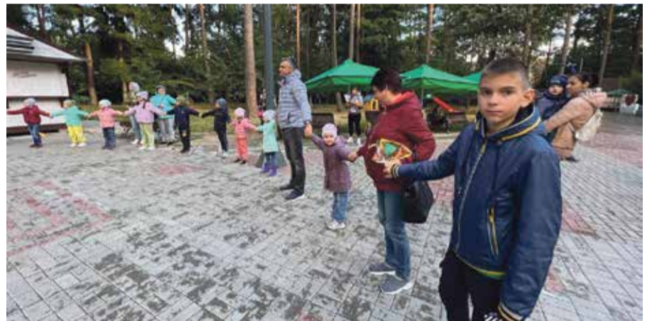
■ На праздник пришло много ребят

— Прекрасное времяпровождение в выходной день. Часто не получается куда-то поехать с ребенком, как-то его развлечь, а тут такой сюрприз — праздник прямо рядом с домом, — высказалась другая родительница.