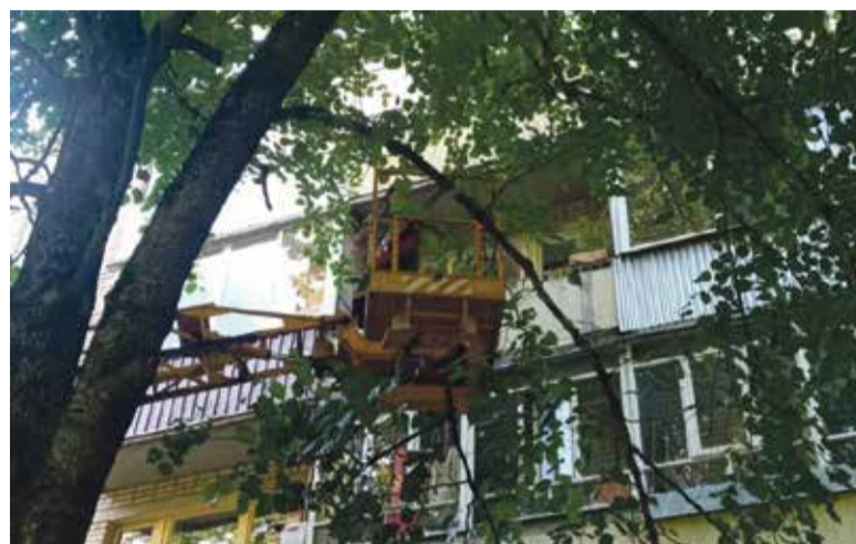
■ Опилка деревьев силами УК «Чип»

Прошло почти полгода с момента скандальной истории о прекращении деятельности по управлению обнинскими домами УК «ЖКУ». Жильцы этих жилых зданий выбрали новые управляющие организации. В том числе 9 домов в апреле и в мае перешли в УК «Чип». Сейчас их жители рассказывают, что ситуация с обслуживанием изменилась кардинально.