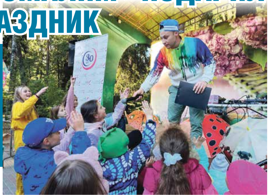
■ Ребята проявляли активность

Другие родители тоже высказывали руководству клиники благодарность.