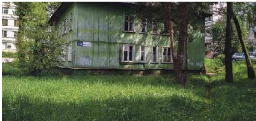
■ Жителям этой брусчатки повезло

К сожалению, на очередников подобная программа не распространяется. А было бы неплохо.