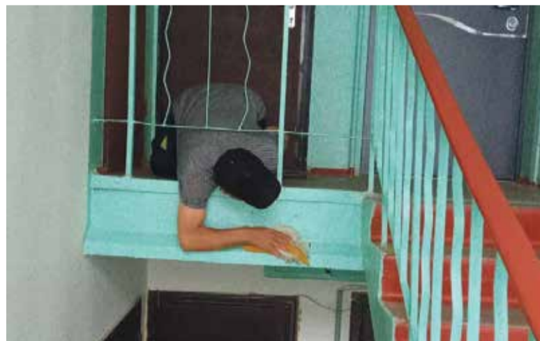
■ Проводится генеральная уборка в подъезде одного из домов УК «Чип»

УК «Чип» полностью обследовали наш дом, чего не было в старой компании. Видно, что они подходят к своей работе честно и ответственно. Наш дом очень запущен, он старый — ему 60 с лишним лет. И поэтому нас очень беспокоило, как нас будут обслуживать после нашего ухода из УК «ЖКУ». Теперь видим, что нам очень повезло.