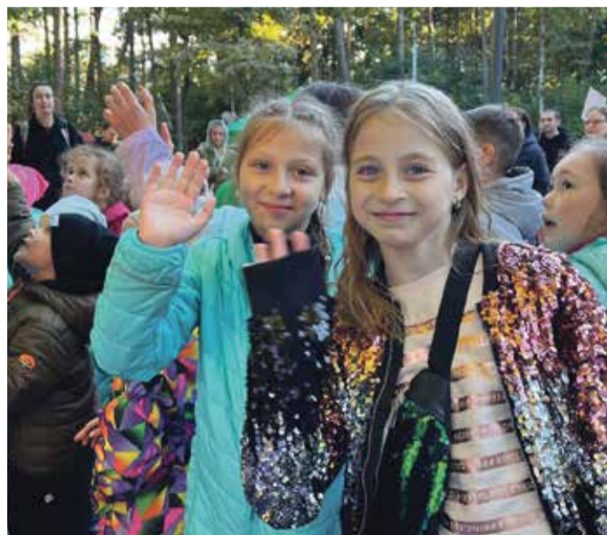
■ Праздник удался