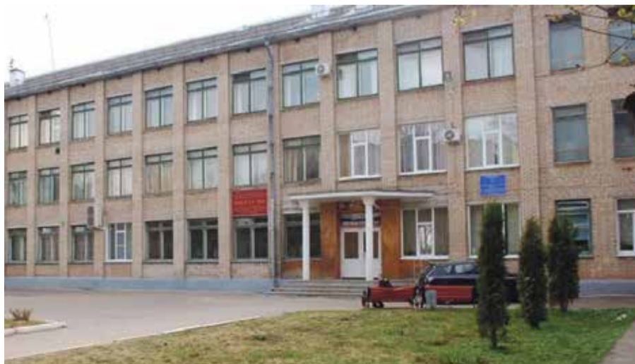
Обнинская школа № 4

Напомним, что утром 26 сентября на регулируемой «зебре» по пр. Маркса под колеса иномарки попала 64-летняя женщина. Ее госпитализировали.