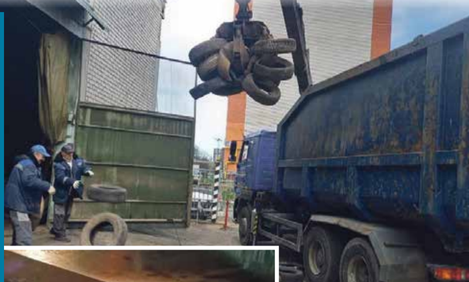
■ МП УЖКХ утилизирует покрывки

— От «ЖКУ» жилые здания перешли в плохом состоянии. Там мы проводили