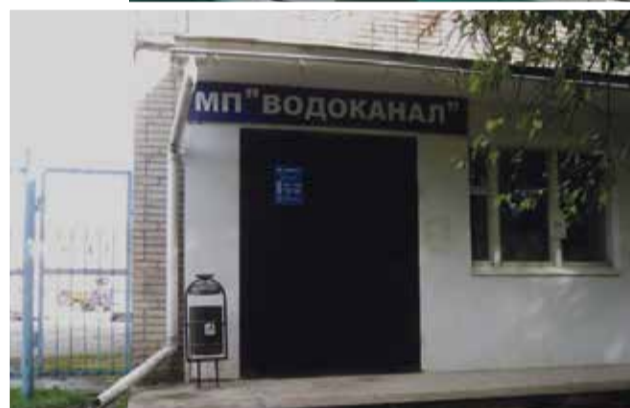
■ МП Водоканал города Обнинска

ведения. Узнать о своей задолженности можно по телефонам: 8 (48439) 9–79–18, 8 (48439) 2–20–97 или по адресу: город Обнинск, Пионерский проезд, дом 6, отдел сбыта.