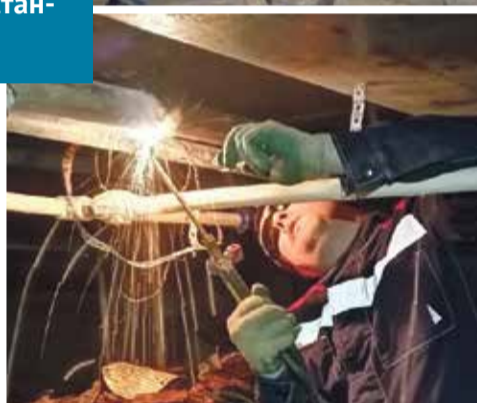
■ Работа электрика — дело тонкое