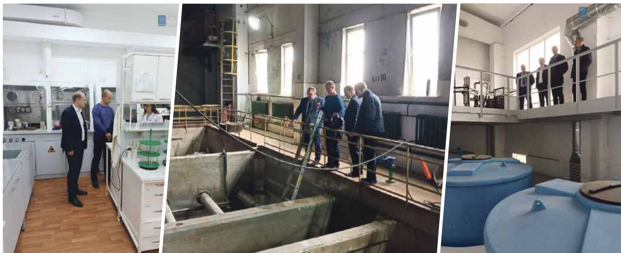
■ Обнинские депутаты отметили работу коммунальных сетей в Глазове и подчеркнули, что инвестиции буквально спасли город от перебоев с водой и теплом.

Почему эта поездка была нужна депутатам из Обнинска? Все просто. В городе большая проблема с очистными, и созданная рабочая группа изучает лучшие практики других городов и ищет пути решения сложившейся ситуации. Но сегодня все прекрасно понимают, что местный «Водоканал» — предприятие непрофицитное, а тариф у него самый низкий в стране. К слову, это одна из причин плачевного состояния сетей. Когда нет денег на ремонт и модернизацию, логично, что все разрушается. Сейчас у города свободных средств на реконструкцию очистных нет. И рассчитывать на инфраструктурный кредит тоже не приходится, так как Обнинск уже взял на себя обязательство реализовать большой объем за-