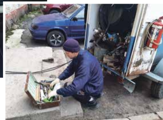
■ Сварочный пост аварийной службы МП УЖКХ задействован ежедневно