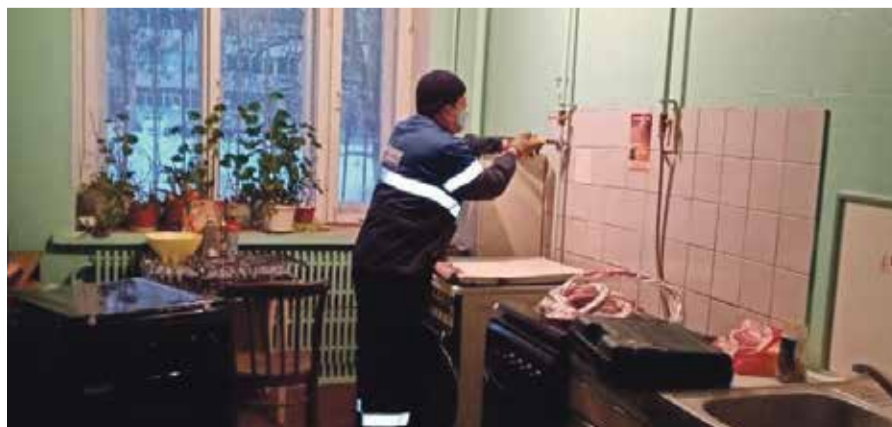
■ В бывших общежитиях Обнинска МУК меняет старые плиты

На собираемость влияет ряд факторов. В том числе сезонность. В летние месяцы, когда сумма платежа из-за отсутствия строки «отопление» меньше, жители платят активнее. В зимние — соответственно накапливают долги. И еще немаловажно, насколько добросовестно работает управляющая компания. Если жильцы видят, что работники ЖКХ действительно что-то делают, то у большинства из них не возникает желание игнорировать платежи. А если УК делает вид, что управляет домами, то и граждане делают вид, что платят. Так считает директор МП «УЖКХ». А его коллегам стоит к этому прислушаться.