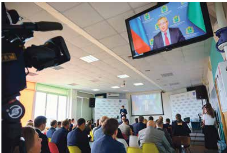
■ Губернатор Калужской области Владислав Шапша

Исполняющий директор ИАТЭ НИЯУ МИФИ Алексей Панов сообщил, что данный центр нужен Обнинску и всему калужскому региону.