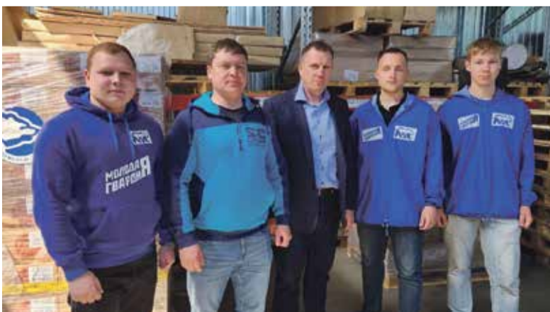
■ в День России из Калуги была отправлена первая партия гуманитарного груза жителям Белгородской области