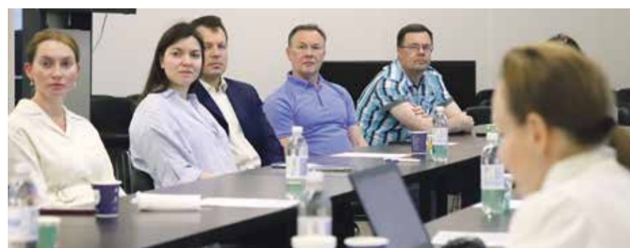
■ Общее собрание Ассоциации «Калужский фармацевтический кластер»

производству изотопной продукции медицинского назначения по стандартам GMP. Основой производства станет выпуск как готовых фармацевтических препаратов, так и изотопов для радионуклидной диагностики и лечения онкозаболеваний. Предполагается, что в этом году будут осуществлены основные строительные работы, в 2024 г. закончится оснащение завода технологическим оборудованием, а уже с 2025-го года эта структура «Росатома» начнет выпускать свою продукцию. Все приведенные выше цифры должны производить сильное впечатление еще и по той причине, что долгое время фармацевтическая отрасль в России на-