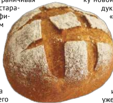
■ Хлеб Княжеский

Батон «Престиж» изготавливают из муки высшего сорта и ржаной, но в его составе имеется обжаренная солодовая мука, а также кориандр, пшеничные отруби и ячменный солодовый экстракт. Технологи предприятия потратили не один месяц для того, чтобы с помощью целого ряда компонентов создать этот неповторимый хлеб. Хотя и старые проверенные рецепты