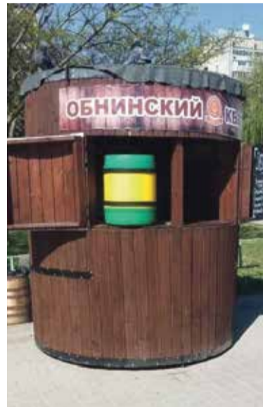
■ Под брендом «Мистер Хлебсон»

Продукция этого предприятия разнообразна. Многие любят торты, пирожные и печенья обнинского хлебокомбината. Но все-таки хлеб остается главным продуктом, за которым приходят большинство покупателей. Ароматные, хрустящие черные буханки и белые румяные батоны раскупают моментально. Так, что их приходится подвозить повторно. Казалось бы, можно