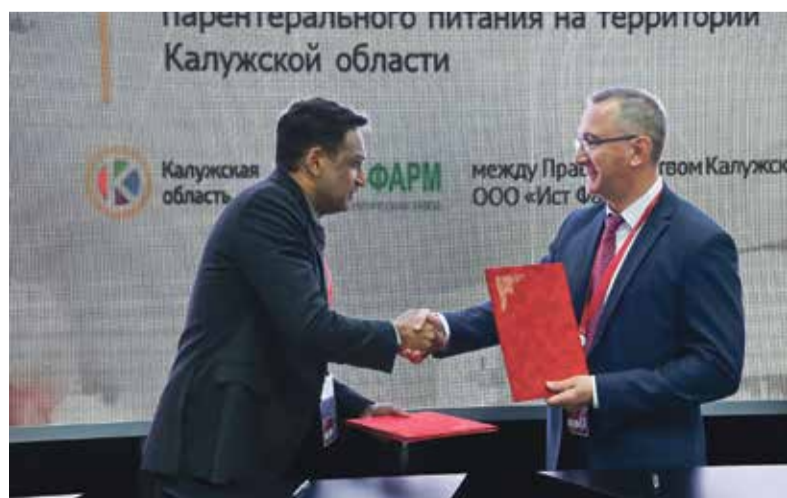
■ Подписание соглашения о строительстве в Калужской области фармацевтического завода по производству парентерального питания, которое вводится внутривенно, если пациент не в состоянии самостоятельно принимать пищу