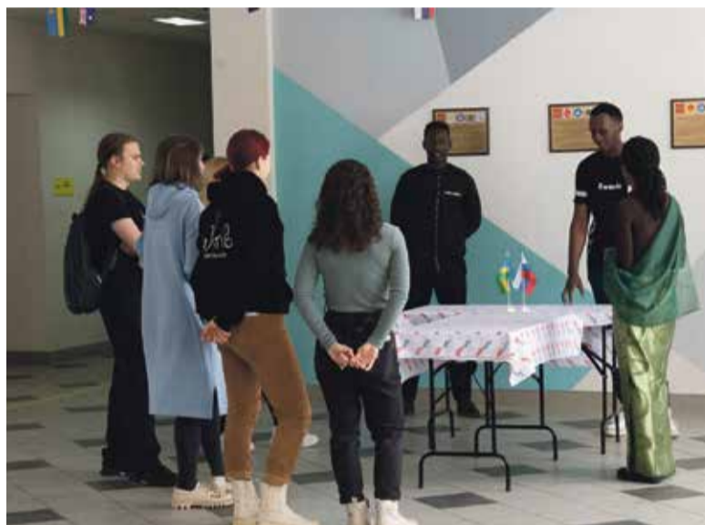
■ Иностранные студенты

Подготовка квалифицированных специалистов по программе бакалавриата «Нanomатериалы для биологии и медицины», которые владеют глубокими знаниями химических, физических, механических и фармацевтических свойств веществ, позволит выпускникам эффективно решать задачи создания новых наноматериалов для биологии и медицины и современных оригинальных лекарственных средств на предприятиях Калуж-