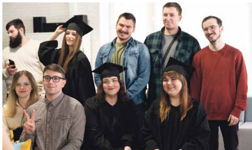
■ Уже молодые специалисты

Значительная часть выпускников, после окончания обучения, продолжают обучение по специальностям ординатуры в различных медицинских ВУЗах и научных центрах страны. Около четверти выпускников трудоустраиваются в первичное звено здравоохранения в медицинские учреждения ФМБА России, Калужской области, Московской области и других регионов Российской Федерации.