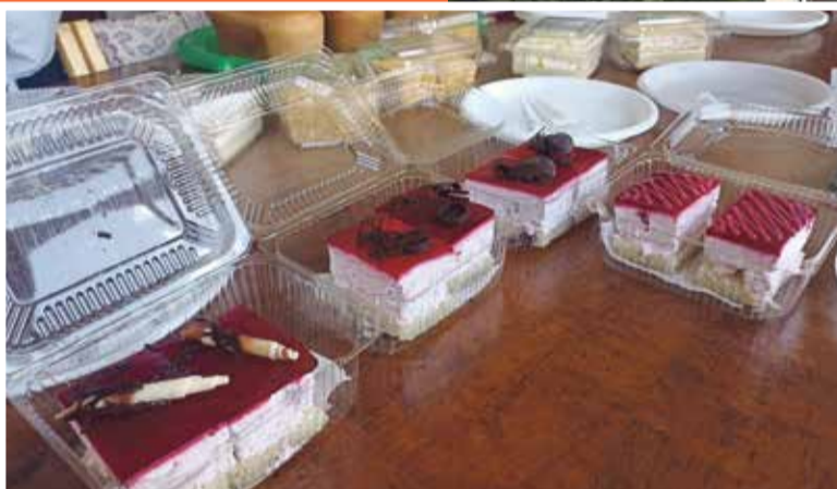
■ Пирожные с суфле

было ими и ограничиться, ведь товар и так пользуется спросом. Однако технологи и пекари предприятия ежедневно трудятся над созданием новых рецептов, направленных на то, чтобы люди становились здоровее. Как ни крути, а хлеб мы употребляем ежедневно — и на завтрак, и на обед, и на ужин. И даже перекусы не обходятся без какой-либо булочки. Так уж мы устроены.