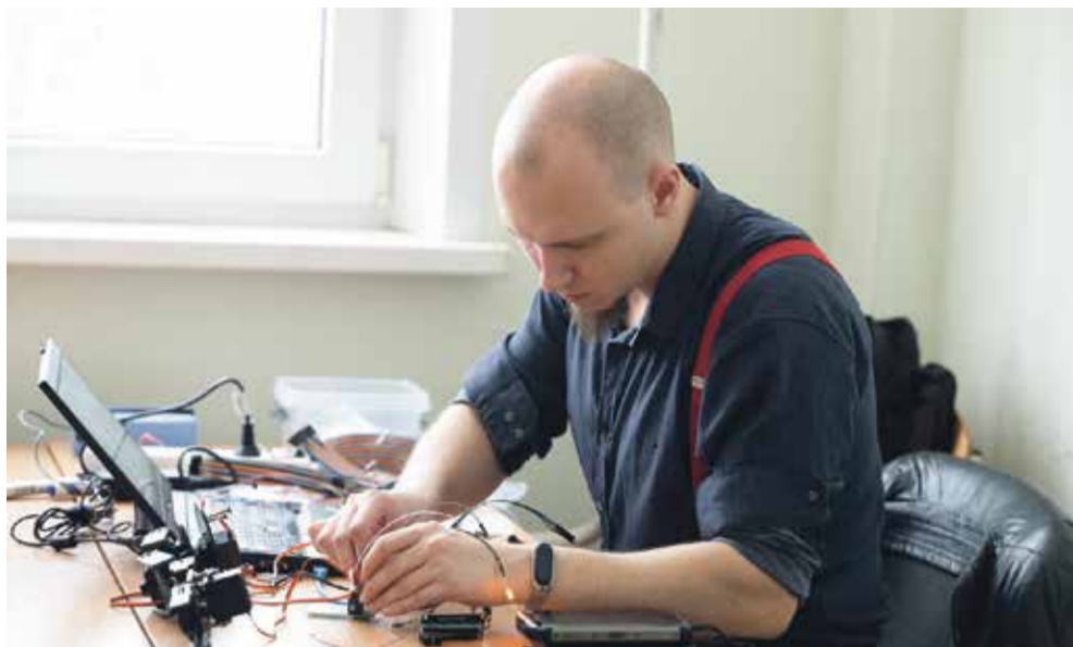
■ Один из будущих специалистов, о которых говорят, что они на вес золота