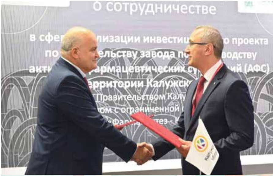
■ Калужский фармкластер – на страже суверенитета России

Помимо «Фармасинтеза» на территории области будут реализовывать свои проекты еще пять компаний: ООО «Медтех Протект», ООО «Биофарм-К», «Астрафарм Калуга» и ООО «Б-фарм биотех». Тот же «Медтех Протект» будет производить шприцы третьего поколения – одноразовые и саморазрушающиеся (невозможно использовать повторно). В производственный комплекс будет вложено 1,5 млрд. рублей, ожидается создание 135 рабочих мест. «Биофарм-К» запустит предприятия по производству солей гепарина. Стоимость проекта: 1,7 млрд. рублей. ООО «Б-фарм биотех» намерены вложиться в завод по изготовлению жидких и твердых лекарственных форм для медицинского применения. Объем инвестиций составит 3,5 млрд. рублей.