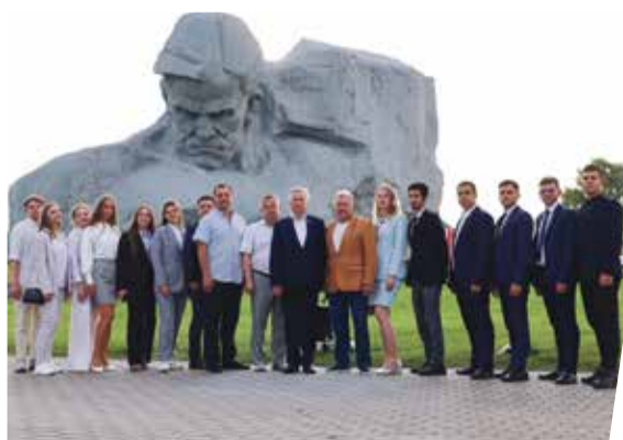
■ 22 июня молодёжный парламент Калужской области побывал в Бресте