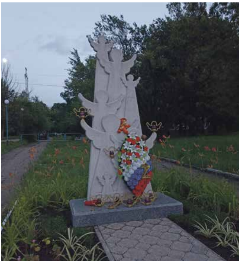
■ Памятник погибшим детям

Например, здесь есть памятник Феликсу Эдмундовичу Дзержинскому. Интересно, где-то в России ещё уцелел такой памятник со времен СССР?