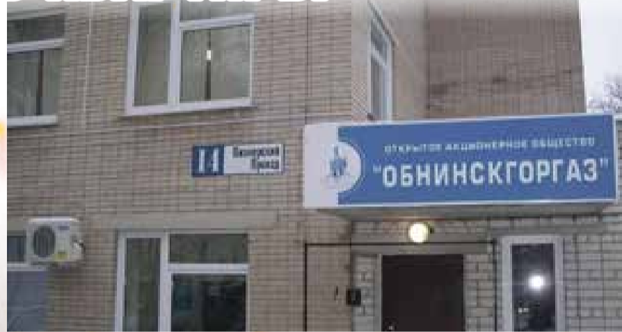
■ Офис ОАО «Обнинскоргаз»

оборудования. Для граждан штраф за это составит до 10 тысяч рублей.