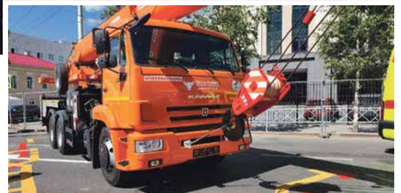
На выставке была представлена техника российских и белорусских производителей

→ более 200 тысяч кв. метров жилья; → детские сады и школы на 8 000 мест.