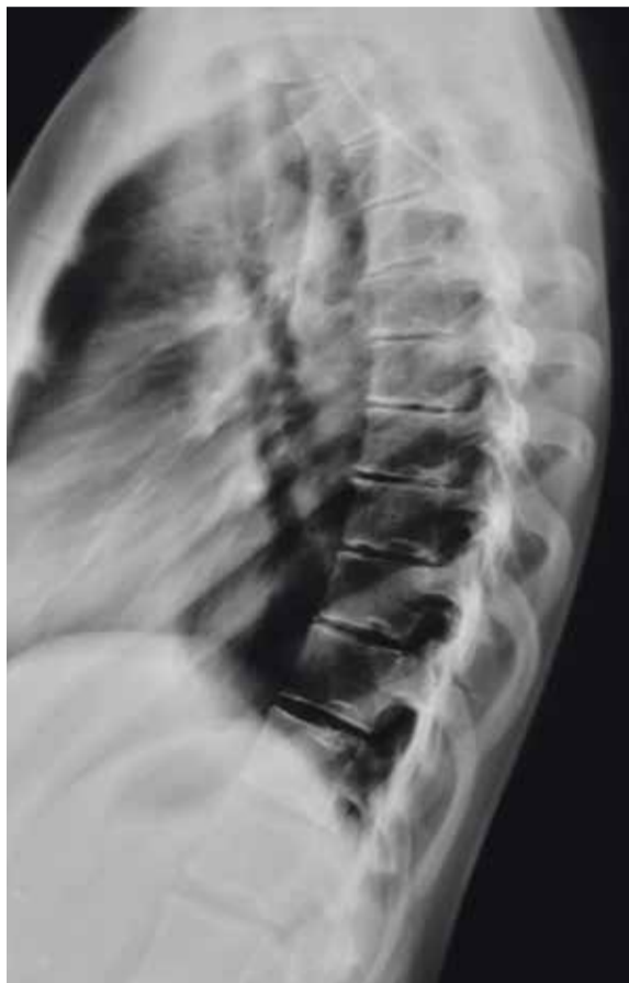
■ Рентгенограмма грудного отдела позвоночника в боковой проекции. Множественные грыжи Шморля (в Th6-Th12).

Причины возникновения и прогрессирования грыжи Шморля в настоящее время точно не установлены. Узлы могут сопровождать любой болезненный процесс,