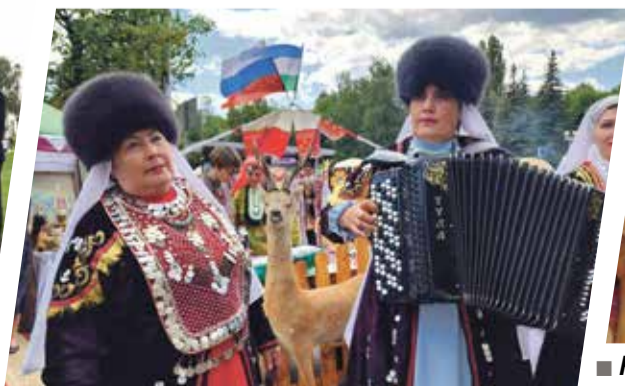
■ На улице Дружбы прошел фестиваль этнических культур