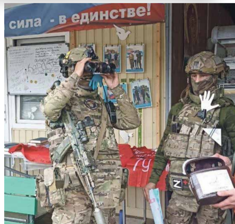
■ Бинокль нашел своего нового хозяина

На Солдатском Привале обнинские волонтеры получили задание от Лены Русалки — доставить в Луганск для воинов, сражающихся