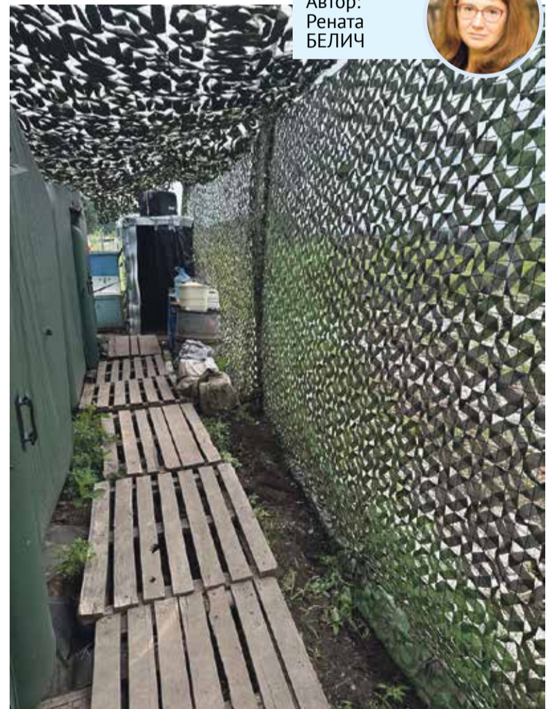
■ Маскировочные сети в действии