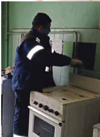
■ Газовики приходят к жителям с важной целью — проверить оборудование

Штрафы для граждан, которые сейчас составляют от 1 до 2 тысяч рублей, предлагается увеличить до 5–10 тысяч. Для должностных лиц — до 100 тысяч рублей, для юридических — до 500 тысяч. Обещают, что наказание последует и за уклонение от заключения договора о техническом обслуживании и ремонте газового