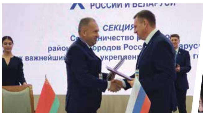
■ Подписание плана мероприятий по реализации ранее заключенного соглашения о сотрудничестве с Брестским областным Советом депутатов