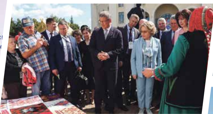
■ Валентина Матвиенко, Наталья Кочанова и Глава Республики Башкортостан Радий Хабиров открыли выставку достижений народного хозяйства России и Беларуси.