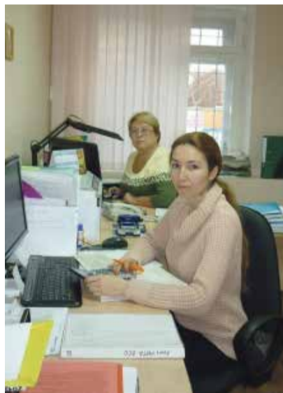
■ Специалисты центра социального обслуживания пожилых граждан и инвалидов