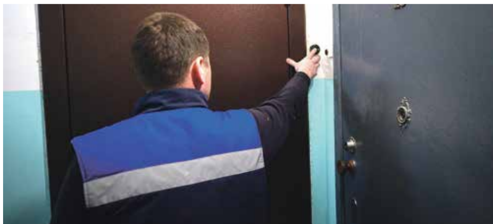
■ Газовики приходят к жителям с важной целью — проверить оборудование

— Редко, но я не считаю это важным. Главными в нашей работе являются два принципа: безопасность и бесперебойность. Есть такая поговорка: делай добро и бросай в реку.