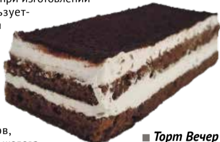
■ Торт Вечер