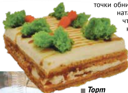
■ Торт Морковный

К примеру, «Лакомка» — это шоколадный бисквит со взбитыми сливками, с кусочками