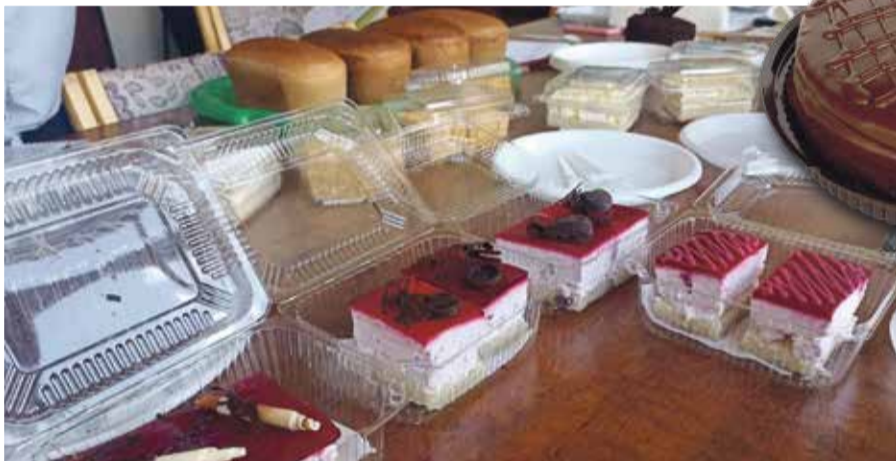
■ Пирожные с суфле