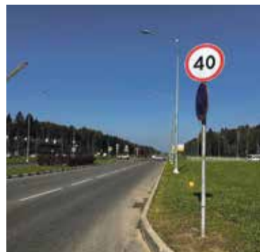
■ На этом месте будет установлен светофор

Уголовное дело находится на контроле прокуратуры.