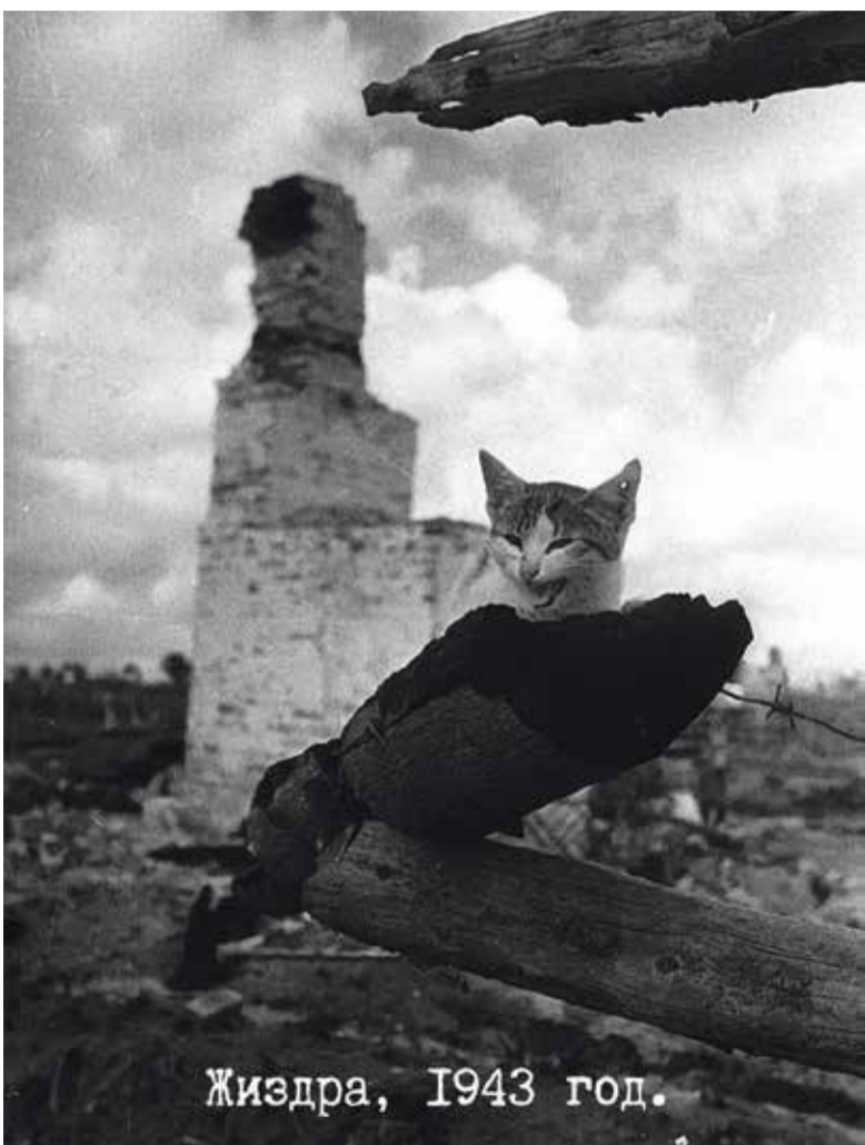
Жиздра, 1943 год.