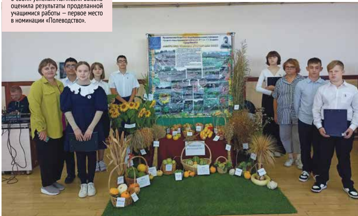
■ Обнинск стал первым в номинации «Полеводство»

– Недавно школа № 18 вышла на строительное предприятие. Там же открываются профильные медицинские и инженерный классы. Медицинское направление помогает реализовывать МРНЦ. Очень интересно взаимодействие с нашей станцией скорой помощи и экскурсии в частные клиники. Школа № 4 очень плотно взаимо-