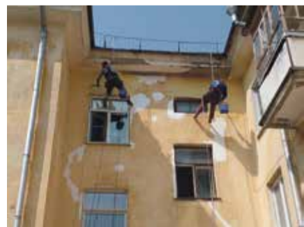
■ Ремонт фасада одного из домов

С домами «Комфорта» история вообще темная. Эта компания не проводила там практически вообще никаких работ и поэтому жильцы попросту перестали платить за ремонт и содержание жилья. Сотрудникам УК «Обнинск» пришлось доказывать им, что не все компании столь безответственны и что бывает по-другому.