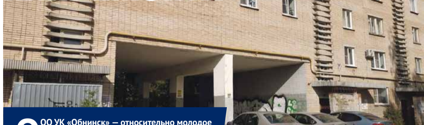
■ Дом № 11 по улице Энгельса