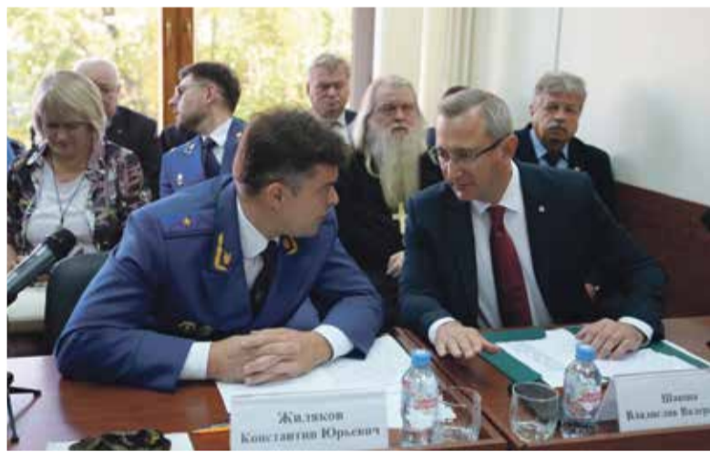
■ Губернатор Владислав ШАПША на процессе

В случае удовлетворения требований прокуратуры будет зафиксирован юридический факт, который позволит использовать дополнительные правовые механизмы по защите исторической правды.