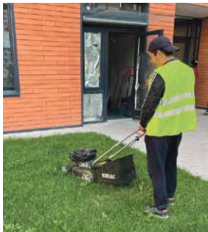
■ Во дворе, который обслуживает АО «Быт-Сервис», всегда аккуратно подстрижены газоны

Понятное дело, что люди всегда недовольны таким решением, но ведь от объективной реальности никуда не уйти. Все мы понимаем, что и расходные материалы, и топливо дорожают. Да и сотрудники УК хотят получать достойную зарплату. И если какая-то конкретная работа стоит, к примеру, 500 рублей, то за 100 ее