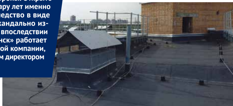
■ Благодаря УК Обнинск в 12 домах был проведен капремонт. В том числе ремонтировали и кровли

Там уже сделано очень много: заменили и отремонтировали инженерные коммуникации, привели в порядок подъезды,