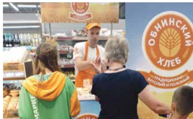
■ Дегустация продукции обнинского хлебокомбината в Калуге