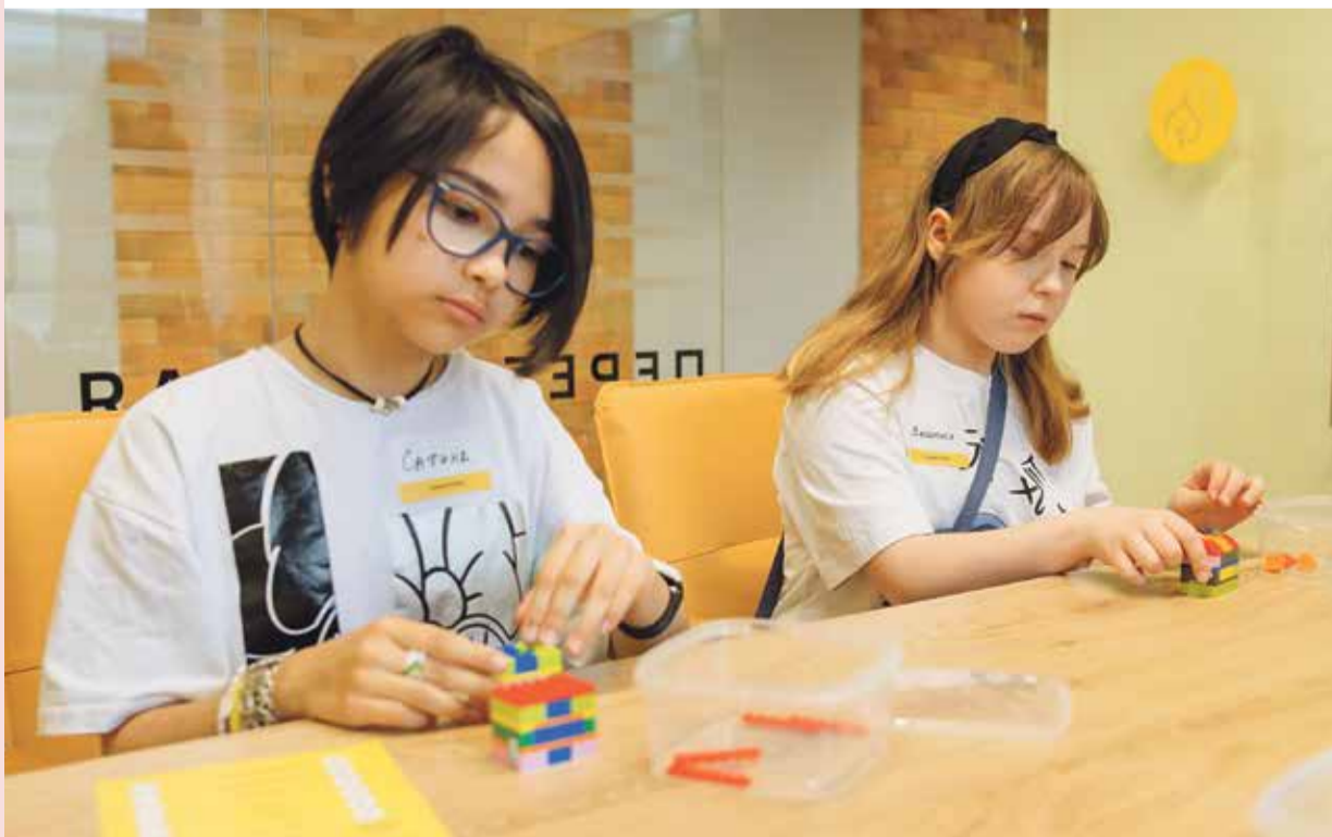
Путешествие по строительным станциям

В конце мероприятия участники получили именные грамоты, подарки от компании и самое главное — положительные эмоции и знания.