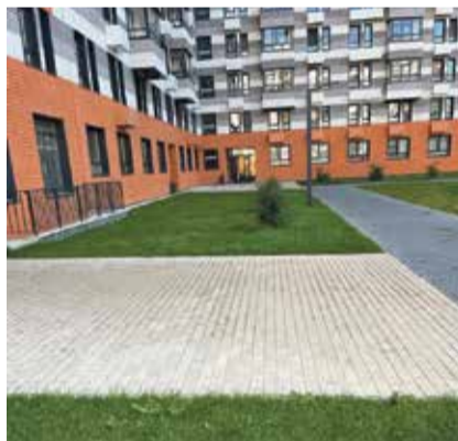
■ Придомовая территория — чистота и красота

Аналогичная ситуация и по другим домам. Так, в ремонтные работы по дому № 49 на проспекте Маркса УК уже вложила 1 миллион рублей, а собираемость дома — 700–750 тысяч в год. И это пока не все затраты на ближайшее время — там предстоят также недешевые кровельные работы.