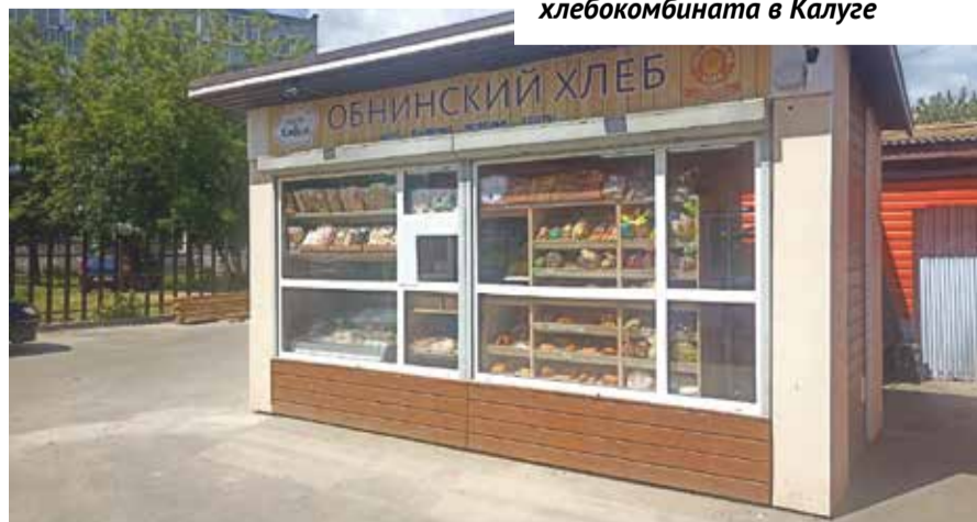
■ Новый магазин обнинского хлебокомбината в Ермолине