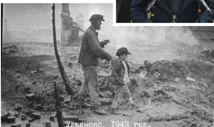
Ульяново, 1943 год.