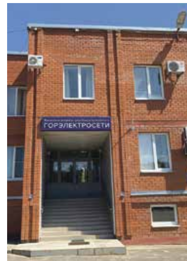
■ Офис МП Горэлектросети

Именно по этой программе на фасаде дома № 9 по улице Победы установлено 4 светильника Galad Победа 60 Вт. Сейчас готовимся сделать освещение еще на трёх жилых домах.