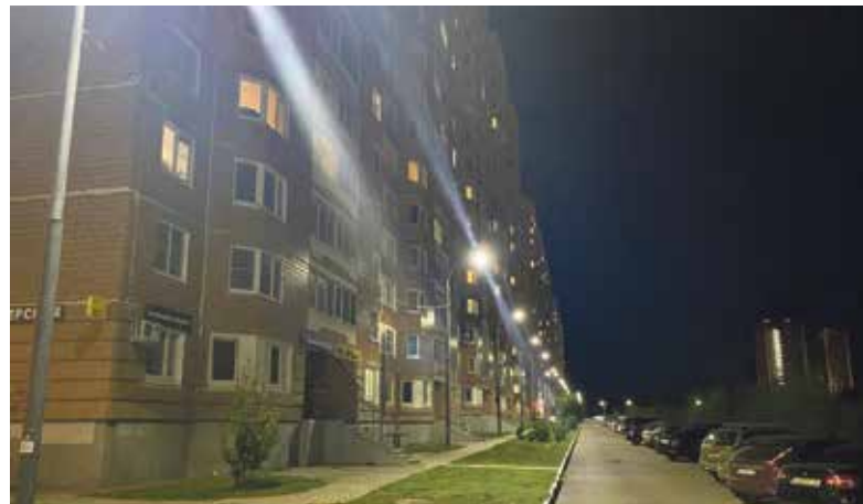
■ Сделано освещение проезда вдоль домов по ул. Поленова, 2, 4, 6. Установлено 20 светодиодных светильников. Работы выполнены за средства ТОС.

На сегодняшний день на предприятии работают 132 человека, среди которых большинство — опытные сотрудники. Профессия электрика непростая, требует хорошей подготовки. И благодаря компетентности и ответственности специалистов МП «Горэлектросети» жители города могут быть спокойны: если на каком-то участке погас свет — это ненадолго.