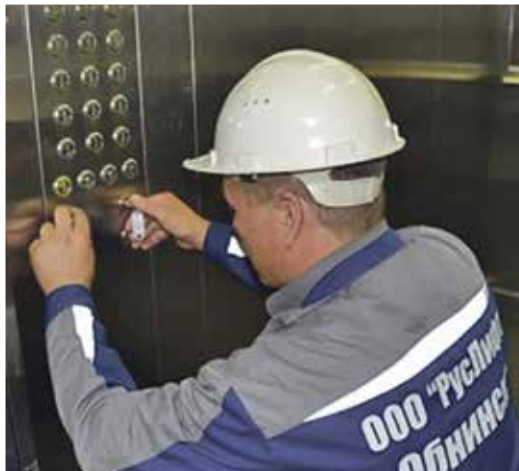
■ Обслуживание лифта

Допустим, в конкретном доме сломался лифт, а у жильцов имеют-