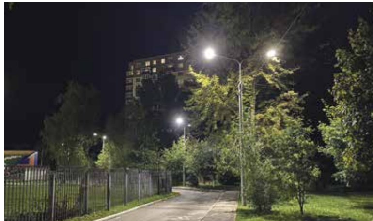
■ Возле дома № 15 по улице Шацкого стало светло