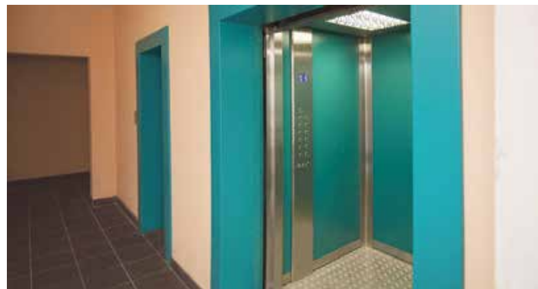
■ в Обнинске за время работы программы капремонта заменили около 450 лифтов

— При поломке лифта жители сообщают либо нам, в диспетчерскую службу, либо на прямую линию в ООО «РусЛифт-Обнинск». В каждом лифте есть объявление с телефонами, по которым необхо-