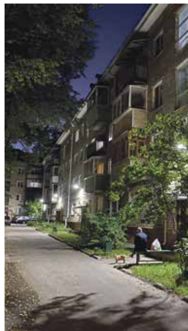
■ Фонари рядом с домом 9 на улице Победы

городе — на улицах Мигунова, Блохинцева, Лермонова; в 51-м микрорайоне — на проспекте Ленина в районе СК «Олимп», на улице Белкинской. На старых участках сети не менялись почти 50 лет, на новых — с момента застройки. На той же Белкинской сети функционируют с момента застройки 51 микрорайона — более 30 лет. Конечно, необходимы средства на их реконструкцию.