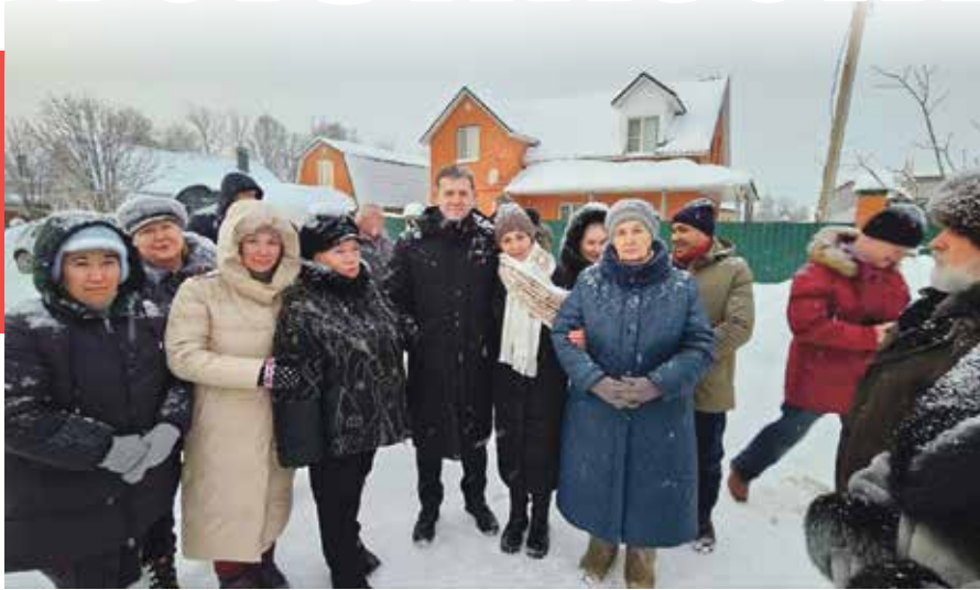
■ Министр сельского хозяйства Александр Ефремов встретился с жителями Кондрово, страдающими от «грибного» предприятия

Но при этом мы видим, что нарушение экологических норм налицо. В течение нескольких лет жители Кондрово страдают от неприятных запахов – это объективная реальность.