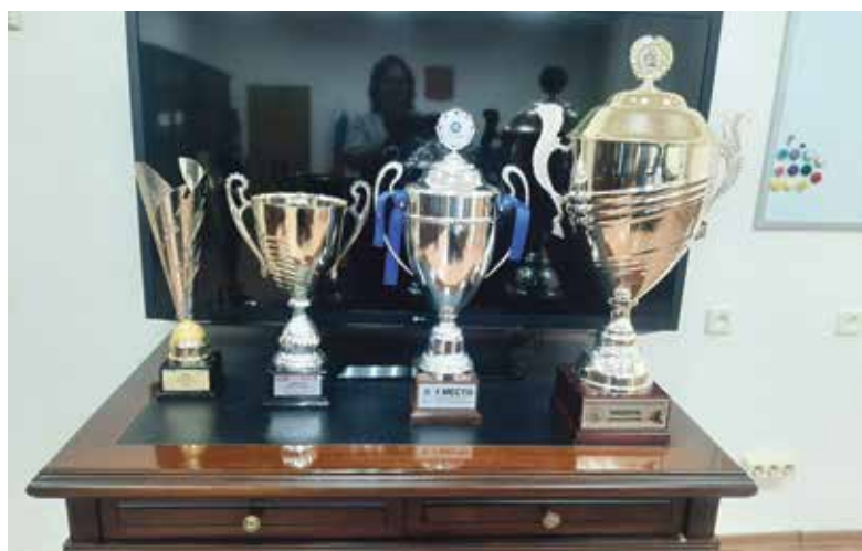
■ Кубки, которые были вручены студентам ИАТЭ НИЯУ МИФИ за спортивные достижения