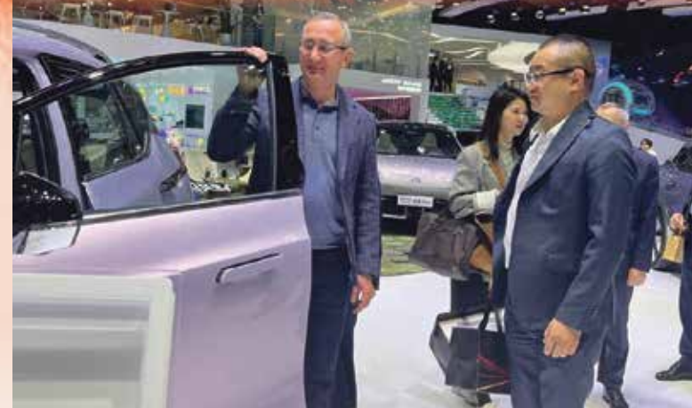
■ Владислав Шапша на выставке в Китае

торый смог продемонстрировать деловую хватку с европейцами. Немцы максимально долго не уходили из региона, попутно оплачивая все социальные обязательства и не распродавая производств. Что на самом деле впечатляет».