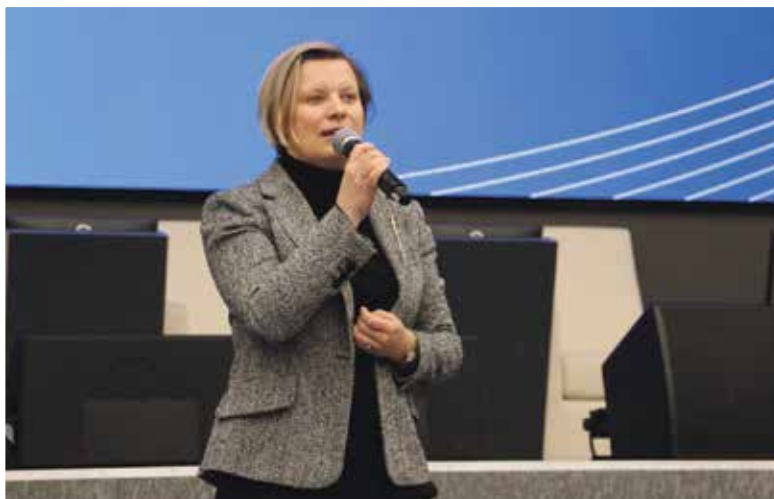
■ Тем временем власти активно работают над стратегией развития до 2040 года и продлением статуса наукограда

До 30 ноября 2023 г. наукограды попадали в них нерегулярно и выборочно. Фактически действовала лотерея — попадут не попадут. Теперь же мы можем быть уверены в том, что в 2024 г. Обнинску (первому наукограду страны, если кто запомнит!) должны гарантировано добавить федерального финансирования на обеспечение комфортной городской среды, обновление коммунальных сетей и строительство жилья.