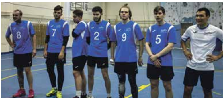
■ Спортивный студенческий клуб «Атомные пантеры»

В этом учебном году уже около 800 студентов института подали заявки на участие в различных олимпиадах «Я профессионал». Жизнь в ИАТЭ НИЯУ МИФИ кипит. Остается только приятно удивляться тому, как эти талантливые физики, биологи, химики, медики еще и успевают заниматься спортом, петь и танцевать. Но успевают и при этом делают успехи. А еще они и их преподаватели попросили от всего института поздравить жителей Обнинска с наступающим Новым годом и пожелать им мира, счастья, любви, здоровья и ярких событий в 2024 году.