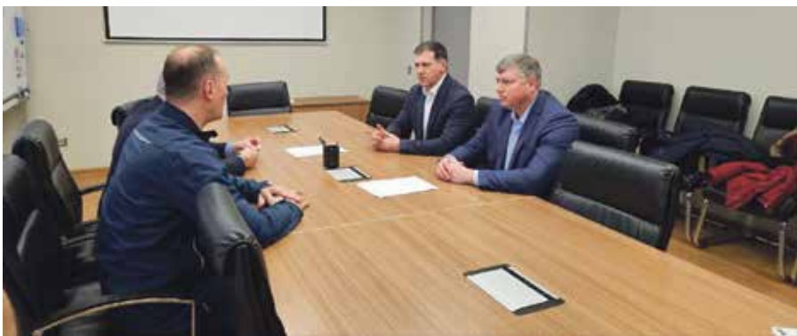
■ Вместе с руководством предприятия обсудили все способы решения проблемы. Точка еще не поставлена

Напомним, что нападение собаки произошло 9 ноября и попало на видео с камеры наблюдения. Девочку спас водитель такси. Ребенок получил серьезные ранения.