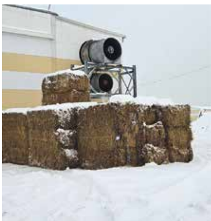
■ Вот он - источник неприятных запахов

Встретились с руководством и инженерным составом предприятия, посмотрели процесс производства субстрата – именно от него исходит неприятный запах. Визуально нам кажется, что