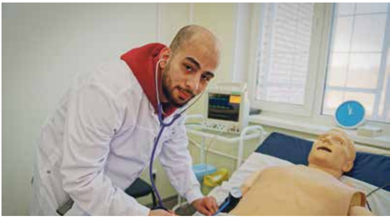
■ Начинающий врач

Ещё одним направлением профориентации школьников является работа с кадетскими классами. Это большой совместный проект НИЯУ МИФИ с Министерством обороны РФ, в котором ИАТЭ НИЯУ МИФИ занимает одну из ведущих ролей. Так, в январе и в октябре текущего года в ИАТЭ НИЯУ МИФИ состоялись два больших Всероссийских фестиваля кадетского движения. Осенью прошел финальный конкурс «Юные таланты Отчизны», на котором вуз собрал кадетов со всей страны.