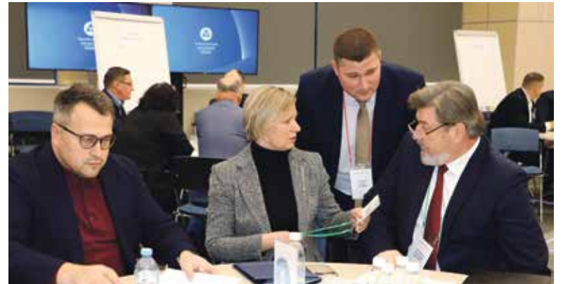
■ Стратегическая сессия прошла в формате круглых столов

родским сообществом, на которой обсуждался соответствующий вопрос. А к 1 февраля 2024 г. ответственные чиновники должны представить проект Концепции о дальнейшем развитии Обнинска как наукограда.