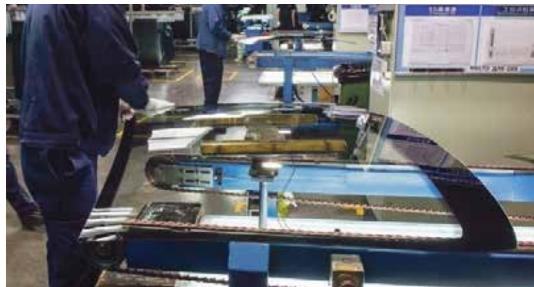
■ В Калужской области успешно работает китайское производство

ничества с иностранными инвесторами. Только европейские автоконцерны в новой санкционной реальности не нашли себе места и ушли из региона. Теперь Калужская область стремительно перестраивается на рельсы китайского инвестиционного капитала».