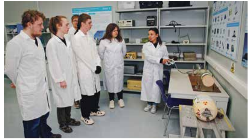
■ Студенты с преподавателем