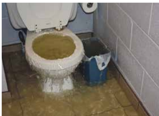
■ Вот к чему может привести безалаберность жильцов, которые используют унитазы вместо мусорного ведра

Обиднее всего в такой ситуации, что и виновников удается найти лишь в редчайших случаях. Ведь весь выброшенный в канализацию мусор попадает в общую систему,