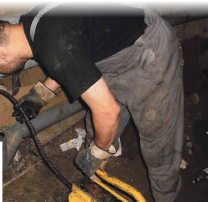
■ Прочистка канализационной системы дело не простое

Нередко бывает, что протекает стояк канализации на одном из этажей, и чтобы устранить поломку, нужен доступ в квартиру этажом выше или ниже. Но далеко не всегда собственники готовы впустить к себе сотрудников УК. Особенно, если они недавно сделали в туалете ремонт. Приходится подолгу уговаривать людей, а если не удается это сделать, то сантехникам остается искать другие, более сложные и витиеватые способы устранения аварии.