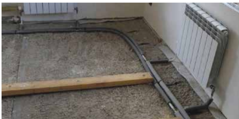
■ Утеплять полы в квартире за счет системы отопления категорически нельзя

Другая проблема — это нежелание жителей сотрудничать с управляющей компанией. Даже если они ее когда-то выбрали и поставили свои подписи в протоколе общего собрания, это вовсе не значит, что они готовы с ней взаимодействовать в тех или иных вопросах.