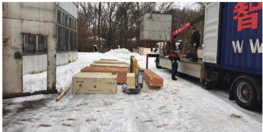
■ Лифтовое оборудование из Китая уже в наукограде

Для жителей сегодня главное — сделать правильный выбор, чтобы приблизить сроки замены лифтов. Ведь ждать своей очереди капремонта часто приходится годами.