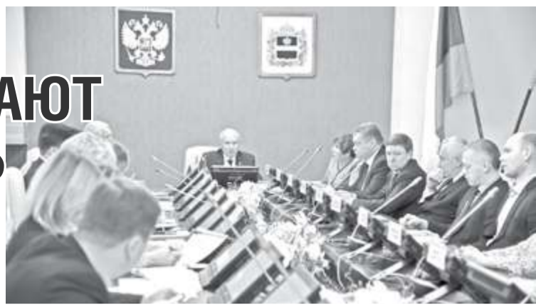
Акция состоится по инициативе партии «ЕДИНАЯ РОССИЯ» 24 апреля текущего года.

– Мы имеем хороший опыт проведения исторических диктантов. Когда молодые люди выполняют задания, они проверяют свои знания, думают, размышляют, что очень важно. Главная задача таких мероприятий – закрепление исторической памяти, – пояснил председатель Законодательного собрания области, секретарь регионального политсовета