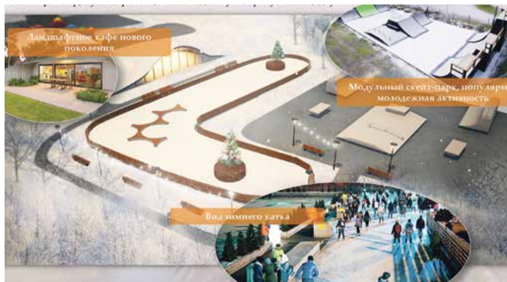
► Боровск. Парк «Виразж».