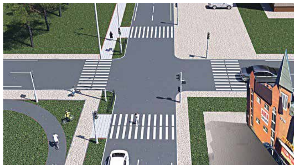
► Балабаново. Дорога от Гагаринского поля к Балабаново-1.