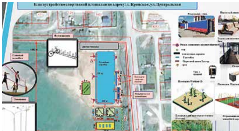
► Кривское. Каток