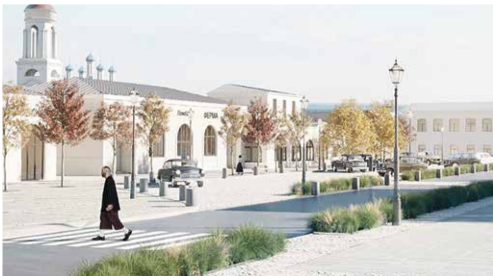
► Боровск. «Каштановая аллея».

Чтобы отдать свой голос за один из вариантов вам необходимо будет авторизоваться под своей записью на «Госуслугах» или пройти быструю регистрацию на сайте проекта указав ваши фамилию, имя, отчество, дату рождения, место проживания, адрес электронной почты и номер телефона, после чего придет смс с кодом подтверждения. После этого останется лишь сделать свой выбор, но помните — каждый участник