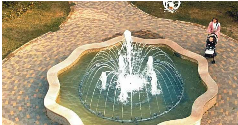
► Ермолино. Фонтан в центре города.

может проголосовать лишь за одну территорию и после этого на e-mail должно прийти сообщение о том, что голос был учтен. Единственное ограничение — для принятия участия гражданину уже должно исполниться как минимум 14 лет.