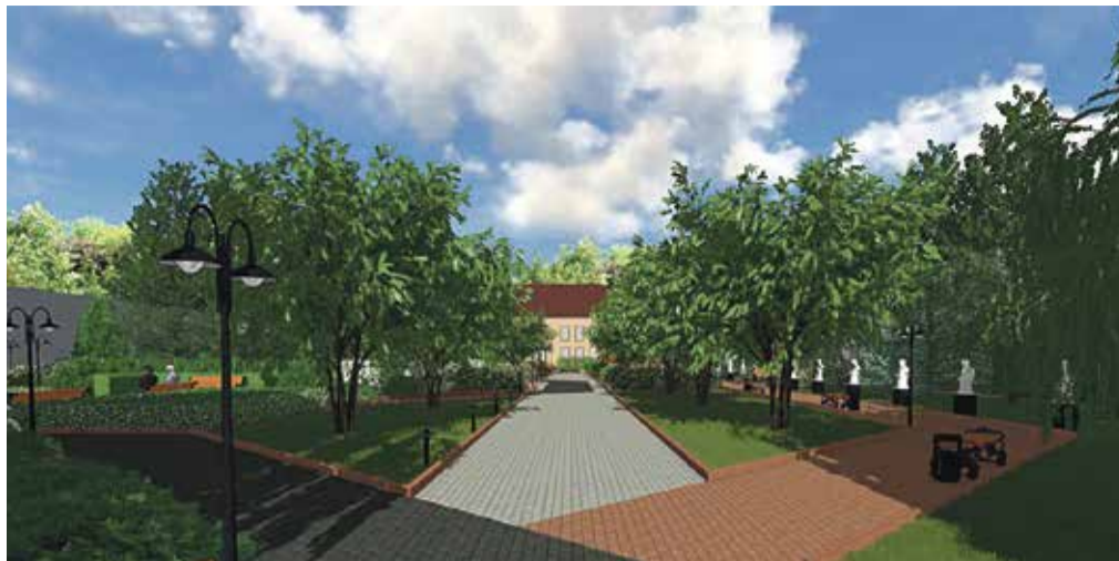
► Ермолино. Центральный парк.