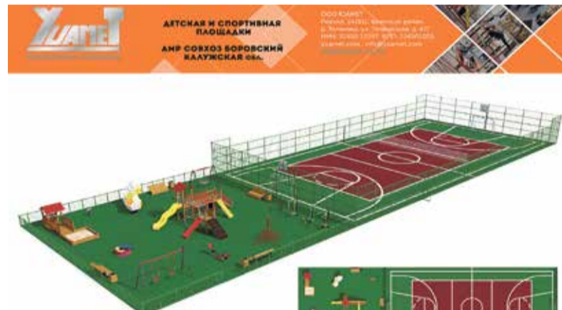
► Совхоз Боровский. Спортивная и детская площадки.