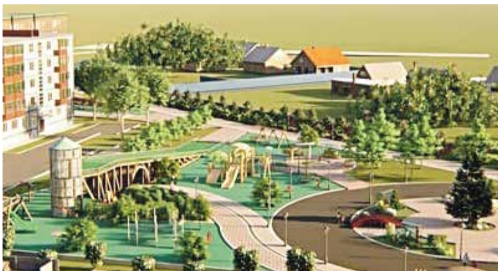
► Балабаново. Парк «Лесогорье».