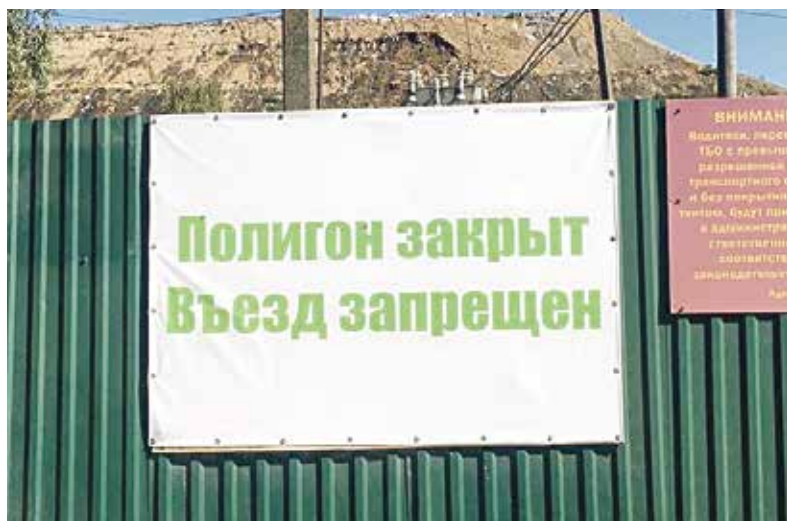
▶ Закрытый полигон ТБО в Тимашёво

Тема создания нового места для приемки мусора главами наукограда и трех соседствующих районов прорабатывается, как минимум, с начала года. Во всяком случае, имен-