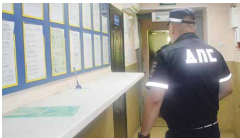
► В отделе работает 19 сотрудников, штат полностью укомплектован

— Служба у нас многогранная. Помимо патрулирования сотрудники ДПС также следят за тем, в каком состоянии дороги, все ли знаки заметны и так далее. Если видят какие-то дефекты, то передают информацию об этом инспектору дорожного надзора, который пишет предписания владельцу дороги устранить недочеты, а также принимает обращения от граждан по этим вопросам. Специалист технического надзора следит за автопарком предприятий. Отдельно человек занимается всеми бумагами по ДТП, начиная от справок и заканчивая запросами в медицинские организации, чтобы установить вред здоровью. Служба интересная, но непростая, а потому приятно видеть, что у личного состава «горят глаза» и настрой на работу есть.