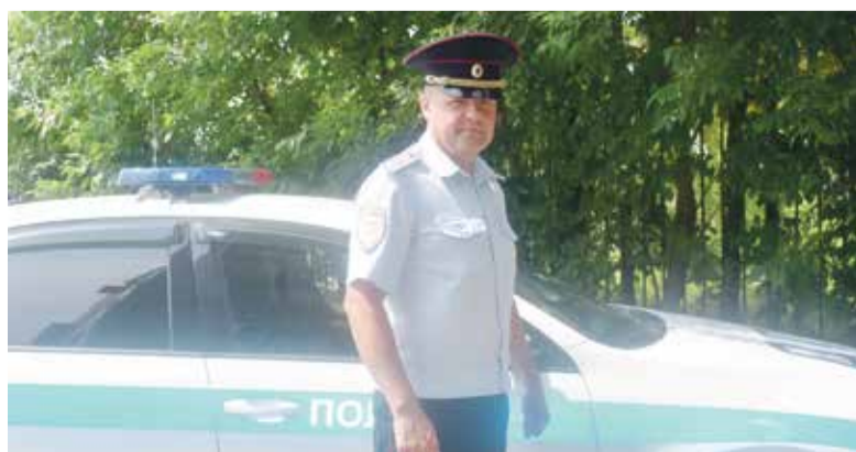
► У нас нет такого, что ты засиживаешься в кабинете.

? — Теперь жители будут знать, откуда у них берутся штрафы.