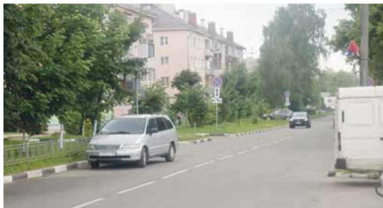
► В определенные дни у нас здесь проезжает машина ЦАФАП, которая автоматически проводит съемку всех припаркованных автомобилей и владельцам приходит штраф.

— Работа мне понравилась с первых дней. После того, как прошло обучение и вышел уже непосредственно «в поле», ты понимаешь насколько это интересно. Постоянно общаешься с людьми, помогаешь, делаешь добро, и это приносит очень сильный заряд для жизни. Я вообще считаю, что если ты своим делом не «горишь», то не нужно себя мучить, надо искать другой вид занятий, который будет по душе. А я до сих пор иду на службу как на праздник! Без шуток!