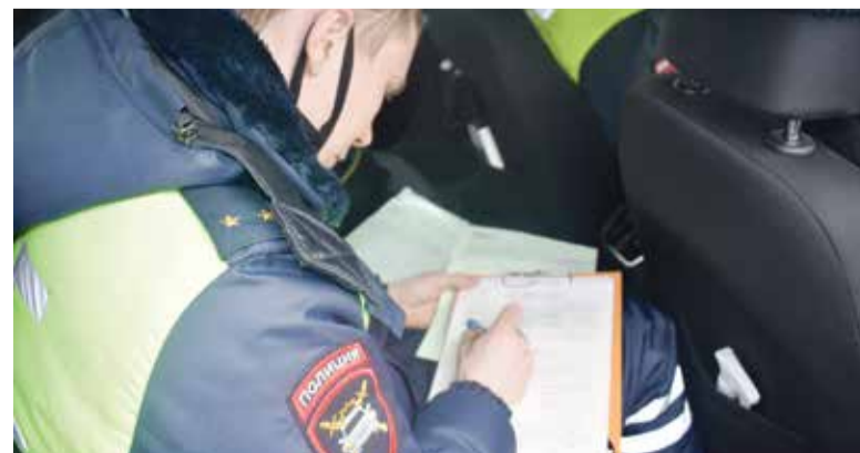
► Служба у нас интересная, но непростая...