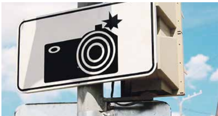
► Нам бы хотелось, чтобы камеры стояли вообще везде

? — По большей части мы сегодня говорим о службе ДПС, но ведь помимо этого направления в ГИБДД есть и другие?