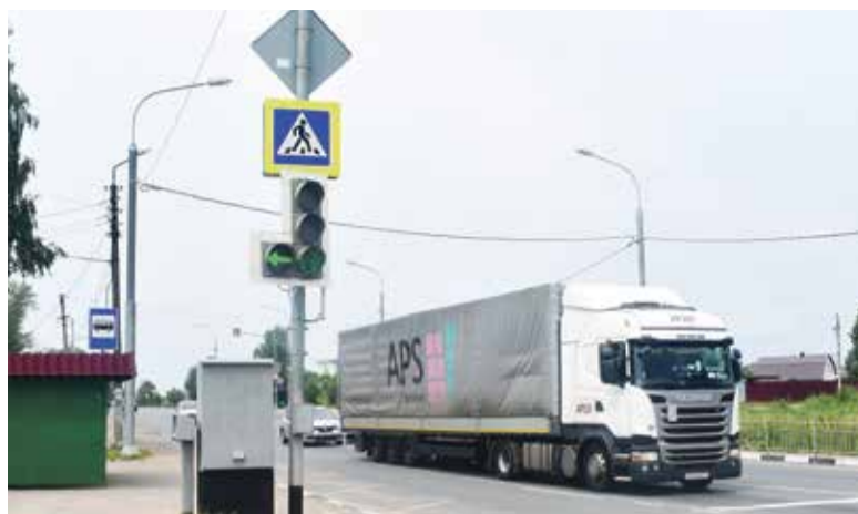
► ... на этом участке у нас уже долгое время не было ДТП, а до того, как была установлена стрелка, разъехаться у водителей получалось не всегда.

? — Служба ваши ожидания оправдала? Или поначалу пришлось столкнуться с какими-то трудностями?