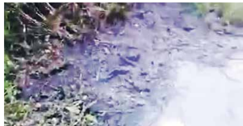
► По словам жителей, КНС на Островского в Ермолино текла в Протву около 4 месяцев.