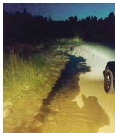
► Соседи поймали кривчанина прямо во время откачки септика.

без сомнения есть. Однако саму ситуацию нужно решать с участием «Калугаоблводоканала», поскольку их дюкер забился, и из-за этого содержимое коллектора пошло через край.