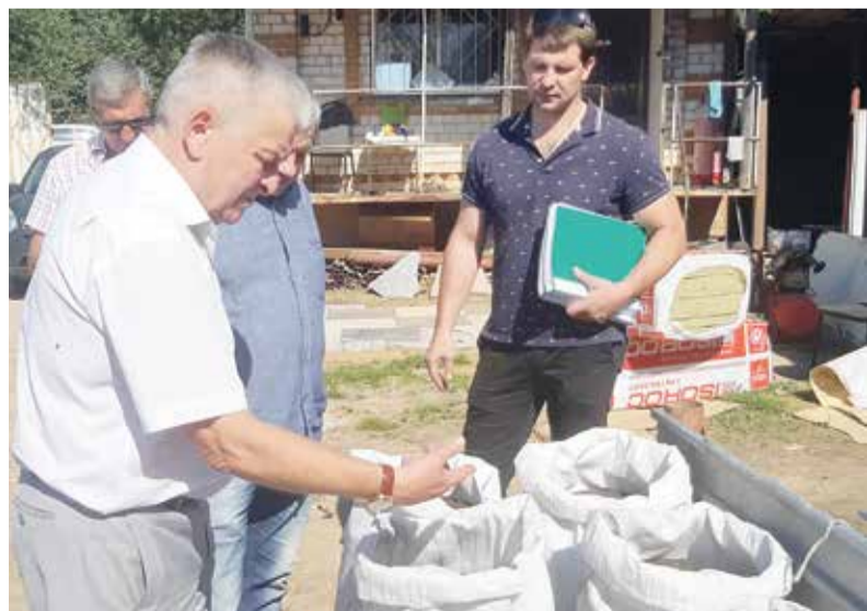
► В результате поступающие отходы перерабатываются в плодородный перегной.