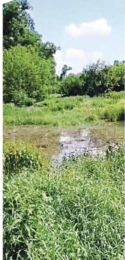
► Стоки с канализации в Боровске впадают в реку рядом с местом купания.