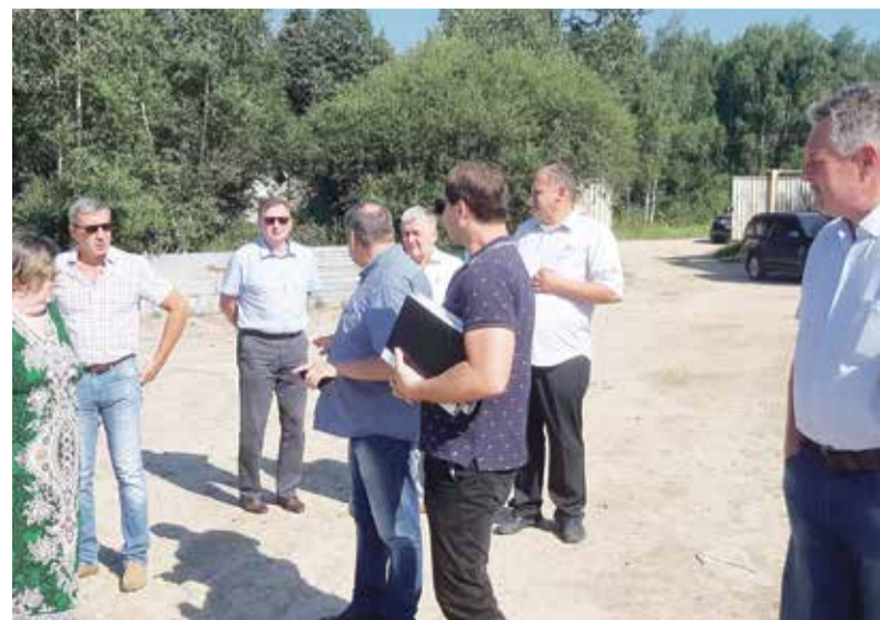
► Депутаты и чиновники всех уровней продолжают держать ситуацию с «Трансметом» на постоянном контроле.