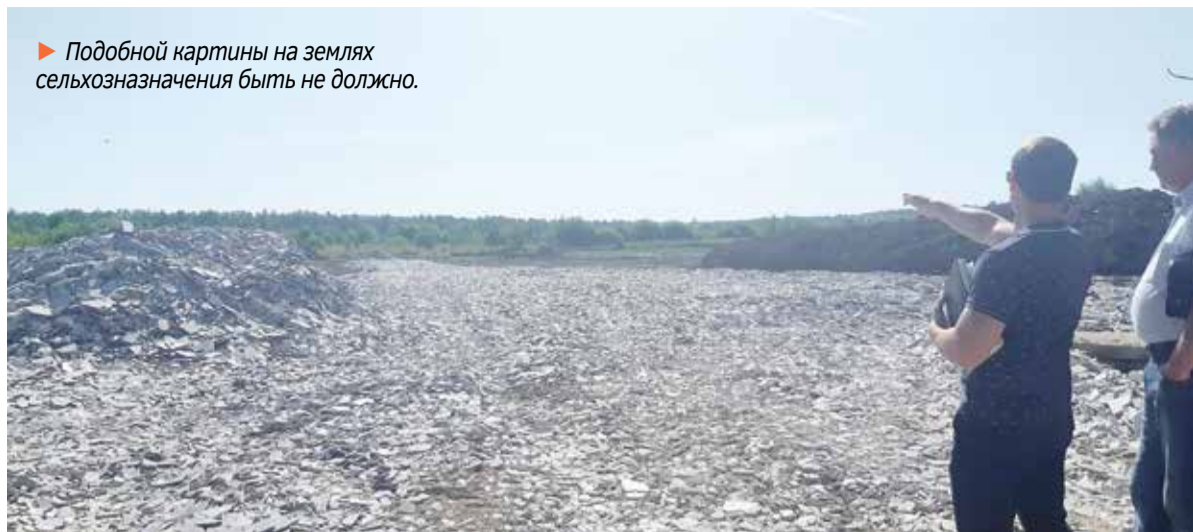
► Подобной картины на землях сельхозназначения быть не должно.

Поэтому заглянув на второй участок, делегация сразу же завалила директора вопросами, на каком ос-